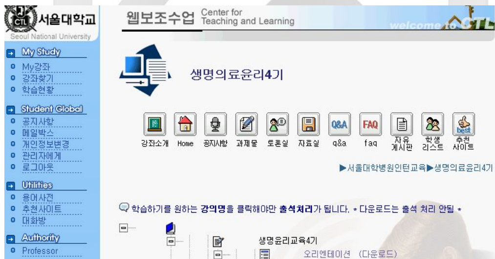
그림 1. 웹사이트 화면

이 강좌를 수강하기 위해서 학생은 먼저 수강신청을 한 뒤 승인을 받아야 한다. 승인 후 본인의 아이디와 패스워드로 로그인을 하면 위와 같은 화면이 뜬다. 강좌소개/공지사항/과제/토론실/자료실/Q&A/FAQ/자유게시판/학생리스트/추천사이트와 같은 메뉴가 있고 아래에는 해당 주의 교안 제목이 열거되어 있어 이를 클릭하면 교안이 바로 뜨게 되어 있다. 학생이 교안을 읽음으로써 수업이 이루어지며 출석은 해당 웹사이트에 접속하여 일정 시간 이상 머물면서 교안을 내려받으면 가상대학 서버가 이 시간을 체크하여 출석 여부를 판정하게끔 되어 있다. 출석 인정 시간은 교수진이 교수 메뉴에서 미리 설정해 놓을 수 있다. 물론 이 시간만으로 정확한 출석 여부를 따지기는 어렵기 때문에 실제 내용의 이해는 매주 과제를 부과하여 그에 대한 보고서를 받아서 판정하였다. 한 교육 세션은 오리엔테이션을 포함하여