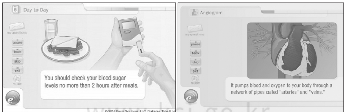
<Figure 6> Emmi Program 예시.