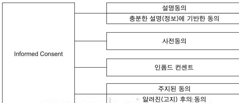
<Figure 1> 국내에서 통용되는 인폼드 컨센트의 대표적 용어.

간호학대사전은 동의가 도입된 역사적 배경에 대한 설명을 시작으로 인폼드 컨센트의 세 가지