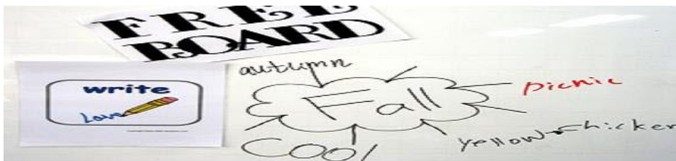
그림 5. 자유게시판.