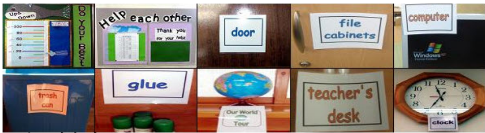
그림 4. 영어 이름표.