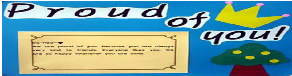
그림 2. 칭찬 게시판.

노래 게시판에는 평소 영어 수업시간에 배운 팝송이나 영화 등을 통해 알려진 노래와 점심시간을 이용해 들은 영어 동요 중에 학생들의 선호도가 높은 노래를 표 3 과 같이 선별하여 가사를 게시하였다.