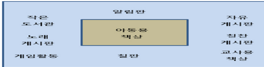
그림 1. 교실 영어환경 구성 구조도.

교실 영어환경 구성 내용은 표 2 에서처럼 읽기, 쓰기, 대집단 활동이 이루어 질 수 있도록 8 개의 코너로 구성하였다. 읽기영역은 칭찬 게시판을 활용하여 칭찬의 글을 게시하였고, 노래 게시판을 활용하여 영어노래 가사를 게시하고 노래를 들어 볼 수 있게 하였으며, 알림판을 활용하여 단어를 그림과 함께 제시하였다. 작은 도서관코너를 활용하여 한 주에 한 권씩 영어 동화책을 소개하듯이 해당 책을 비치하였고, 영어 이름표를 교실 안 물건에 비치하였다. 쓰기 영역은 자유 게시판을 활용하여 흥미 있는 주제에 대해 마인드맵을 자유롭게 작성할 수 있도록 구성하였으며 대집단 활동 영역은 보드 게임과 같이 영어로 제시된 게임을 할 수 있도록 구성하였다.