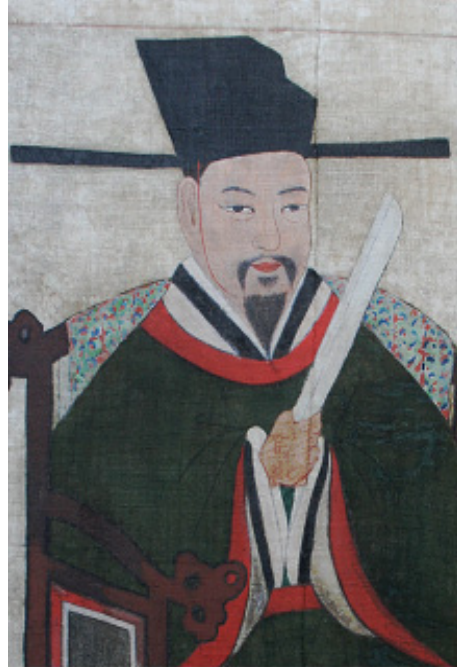
그림 6. 은렬사 모사본 부분도