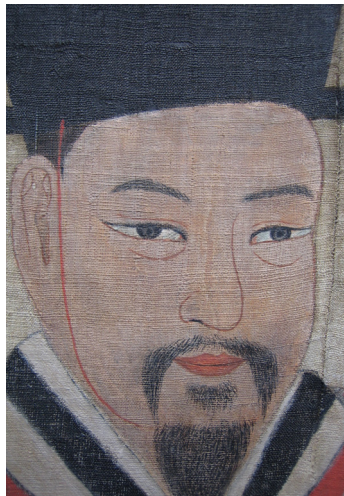
그림 12. 은렬사 모사본 부분