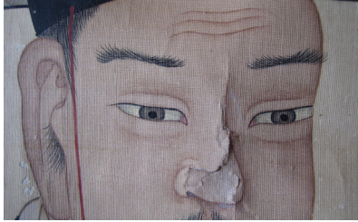
그림 13. 은렬사 범본 부분