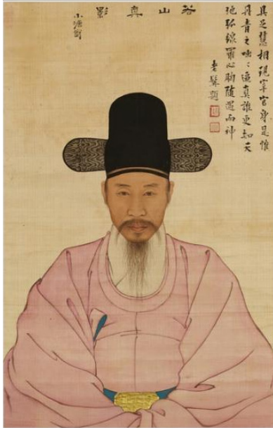
그림 21. 李在寬, <姜彝五 肖像>, 보물 제 1485호, 絹本彩色, 63.9cm×40.3cm, 국립중앙박물관 소장