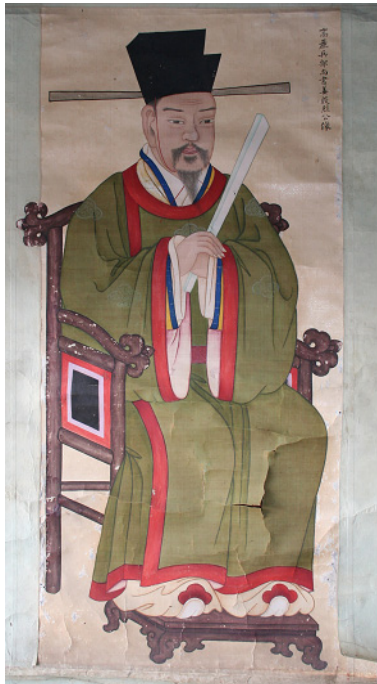
그림 2. <殷烈公 姜民瞻 影幀> 범본, 시도유형문화재 453호, 絹本彩色, 112.4cm×51.2cm, 은열사 소장