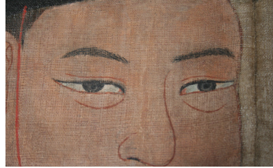
그림 14. 은렬사 모사본 부분