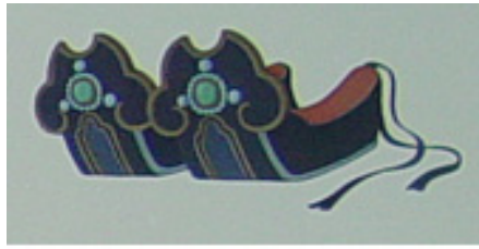
그림 10. 馬