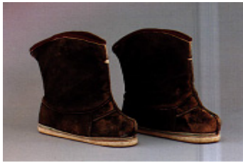
그림 9. 靴