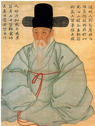
그림 19. 姜世兪, <自畫像> 1782년, 보물 제 590-1호, 絹本彩色, 88.7cm×51.0cm, 국립중앙박물관 소장