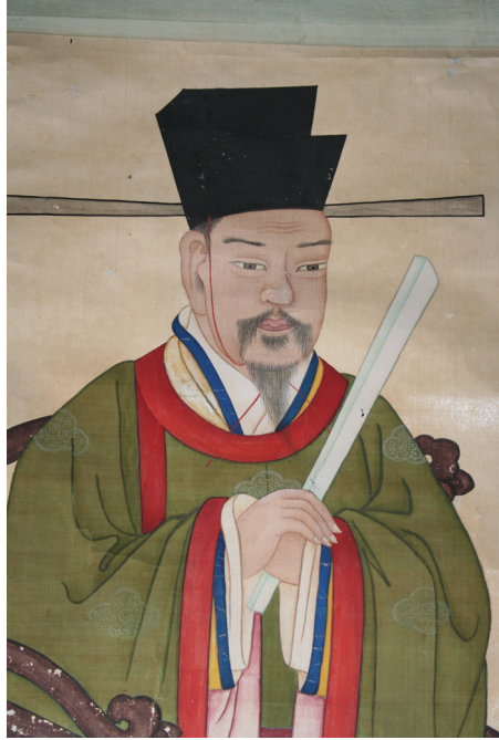
그림 5. 은렬사 범본 부분도