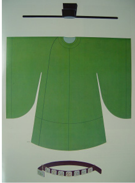
그림 7·8. 宋代 官服 - 展脚幞頭, 大袖袍