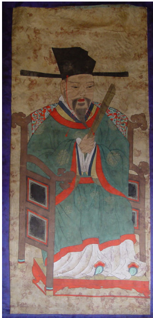
그림 24. <殷烈公 姜民瞻 影幀> 명주에 채색, 114.0cm×50.0cm, 경북 금릉군 남면 운남동 숙청각 소장