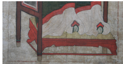
그림 18. 은렬사 모사본 부분