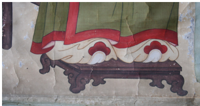
그림 17. 은렬사 범본 부분