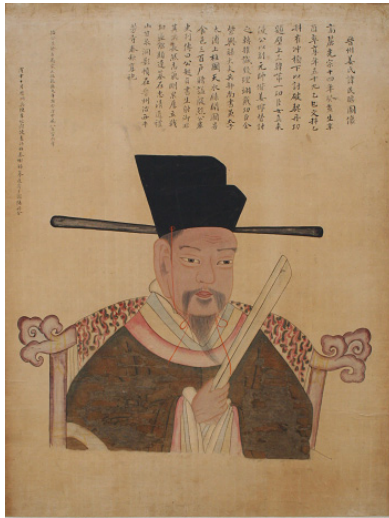
그림 22. <殷烈公 姜民瞻 影幀>, 1788년, 보물 제588호, 紙本彩色, 80.3cm×61.4cm, 국립중앙박물관 소장