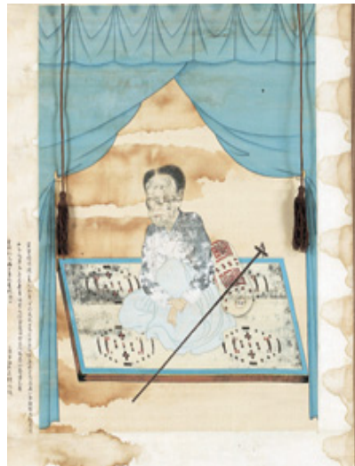
그림 20. 姜世兪, <福川吳夫人 影幀>, 1761년, 絹本彩色, 79.0cm×60.0cm, 개인 소장