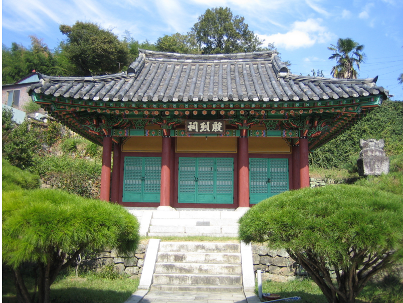
그림 1. 은열사, 경상남도 기념물 제14호, 경남 진주시 옥봉동