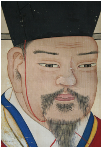
그림 11. 은렬사 범본 부분