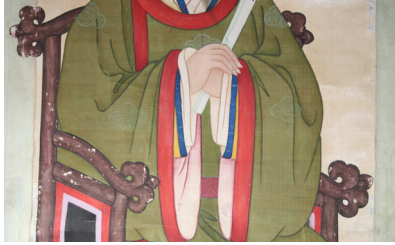
그림 15. 은렬사 범본 부분