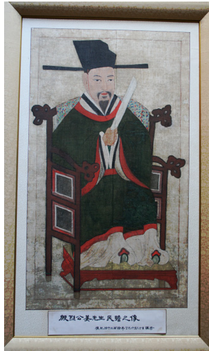
그림 3. <殷烈公 姜民瞻 影幀> 모사본, 麻本彩色, 111.6cm×65.3cm, 은열사 소장