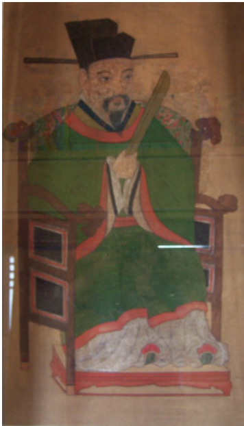
그림 23. <殷烈公 姜民瞻 影幀> 絹本彩色, 120.0cm×60.0cm, 경남 하동군 옥종면 두방재 내 두방영당 소장