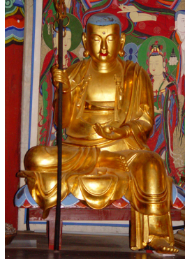
<그림 12> 청량사 목조지장보살좌상, 조선(16세기), 경북 봉화