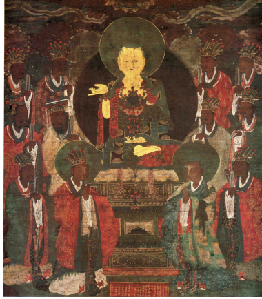
<그림 21> 지장시왕도, 조선(1562년), 견본채색, 95.2×85.4cm, 日本 光明寺