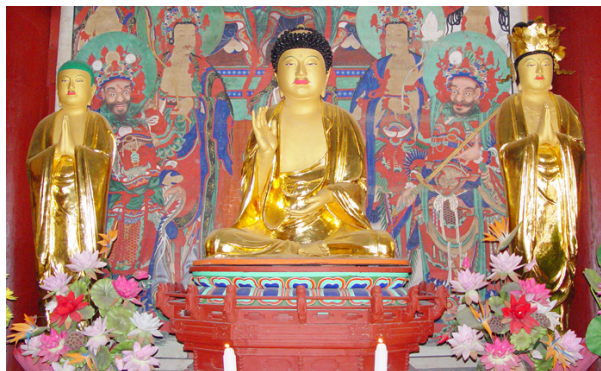
<그림 16> 신안사 목조아미타삼존상, 조선(16세기), 충남 금산 보살상이라 판단된다. 17) (그림 16)

15세기 보살상의 보계가 다섯 가닥으로 부채꼴로 높이 말아올린 형태로 머릿결을 촘촘히 표현하고, 수발을 어깨 위에 고리를 만들고 팔꿈치까지 곡선을 그리며 길게 흘러내리도록 표현한 것에 비하면 16세기 보살상의 보계와 보발의 표현은 매우 단순화된 것이다. 17) 보살상을 상징하던 수발을 표현하지 않는 것은 상당히 독특한 특징으로 수발 없는 16세기 보살상 가운데 가장 이른 시기의 작품은 기림사 건칠관음보살좌상이고, 서산사 목조보살좌상와 완도 관음사 목조보살좌상도 어깨 위로 흘러 내리는 수발의 표현이 생략되었다. 제작연대를 알 수 없는 신안사 목조관음보살입상의 보계도 높이 솟아 둥글게 말아올렸는데 그 폭이 매우 넓은 큰 편이고, 듬성하게 빚어내린 보발은 귀를 휘감아 돌지만 역시 수발이