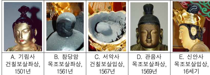
<그림 15> 16세기 보살상 보계 및 보발

15세기 보살상의 보계가 다섯 가닥으로 부채꼴로 높이 말아올린 형태로 머릿결을 촘촘히 표현하고, 수발을 어깨 위에 고리를 만들고 팔꿈치까지 곡선을 그리며 길게 흘러내리도록 표현한 것에 비하면 16세기 보살상의 보계와 보발의 표현은 매우 단순화된 것이다. 17) 보살상을 상징하던 수발을 표현하지 않는 것은 상당히 독특한 특징으로 수발 없는 16세기 보살상 가운데 가장 이른 시기의 작품은 기림사 건칠관음보살좌상이고, 서산사 목조보살좌상와 완도 관음사 목조보살좌상도 어깨 위로 흘러 내리는 수발의 표현이 생략되었다. 제작연대를 알 수 없는 신안사 목조관음보살입상의 보계도 높이 솟아 둥글게 말아올렸는데 그 폭이 매우 넓은 큰 편이고, 듬성하게 빚어내린 보발은 귀를 휘감아 돌지만 역시 수발이