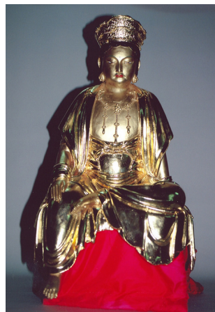
<그림 1> 기림사 건칠보살좌상, 조선(1501년), 경북 경주