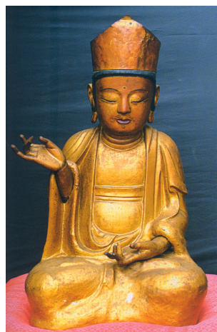
<그림 4> 서산사 목조보살좌상, 조선(1534년), 제주도 남제주군

서산사 목조보살좌상은 높이 56cm로 중품 하생인과 유사하나 1지와 3, 4지를 마주하게 한 손모습을 취하고 결가부좌하였다. 신체에 비해 얼굴이 크고 어깨와 무릎이 좁다. 머리 위에는 문양장식이 전혀 없는 청동제보관을 쓰고 있고, 얼굴은 방형이지만, 턱이 각지지 않고 턱선이 완만히 둥글다. 눈두덩이가 밋밋하고, 눈꼬리가 올라간 눈은 길며, 코가 오뎅하고 콧폭을 넘지 않는 입은 입술선을 뚜렷하게 표현하여 선이 고우며 표정도 온화하다.