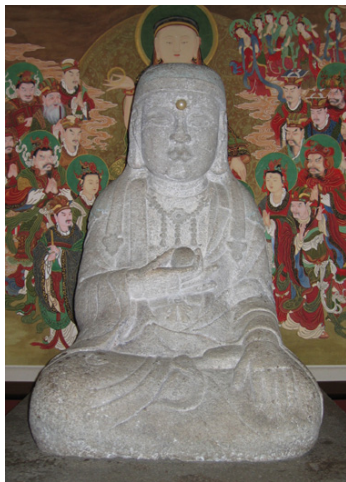
<그림 18> 선운사 참당암 석조지장보살좌상, 조선(15세기), 전남 고흥

15세기 지장보살상은 대부분 아미타여래의 협시불로 등장하고 있고, 전각 내에 본존불의 성격을 띠며 절대연대가 있는 작품은 없으며, 다만 15세기작으로 추정되는 선운사 참당암 석조지장보살좌상이 있다. 금강산 은정굴 금동아미타삼존상(1451년), 매곡동 금동아미타삼존상(1468년), 무위사 목조아미타삼존상(1478년경), 개심사 목조아미타삼존상(1484년경) 등 여래의 우협시불이 모두 지장보살상이다. 고려후기부터 아미타여래의 우협시로 대세지보살 대신 지장보살이 빈번하게 등장하고 있으며, 조선전기에도 계승되고 있다. 사후세계에 관여하여 망자의 죄를 구제해주고 지옥에 떨어진 중생을 인도하여 정토세계로 이끌어 주는 지장보살은 유교가 국가이념인 조선시대에도 유행할 수밖에 없었다. 세종 2년에 왕대비의 齋를 위해 지장보살과 시왕 앞에 올리는 물품을 각기 달리했다는 내용과 세조가 죽은 왕세자를 위해 『地藏經』을 寫經하거나 백성들을 위해 『地藏菩薩本願經』을 국역하여 간행하는 등의 내용을 비추어 볼 때, 15세기에는 신분을 떠나 유행했던 지장신앙의 단면을 가늠해 볼 수 있다. 19) 그러나, 15세기 독존의 지장보살상은 선운사 참당암 석조지장보살상 뿐이다(그림 18) 이 석조지장보살좌상은 높이 80cm의 두건형 지장보살상으로 오른손에 보주를 받쳐 쥐고 걸가부좌하였는데, 불살이 통통히 오른 둥근 얼굴의 뚜렷한 이목구비, 부드러운 층계를 이루는 옷주름의 표현, 촘촘하게 주름 잡힌 두건과 장식성이 돋보이는 두건 띠의 끝마무리 등이 특징적이어서 15세기 작품이라 생각된다. 15세기에 조성된