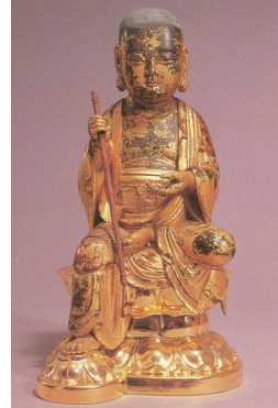
<그림 13> 목조지장보살좌상, 조선(16세기), 동국대학교박물관