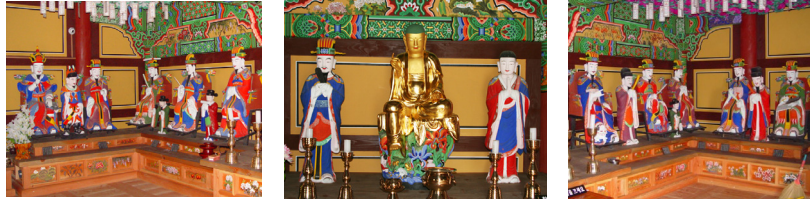
<그림 19> 달성사 명부전 목조지장시왕상 및 권속상 일괄 배치도