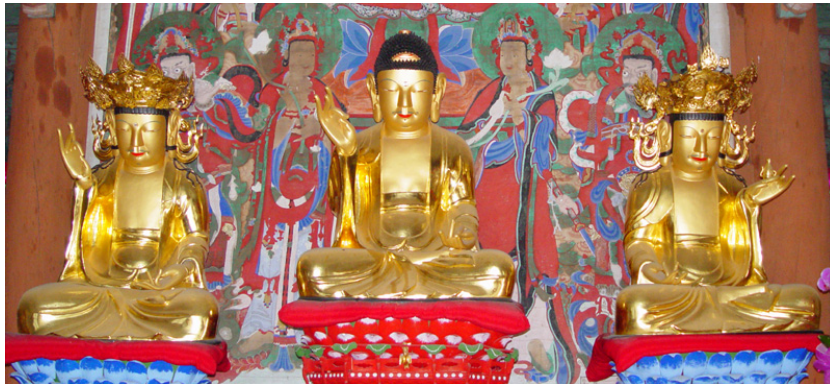
<그림 5> 선운사 참당암 목조아미타삼존상, 조선(1561년), 전북 고창

선운사 참당암 대웅전에 봉안된 아미타상의 좌우협시인 목조관음·대세지보살좌상은 고개를 약간 숙인 자세로 머리에는 보관을 쓰고, 중품하생인을 취하여 결가부좌하였다.