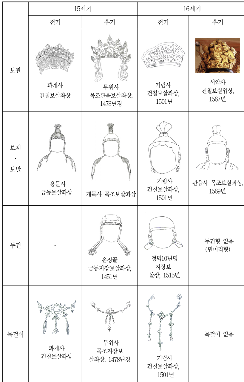
<표 2> 조선전기 보살상의 시기별 머리 및 장엄구 표현

기 지장보살상 작품과 기록, 16세기 지장시왕상 작품들을 통해 지장신앙의 성행과 균집형 도상 출현 배경을 추측해 볼 수 있을 것이다.