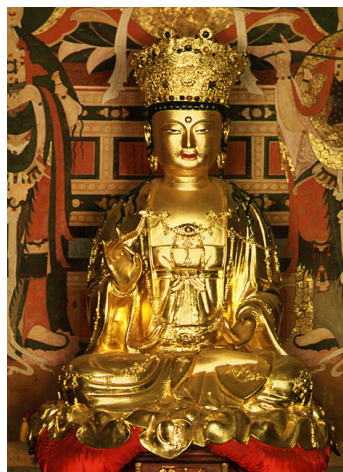
<그림 17> 파계사 건칠보살좌상, 조선(15세기), 대구

그리고, 16세기 보살상은 15세기 보살상인 파계사 건칠보살좌상(그림 17), 낙산사 건칠보살좌상, 은혜사 운부암 금동보살좌상처럼 온몸을 휘감아 나타내던 영락장식은 물론이고, 목걸이 장식을 착용한 사례도 거의 없다시피 드물다. 다만, 기림사 건칠보살좌상은 목걸이 장식이 나타나지만, 수식이 3개가 늘어져 단순하게 표현되어 간략화된 양상을 보인다. 16세기 보살상의 장식성 생략 및 단순화는 앞서 살펴 본 수발의 생략과 같은 맥락에서 생각해 볼 수 있을 것이다.(표 2)