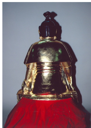
<그림 2> 기림사 건칠관음보살좌상 뒷면