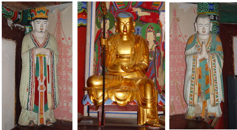
<그림 20> 청량사 목조지장삼존상, 조선(16세기), 경북 봉화

함께 봉안된 작품이고, 현재는 전각 입구를 지키는 장군상이 후대에 조성하여 시립하고 있다.(그림 19) 또한 달성사 지장보살좌상과 민머리, 반가좌의 자세, 의습 표현 등이 유사한 청량사 목조지장보살좌상도 도명존자상, 무독귀왕상을 함께 봉안하고 있어 권속과 함께 등장하는 도상이 성행되기 시작했음이 확인된다.(그림 20) 16세기에 조성된 불화 50여점 가운데 15점 가량이 地藏十王圖이고, 대부분 시왕, 지옥 권속과 군집도를 이루는 점은 이와 같은 맥락이라 하겠다. 20)