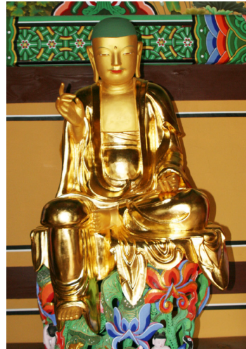
<그림 6> 달성사 목조지장보살좌상, 조선(1565년), 전남 목포

민머리형의 달성사 목조지장보살좌상은 명부전의 주불로서 반가좌의 자세로 앉아 있고, 그 좌우에 도명존자와 무독귀왕, 시왕, 판관, 인왕상들이 함께 봉안되어 있다. 명부전 내에 지장보살상이 지옥 권속들과 군집형으로 등장하는 것은 이전 시기에는 나타나지 않는 16세기의 새로운 도상이다. 지장보살상의 얼굴은 방형에 가까우나 가름하고, 미간이 넓고 눈이 좌우로 길며 입술이 얇고 가늘어 맛맛하고, 입 끝이 살짝 올라가 온화한 인상을 풍긴다.