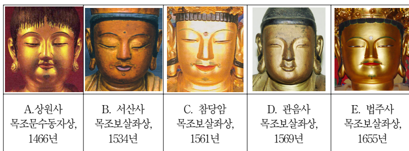
<그림 10> 조선시대 보살상 얼굴표현

첫 번째는 얼굴표현의 변화이다. 16세기 보살상은 15세기에 비해 신체비례 면에서 얼굴이 신체에 비해 커지고, 얼굴표현은 각진 방향으로 변화되고 있다. (그림 10) 15세기 보살상인 상원사 목조문수동자상도 얼굴이 방형이기는 하나 불상이 통통하게 올라오고, 턱선이 둥글어 환미감과 입체감을 준다. 반면 16세기는 제주 서산사 목조보살좌상, 서악사 건칠보살입상 13) , 완도 관음사 목조보살좌상에서 보아지듯이 얼굴이 신체에 비해 더욱 커지고, 대체로 1대 1 비율의 방향으로 얼굴의 볼륨감이 사라져가며, 턱선은 둥글어 부드러움이 남아 있다. 한편, 16세기 후기에 매우 각지고 둔탁한 방향의 얼굴 표현을 한 보살상도 등장한다. 그 대표적 작품사례가 선운사 참당암 목조관음·대세지보살좌상이다. 참당암 목조보살좌상의 얼굴은 거의 1 대 1의 길이와 폭의 비율로 확인한 방향이고 14) , 작고 좌우로 긴 눈, 콧등이 넓은 코, 얇고 좌우로 긴 입 등의 표현에서 딱딱하고 굳은 인상을 주며, 이러한 특징은 범주사 목조관음보살좌상(1655년)과 같이 17세기 불교조각