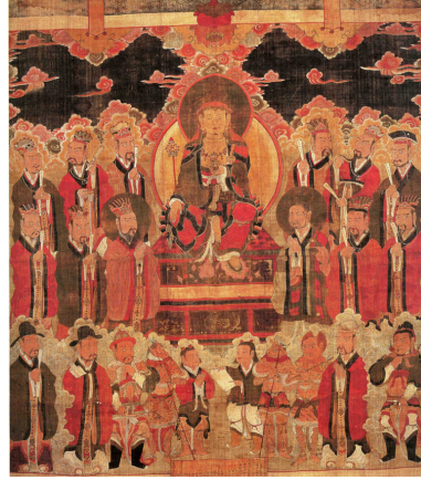
<그림 22> 지장시왕도, 조선(1586년), 마본채색, 196.1×175.8cm, 日本 國分寺

지 않다 16세기가 되어서 지장시왕 도상이 불상과 불화로 출현하는 것이다. (그림 21, 22)