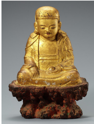
<그림 3> 正德10年銘 석조지장보살상, 조선(1515년), 국립중앙박물관

正德10年銘 석조지장보살상은 높이 33.4cm의 소형불로 16세기 보살상 가운데 유일한 두건형 지장보살상이다.