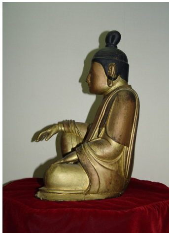
<그림 9> 완도 관음사 목조보살좌상 좌측면

고개는 사뭇 딱딱해 보인다.(그림 9) 넓은 어깨, 약간 나온 아랫배 등에서 당당하고 풍만한 신체적 감각이 느껴지며, 따로 제작된 손에서 섬세함이 돋보이는 작품이다. 머리에는 두 가닥으로 둥글게 말아올린 보계가 있고, 보발은 수발이 생략되고 모발의 세부를 표현하지 않아 간결하다. 가름하면서도 살짝 보이는 방형 얼굴은 반달형의 눈, 오뚝한 코, 폭이 넓은 인중, 윤곽이 또렷한 입 등이 특징적이며, 오목 조목한 이목구비는 친근하고 웃음짓는 듯한 표정이 연출된다.