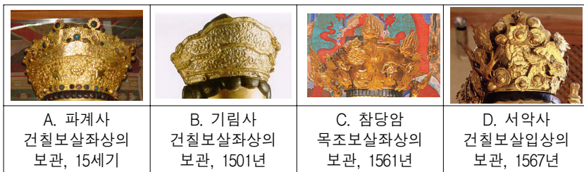
<그림 14> 조선전기 보살상 보관

때 함께 조성된 보관이 남아있는 사례가 드문 가운데, 기림사 건칠보살좌상은 15세기 전기에 보이던 원통형 보관으로 2단으로 나뉘어 관면에 모두 당초문을 도드라지게 표현하고 있다. 투각의 기법이 사용되던 15세기의 보관에 비해 정교함이 떨어지지만, 주문양이 식물문이라는 점과 2단의 원통형보관이라는 점에서 전통양식을 반영하고 있다. 이외 참당암 관음·대세지보살상과 서악사 관음·대세지보살입상의 보관은 대체로 보관의 단이 사라지고, 원통형 보관에 운문, 국화문, 화염보주문을 따로 제작하여 삐곡히 부착하였는데, 부착하는 문양이 시기가 떨어질수록 크고 많아지는 경향을 띤다. 이러한 보관은 17세기에 더욱 성행하게 된다.