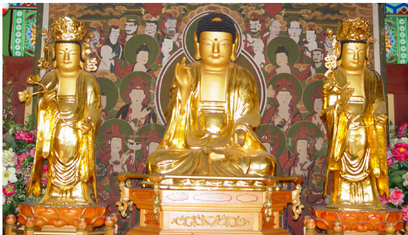
<그림 7> 서악사 건칠아미타삼존상, 조선(1567년), 경북 안동