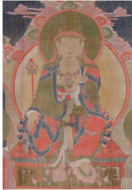
<그림 11> 國分寺 지장시왕도의 부분, 조선(1586년), 日本 山口縣