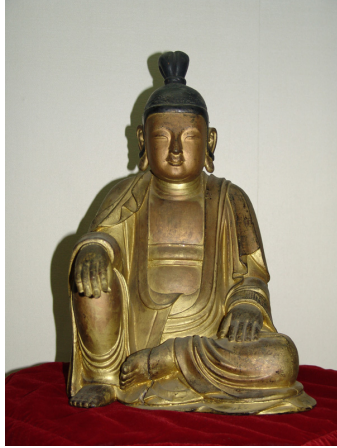
<그림 8> 완도 관음사 목조보살좌상, 조선(1569년), 전남대학교박물관