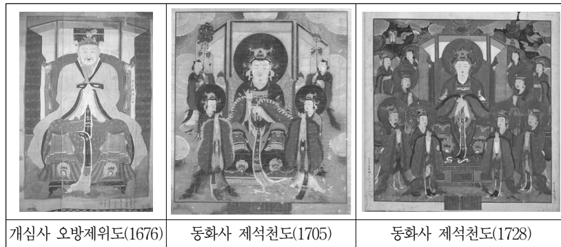
그림 6. 조선후기 <五方帝位圖>와 <帝釋天圖> 도상

이상과 같이 조선후기 18세기 이후 정착된 현왕도 가운데 정면향 도상의 현왕도를 중심으로 도상 특징에 따라 몇 가지 그룹으로 구분하여 간략히 살펴 보았다. 그 결과 18세기 초반에는 <오방오제위도> 나 <제석천도> 와 같은 천부 도상에서 차용된 형식을 보이고 있으나, 이후 점차 시왕도의 도상을 공유하며 확립되었다. 18세기는 정면향에 의좌상과 입상 형식이 혼재되어 나타나지만, 19세기 이후에는 측면향에 의좌상으로 확립되는 것을 알 수 있다. 이 가운데 <보광사 현왕도>는 조선후기 현왕도 중 이른 시기인 기림사 현왕도(1718)나 남장사 현왕도(1788), 마하사 현왕도(1792) 등 고식 계열의 도상 구성과 형식을 답습한 것으로 보인다. 특히 정면향과 권속들의 자세, 좌우 배치, 손에 든 지물, 병풍 표현 등에서 동일 초본을 공유한 도상으로 추정되는 예산 <보덕사 현왕도>(1865)는 적어도 동일 계보의 화승 그룹에 의하여 조성된 작품으로 추정하였다.