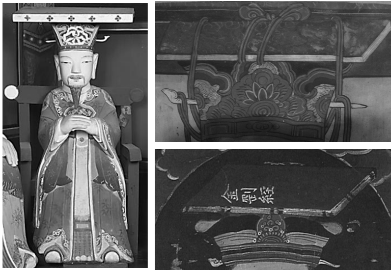
그림 2. 『금강경』 얹은 관을 쓴 염라대왕상과 현왕의 보관 위 경책

에서 반드시 수록되는 奉請 대상이다. 3) 그리고 머리에 검은 幘頭를 쓴 하급관리의 모습인 判官은 현왕의 좌우보처를 보조하는 인물로서 童子 등과 명부계 <十王圖>에 등장하는 도상 및 인물과 차이 없이 동일하게 그려졌다. 이들 권속들은 모두 화면 중앙의 정면향을 취한 현왕에게 향하도록 인물 간의 동적인 시선과 배치를 유도하고 있다.