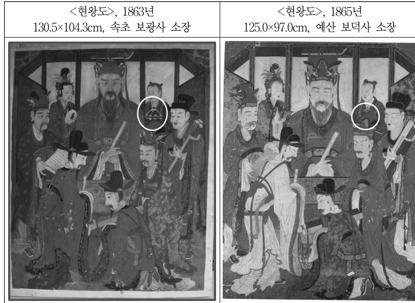
드림 3. 속초 보광사 소장 <현왕도>와 예산 보덕사 <현왕도> 비교