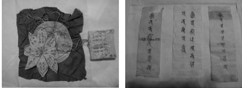
그림 8. <보광사 현왕도>의 복장품 중 황초복자와 후령통, 범서 다리니

<보광사 현왕도> 복장원문의 내용을 살펴 보면, 여기에 수록된 인물들과, 1863년 음력 5월 6일 강원도의 고성 화엄사 水月道場佛事 13) 때 조성된 <지장시왕도> 화기에 언급된 인물들과 대부분이 중복되는 것을 알 수 있다. 먼저 현왕도 복장원문의 첫 구절에는, ‘원컨대 이 공덕을 모든 중생들께 회향하오니 저희들과 중생들이 극락세계에 왕생하여 무량수를 친견하고 함께 성불하여지이다’라는 14) 공덕계 발원문을 적었고, 곧이어 불화의 조성 연대를 기재하였다. ‘승정기원후사계해 단양후오일崇禎紀元後四癸亥端陽後五日’ 즉, 승정기원후 네 번째 맞는 계해년은 1863년이며, 端陽은 음력 5월 5일 단오를 의미한다. 즉 단오 5일날 봉안했다는 것이다.