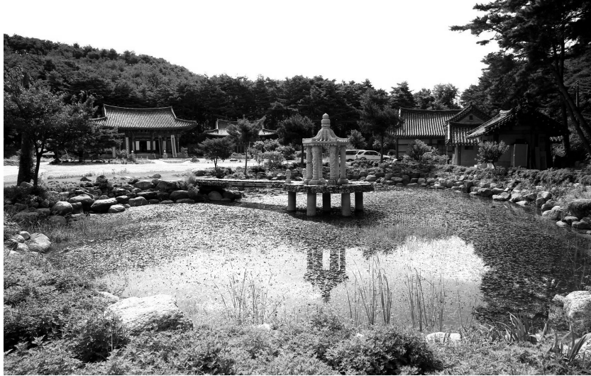
그림 1. 보광사 전경, 강원도 속초시 동명동

벽에 〈현왕도〉를 봉안하였다. 규모는 세로 130.5cm, 가로 104.3cm 크기의 패널 형태로 먼 바탕에 채색을 베풀었다. 바탕 면은 좌우로 두 폭을 연결하여 하나의 화폭을 형성하였다. 화면은 전체적으로 하단부에 촛농에 의한 약간의 오염과 좌보처대왕의 청색포 일부에 안료의 박락 및 변색이 진행되었을 뿐 보존 상태는 양호한 편이다.