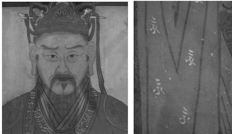
그림 4. 보광사 현왕도의 현왕 상호와 판관 법의에 시문된 음자문

현왕의 육신부는 백색 바탕에 황갈색으로 윤곽선에 음영을 주고, 눈썹과 수염 등은 먹선으로 모근을 표현하였다. 양쪽 눈의 눈꺼풀과 안와선은 황갈색으로 표현하였으며, 홍채는 진고동색을 바르고 동공과 윤곽선은 군청선으로 마무리하였다. 주변의 좌우보처와 판관도 거의 동일한 기법이나, 판관상의 육신부에 백색을 더 강조하였다. 현왕의 착의는 적색 바탕에 목둘레와 양쪽 팔끝의 가장자리