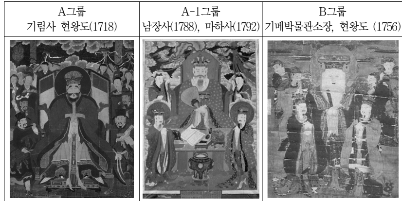
그림 5. 조선후기 정면향을 취한 현왕도 그룹