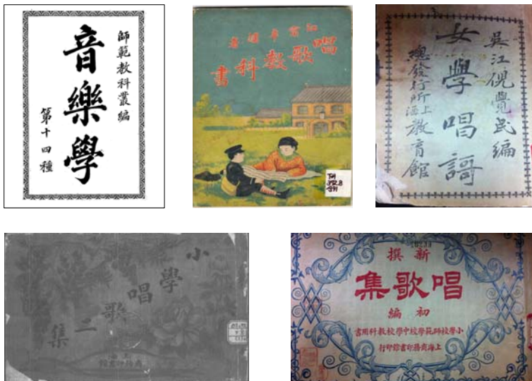
(그림 3) 학당악가집 표지들

여섯째, 작곡·작사가가 정확히 명시되어 있지 않다. 『여학창가』와 『창가교과서』를 제외하고는 수록곡에 대한 인물명이 전혀 언급되어 있지 않으며, 『여학창가』와 『창가교과서』의 경우도 수록곡 별로 한 명의 이름이 기재되어 있어 학당악가의 가사를 쓴 인물만 확인할 수 있으며, 해당 곡의 작곡가나 곡의 출처에 대해서는 확인할 수 있는 방법이 없다.