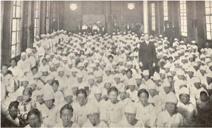
[그림 6] Meeting of Women's in Pyengyang (1930)

[그림 6]은 평양장로회신학교에서 여성부흥회가 진행되고 있는 모습을 담고 있다. 마펫 선교사의 설교로 진행된 이 날 부흥회에서 그는 신앙적 감수성을 고양하기 위해 여러 찬양을 함께 불렀을 것이며, 음악을 배경으로 기도회를 인도했을 것이다. 여성적 정체성을 재구성하되 무언가를 성취할 수 있다는 자신감과 신여성으로서의 감각을 익히는 과정이 되었다.