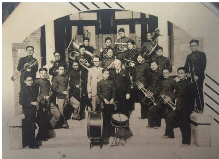
(그림 3) 숭실 밴드와 선교사 (1920년대)

1917.01.07; 『매일신보』 1920.06.12; 『매일신보』 1923.10.27; 『동아일보』 1924.02.08; 『중외일보』 1927.06.10; 『동아일보』 1927.06.11; 『중외일보』 1929.03.07; 『조선중앙일보』 1935.03.24; 조선중앙일보 1934.11.23. 등.