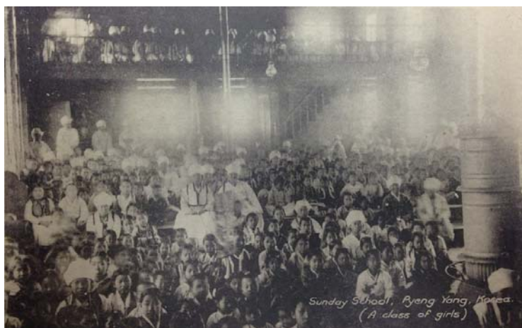
(그림 5) Sunday School, Pyeng Yang_Class of girls (1920년대)

[그림 5]는 여성들을 위한 주일학교의 모습으로, 어린 소녀부터 아낙에 이르기까지 다양한 연령대의 여성들이 예배당에 모여 있는 모습을 보여주는데, 당시의 주일학교는 보수적인 한국의 문화에 따라 남녀를 구별하여 교육하였다. 1920년 당시 가장 많은 주일학교 규모를 가지고 있었던 평양의 상황을 상징적으로 나타내고 있기도 한데, 22년부터 전국주일학교연합회가 세워지며 보다 체계적인 교육이 실시되기도 한다. 특히 찬송가 가창을 중심으로 한 음악교육은 주일학교에서 빠지지 않았으며, 아이들을 반음