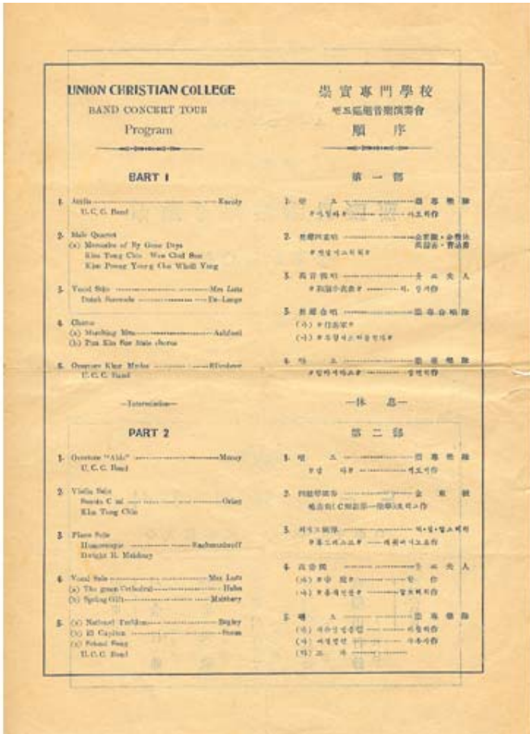
[그림 7]은 숭실전문학교 밴드의 순회음악회 팸플릿 순서를 담고 있다. 밴드 연주 중간에 선교사 루츠부인의 독창, 말스베리의 피아노 독주 등이