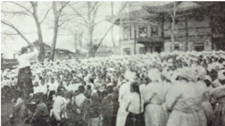
(그림 4) A Song Service in The Women's Class (1930년대)

선교기지 내부에 교회는 거의 없지만, 선교사들의 주요 활동영역이라는 점에서 선교기지의 지부로 역할 했을 것이다. 선교기지 그림에는 각종 교회와 학교에 참여한 인원수가 기재되어 있는데, 평양 도심에만 15개의 교회에 15,000명의 신도가 출석하고 있다고 나타난다. 아마도 북장로교회가 설립한 교회로 보이기 때문에 다른 교파의 교회들까지 포함한다면 그 수는 크게 웃돌 것으로 보인다. 이러한 교회들에서의 각종 음악회와 예배 의전은 선교기지 못지않은 영향력으로 서양음악 향유를 위한 중요한 토대로 역할하였다. 평양 내 교회와 공연장에서 연주가 활발하게 이루어졌다고 진술하는 초기 음악가들의 증언을 보더라도 평양의 선교기지와 교회는 단순한 종교적 의미를 넘어선다.