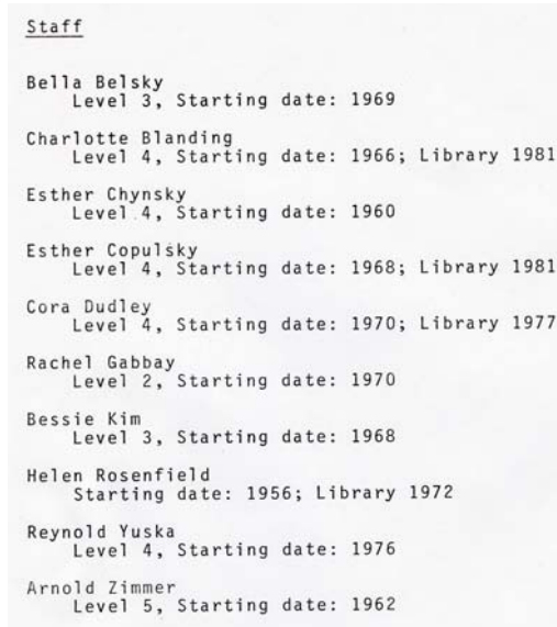
[사진 5] 롱 아일랜드 대학교 브루클린 캠퍼스 도서관 직원목록 일부 (1982년 혹은 이후에 작성) 84)

당시 도서관 직원은 일에 대한 경험과 책임 정도에 따라 총 5단계(레벨5가 최상)로 분류되었는데, 마지막 기록에 해당하는 1982년 기록에 따르면 임배세는 레벨3에 해당되었다. 당시 도서관 직원들이 어떠한 일을 했는지