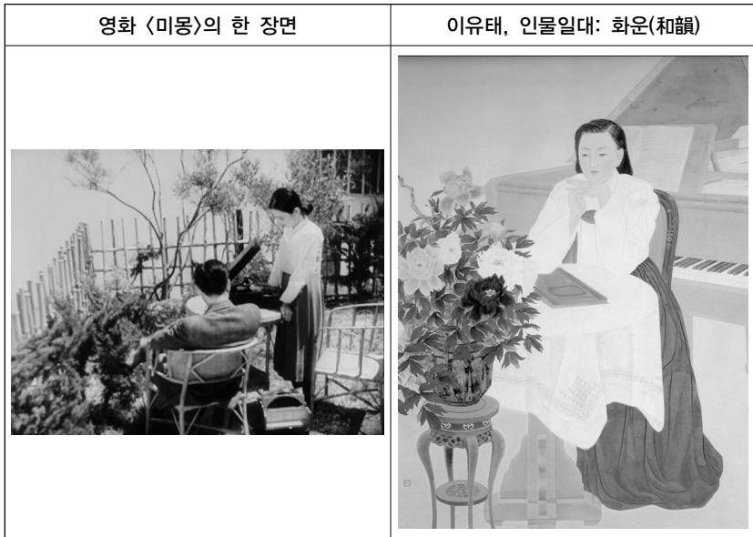
(그림 5) 영화와 회화 속 음악과 여성

현실을 반영하는 소설과 영화, 회화에서도 음악은 신여성의 모던한 라이프스타일을 대변하는 척도로 사용되었다. 영화든 회화든 단란한 가정의 이미지는 화초가 놓인 피아노 혹은 축음기 곁에서 생산되었다. 소설에서는 신여성의 대표주자로 음악 하는 여성이 종종 등장하였고 학교 밖 남학생들은 음악회를 찾아 음악회장의 여성들을 바라보았다. 이광수(李光秀, 1892-1950)의 『무정』에서 일본으로 음악을 배우러 떠나는 영채와 바이올린을 연주하는 병옥, 김남천(金南天, 1911-1953)의 『낭비』에서 이화여전과 동경음악학교를 나온 이관덕, 『사랑의 수족관』에서 재벌의 딸이자 피아노 치는 경희와 덕희, 최서해(崔曙海, 1901-1932), 김기진(金基鎭, 1903-1985)