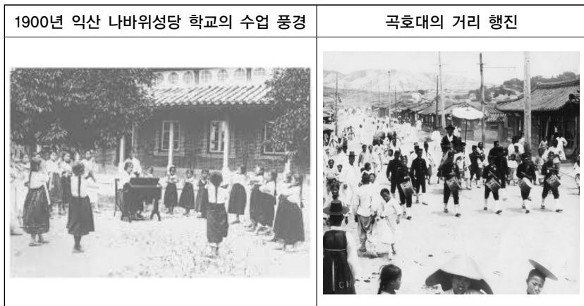
(그림 1) 시골 여학교의 음악 활동과 거리의 악기 연주

남녀노소 불문하고 모여든 “구경꾼들이 원형으로 둘러선 가운데 서서 나발 불고 북 치는” 15) 구세군 악대, “팔팔한 높다란 음악서 뒤뚱발이 같은 저음이 한 덩어리로 되어 나오는 그 웅장한 음향과 척척 맞아 들어가는 듯한 경쾌한 리듬” 16) 의 이왕직악대와 어우러졌다. “이층 노대(露臺)에서는 눈이 불거진 사람, 불이 불룩한 사람, 배가 내민 사람들이 새로 닦은 돛그릇 같은 악기를 메고, 들고, 흥겨운 몸짓” 17) 을 하는 극장 악대의 서양 악기 소리가 울렸다. 이는 조선인들에게 단순한 멜로디가 아닌 근대로 향하는 힘의 소리였다.