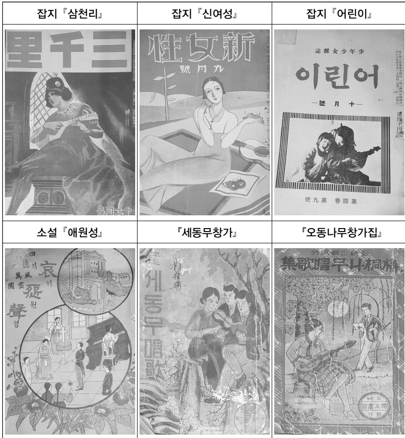
[그림 4] 악기와 여성이 그려진 표지들

이처럼 음악과 여성은 자연스럽게 짝이 되며 시각화되어 여자아이부터 성인 여성에 이르기까지 서양악기와 함께 만들어진 이미지는 근대적 여성성을 대변하였다. 39) 신여성의 조건은 근대적이냐 아니냐의 이분법적 사고