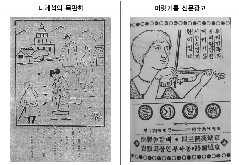
[그림 2] 나혜석의 작품과 신문광고

그러나 서양음악을 하는 여성들에게 제약은 많았다. 학교를 졸업해도 유학이나 취업의 길이 좁았고 음악하는 여성에 대한 사회 분위기도 냉랭했다. 그녀들은 선망의 대상인 동시에 비난받는 존재였다. 무대에 오르는 여성들에게는 언제나 집중과 관심이 따라다녔다. 신여성에 대한 호기심과 음악하는 것을 터부시했던 조선 사회의 조롱하는 시선에 대한 감내가 공존했다. 30) 게다가 재능보다 외적인 면모에 치중하여 실력이 아닌 외모로 평가하거나 31) 결혼하기 위하여 음악을 한다는 등의 왜곡된 시각까지 생겨났