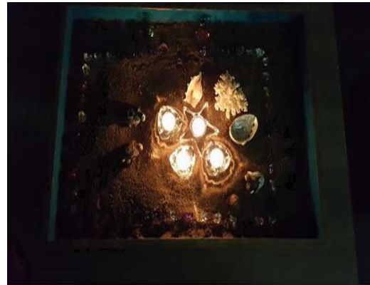
사진 1. Jane의 모래사진