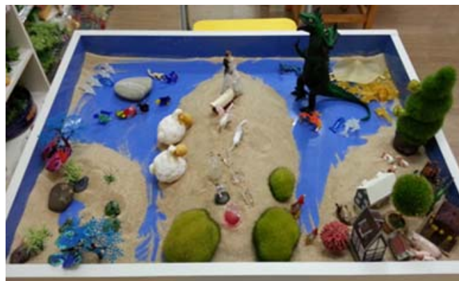
사진 5. Kim의 모래사진

산꼭대기에 있는 결혼하는 남녀 한 쌍은 악마(머리 두 개인 공룡) 뒤에 있는 세계(황금색의 돌고래 무리가 있는 곳)로 갈 수 있게 악마를 무찌를 수 있는 힘을 달라고 기도하고 있어요. 처음에는 악마가 무서웠는데... 지금은 무섭지 않아요. 악마