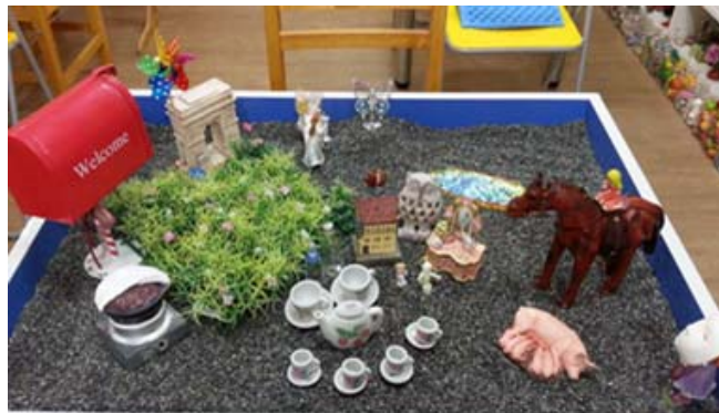
사진 4. Kang의 모래사진

사진 4는 40대 중반의 여성, Kang이 만든 모래상자다. 그녀는 어머니가 두 분이다. 친어머니와 아버지 사이에 아이가 생기지 않자, 친조부모가 강제로 아버지와 두 번째 어머니를 합방시켜 아이를 갖도록 하였다. 두 번째 어머니가 임신을 하자, 바로 친어머니도 임신을 하게 되었다. 친어머니는 여섯 명의 자식을 두었고, 그녀는 막내딸이었다. 두 번째 어머니는 네 명의 자식을 두었다. 아버지는 평생 동안 두 집의 가장 역할을 충실하게 하셨다. 친어머니와 그녀가 낳은 여섯 명의 자식들에겐 아버지에게 부인이 둘이라는 사실이 상처였고, 열등감이었다. 아버지는 지역의 리더였고, 존경받는 분이셨다. 아버지는 자식들에게 헛되게 살지 말라고, 가치롭게 살아가라고 늘 말씀하셨고, 그것을 몸소 실천하며 산 분이셨다. 다른 형제들이 아버지에게 감히 하지 못하는 말들을 그녀는 용감하게 논리적으로 의사 표현을 확실하게 했었다. 이러한 면 때문에 아버지와 크고 작은 충돌들도 있었지만, 아버지는 그녀를 가장 아꼈고, 신뢰하셨다. 아버지는 몇 년간 암으로 힘들게 투병을 하셨다. 투병 중에도 막내딸의 결혼식에 딸 손을 잡고 입장해줄 아버지 자신이 없게 될 것을 걱정하셨다. 그녀는 아버지를 위해서 결혼식 날을 서둘러 잡았다. 아버지는 결혼식 전 날까지도 병상에서 일어날 수 없을 정도로 위중했고, 주변 사람들, 가족, 주치의까지도 결혼식에 참석하는 것은 물론 딸의 손을 잡고 입장하는 것은 불가능하다고 아버지를 말렸다. 그러나 결혼식 당일 날, 아버지는 초인적인 힘으로 일어나셨고, 막내딸의 손을 잡고 보란 듯이 멋지