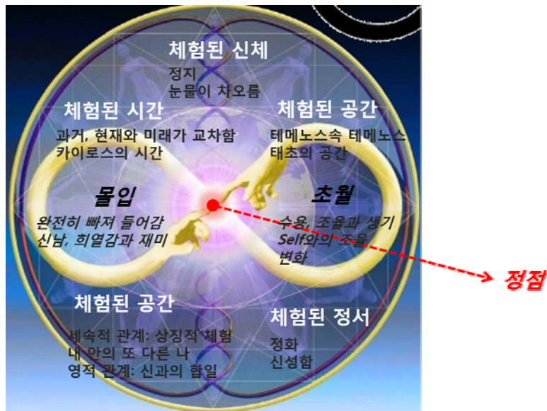
그림 3. 정점체험의 구조

몰입과 초월이라는 정점의 본질적 의미는 왜 ‘모래놀이치료(모래놀이+치료)’인지를 말해 주고 있다. 모래놀이치료에서 경험하는 다양한 체험들과 그 중 하나인 정점 체험은 앞서 살펴보았던 체험된 신체, 시간, 공간, 관계와 정서에서 서로 중첩된다. 하지만 몰입과 초월의 순간만큼은 모래놀이치료에서 정점만의 독특한 체험이라고 할 수 있겠다. 모래놀이치료의 어느 지점 즉, 몸이 정지된 채 눈물이 차오르고, 과거, 현재와 미래가 교차하면서 카이로스의 시간이 흐르고, 테메노스 속 테메노스, 태초의 공간에서 세속적 관계를 상징적으로 체험하고, 내면의 또 다른 나를 만나기도 하고, 신과 합일되는 영적 관계를 체험하면서 카