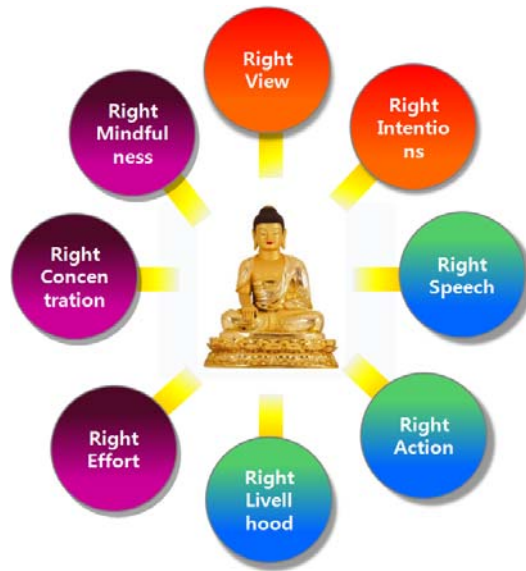
그림 2. 불교에서의 팔정도

교통사고, 남편의 교통사고, 임신 중 검진을 받기위해 병원에 가는 도중에 당한 교통사고, 교통사고로 인한 친한 이웃의 죽음, 어머니의 정신병원생활, 혹독한 시집살이, 병약한 아들에 대한 불안으로 공포와 겁에 질려 그녀 자신도 부모님처럼 미쳐버릴 지도 모른다는 극심한 불안에 떨면서 살아야 했다. 그녀는 자신이 창조한 모래사진을 보면서 한없이 눈물을 흘렸다. 그동안 치료자에게 자세히 말하지 않았던 고통들을 말하기 시작했다. 모래상자에 신성한 빛을 비추고 있는 8개의 빛과 중심의 큰 별빛은 팔정도(그림 2 참조)를 연상시킨다. 팔정도는 불교에서 수행자가 스스로 고귀하게 되는 윤리적이고 성스러운 여덟 가지의 길을 의미한다.