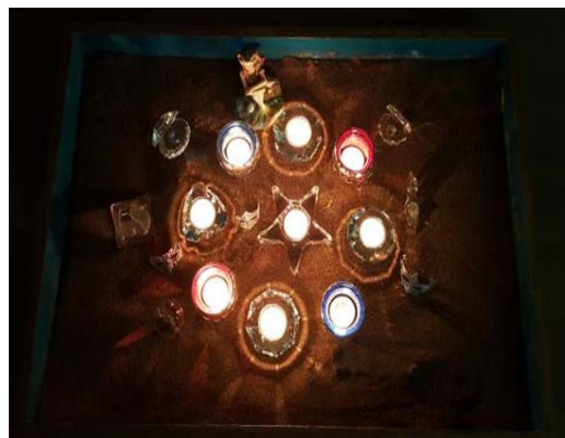
사진 3. Jina의 모래사진(12회기)