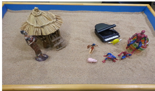
사진 10. 모래사진 18 (94회기)

아빠의 등에 아들이 업혀 있고 쌓인 눈은 포근하게 보인다. 내담자는 우체통에 ‘라인캐릭터 이벤트 당첨권’이 와 있을 거 같다고 한다. 연결을 나타내는 커뮤니케이션 도구인 ‘라인’에 당첨된 것이다. 내담자는 그의 어린 시절의 억압된 감정과 연결됨으로 아버지와의 화해에 이르렀다.