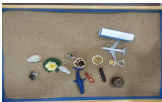
사진 2. 모래사진 2 (3회기)

우리는 첫 번째 모래상자를 통해 내담자는 앞으로 무의식의 하강이라는 힘든 과정을 통해 자신의 그림자와 아니마를 통합해가며 빼앗긴 보물, 즉 ‘자기’를 찾아가는 여정을 통과하게 될 것이라는 것을 알 수 있다. 어린 시절 성학대로 인한 상처가 폭로되고 재인식되어야 내담자의 분열된 자아는 결국에는 연결될 것이며 동시에 내담자는 이상적 페르조나가 아닌 진정한 자기로 살 수 있게 되며 이 때 평안과 안정감을 찾아가게 될 것이다.