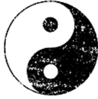
그림 1. 태극도

http://blog.daum.net/colorplaying/2475140