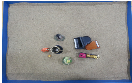
사진 5. 모래사진 13 (43회기)

Neumann은 이 단계 동안 자아가 모권에 대한 의존성을 극복하기 시작한다고 하였다. 여성성으로부터 남성의 에너지를 분리하기 시작하는 초기 단계다. 의식적인 자아는 남성적 에너지와 동일시하는 방향으로 이동해 나아간다. 남성적 에너지와 같은 자아의 성장은 자신을 유지하고 움직이기 위해서 용과 맞서 싸워야 한다(Turner, 2005/2009). 이 단계에서 나타나는 싸움은 내담자의 모래상자에서는 마술적인 피아노의 격렬한 싸움으로 나타난다.