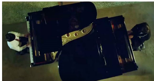
그림 2. 영화 (말할 수 없는 비밀)

흥미로운 것은 이 피아노의 모양은 영화 '말할 수 없는 비밀'(2007, 주결륜 감독)에서 나오는 피아노 배틀 장면과 일치한다. 피겨를 놓으며 내담자는 영화 이야기를 했다. 영화에서 피아노는 남자주인공 상룡과 여자주인공 샤오위를 이어주는 매개체이다. 과거 시간의 샤오위가 피아노로 '비밀'이라는 곡을 연주하면 시간여행이 시작되고 미래의 상룡과 사랑에 빠진다. 피아노 배틀 장면에서 연주하는 곡은 쇼팽의 [연습곡] 중 '흑건'이다. 더욱 인상적인 것은 검은 건반으로만 연주하는 이 흑건을 영화에서 흰 건반으로 변조해서도 연주한다는 것이다. 이제 어둠에 숨어 있던 비밀이 밝혀질 것이라는 것을 내포하는 듯했다. 이 장면은 내담자 내면의 극심한 갈등을 나타내 주고 있는 듯하며 이 싸움을 통해 무의식의 어둠에서 벗어나 자각의 빛을 향해 들어갈 것이라는 것을 말해주는 것 같다. 이제 내담자는 그의 무의식과의 싸움을 통해 성장하고 승리하는 영웅이 될 것이라는 것을 암시하고 있는 듯하다. 그리고 이후 내담자는 반 친구들과 이전보다 말도 많이 하고 인간관계를 좀 더 편안하게 적응해 나가기 시작했다.