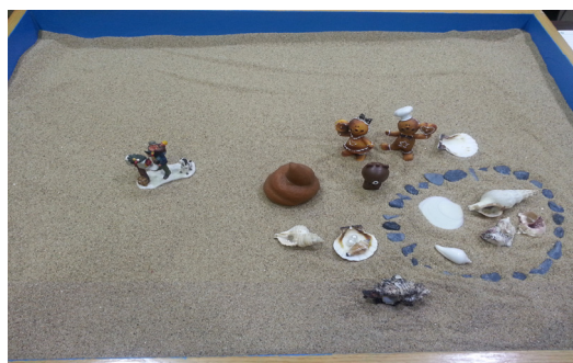
사진 9. 모래사진 17 (86회기)