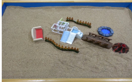
사진 8. 모래사진 16 (77회기)

77회기에 모래상자를 만들면서 내담자는 “분노를 따라서 길을 만든 거다. 세계가 펼쳐졌다. 편안함의 세계가”라고 말하며 분노의 상징으로 화산을 가져다 놓았다. 이제 분노와 억압되어 있던 어린 시절의 좌절된 성적 측면이 연결되었고 그것은 내담자를 평화로움으로 이끌었다. 이 화산은 위에서 보면 태양과도 같은 형태이다. 내담자의 감정과의 연결을 통해 태양, 즉 남성성과 어린 시절이 연결된 것으로도 보인다. 어린 시절은 미끄럼틀과 정글짐으로 상징화되었는데, 두 놀이기구 모두 오르락 내리락 하며 놀이에 빠지는 특징이 있다. 어린 시절에로의 하강과 상승 두 측면을 모두 말할 수 있겠다. 정글짐에서 ‘정글’은 무의식의 상징이다. 그 속에서 야생적으로 살고 있는 것들은 아마 무시당하고 무질서하며 반항적인 ‘동물적이거나 본능적인’ 충동들을 의미하거나, 또는 억압된 죄책감과 두려움들을 의미할 수 있다(Ackroyd, 1993/1997). 이 다리는 모래상자 #1에서도 이 방향으로 놓여있어서 내담자와의 연결을 촉구하는 듯했고 여기서는 그것이 무엇과 연결되어야 했었는지 드디어 나타났다고 보여 진다. 내담자는 이날 모래상자를 만들고 난 후 “마음에 든다”고 말했다.