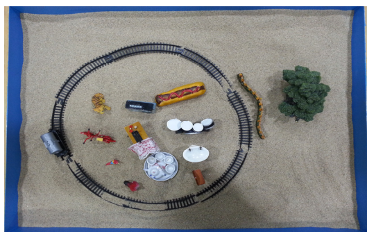
사진 6. 모래사진 14 (48회기)

48회기에 내담자는 등교를 잘하고 있다고 이야기했다. 학교에서 점심을 같이 먹는 친구와 주로 영화 이야기를 한다고 한다. 이 날 내담자는 문손잡이를 손으로 열고 기운차게 치료실로 들어오면서 “문손잡이를 잡기 시작했다”고 기뻐했다. 그는 손으로 피겨를 잡아서 놓으면서 “찝찝해, 하지만 괜찮아”라고 혼잣말을 하며 모래상자를 만들었다. “이 기차 길은 뭘까? 이 기차 길이 끝이 없네. 2호선이네. 막혀있어서 뭔가 단절되었다고 하나. 안에가 내 마음이고 경계선이고 나무는 현실인거 같다. 평화롭다 하나. 현실에 다가가기 힘들다. 이 차가 내 마음 속에서 계속 맴돌고 있다. 끝이 없다.”고 말했다. 이 원형의 기차길은 마법의 원을 연상케 한다.