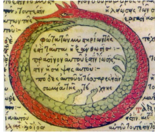
그림 3. 우로보로스 https://ko.wikipedia.org

한다. 우로보로스 안에 있는 무의식의 요소들이 수용 받고 난 후, 이 축은 연결될 것이라고 볼 수 있겠다. 여기 기차길에 Oil Can이라고 쓰여 있는 기름을 나르는 기차가 있다. Oil 기름은 헌신, 영적 광명, 자비, 풍요의 상징이며 기름을 바르는 일은 새로운 신적 생명의 주입, 신의 은총의 증여와 지혜의 수여를 상징한다(Cooper, 1978/1994). 성장의 길로 연결된 내담자에게 이제는 새로운 생명이 주입되고 힘이 운반되기 시작했음을 알 수 있다.