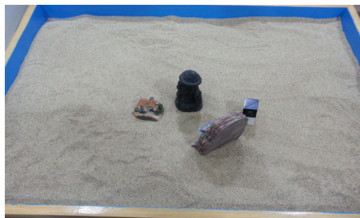
사진 4. 모래사진 10 (26회기)

남성성에 대한 혼돈과 혼란을 상징하는 어릿광대가 모래상자 #4에서는 혼돈스러운 여성의 가면으로 나타났다. 그는 자신을 혼란스럽게 하는 부정적 아버지 이마고를 극복해야 대인불안과 강박적 습관들에서 벗어날 수 있을 것이다. 내담자의 모래상자는 매 회기 반복적으로 성학대와 관련된 무의식의 여성성, 즉 아니마 상실의 고통을 보여주고 있다.