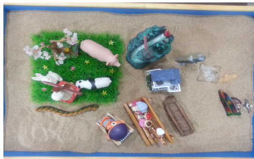
사진 1. 모래사진 1 (2회기)

첫 회기에서는 내담자와의 면담 형식으로 이루어졌고, 2회기에 내담자는 첫 모래상자를 만들었다.