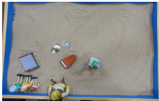
사진 3. 모래사진 4 (8회기)

2단계에서 나타나는 마술적 이고는 선프로부터 분화되면서 팽창된다. 이는 아직 존재하지 않는 경험과 행위의 객관적 한계를 초월하기 때문이다(Neumann, 1973). 이렇게 팽창된 이고는 마술적인 신화의 형태로 나타나는데 8회기의 슈렉 캐릭터가 팽창된 이고로 볼 수 있겠다. 그러나 이 때 나타난 이고는 여전히 무의식적이고 신화적이고 마술적인 특성이 있다.