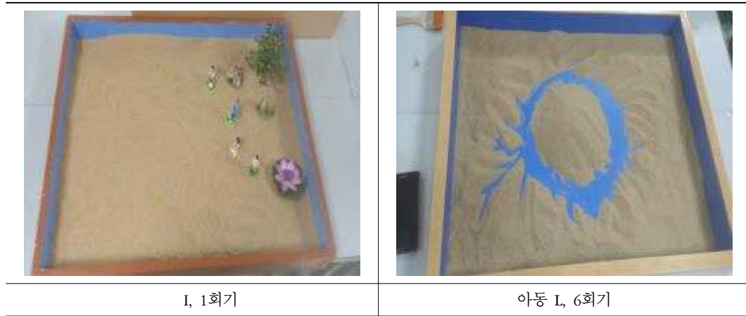
표 4. '공허' 주제의 모래장면

이러한 공허주제는 중국 조선족 아동들이 자신의 내면과 감정을 살피 여유가 없이 학업과 입시에 쫓겨 생활했기 때문에 나타난 주제라고 할 수 있다. 또한 어린시절 강제적인 분리에 의해 안정적이고 신뢰로운 좋은 내부 대상이 없을 때 이러한 공허가 나타나기도 한다 (Kernberg, 1975). 안정적이고 신뢰로운 애착대상은 아동이 사회에서 타인과 관계를 맺는데 있어 기초적인 부분으로 중요한 역할을 하며 특히 아동기에 중요한 관계인 또래관계에서도 지속적이고도 큰 영향을 미친다.