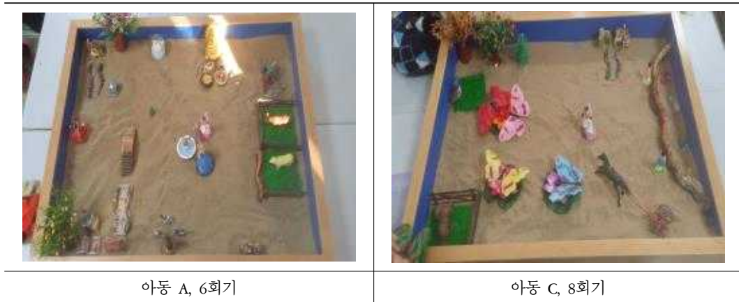
표 10. '에너지' 주제의 모래장면

인간이 활동하는 근원이 되는 힘으로 활동적이고 생명력이 넘치며 활기를 띠는 모래장면을 의미한다. 에너지를 통한 변화와 새로운 에너지의 등장도 이에 포함하였다. 이러한 주제가 모래장면에서는 변신시키는 마법사, 물이 나오는 분수, 화산 등으로 표현하였다.