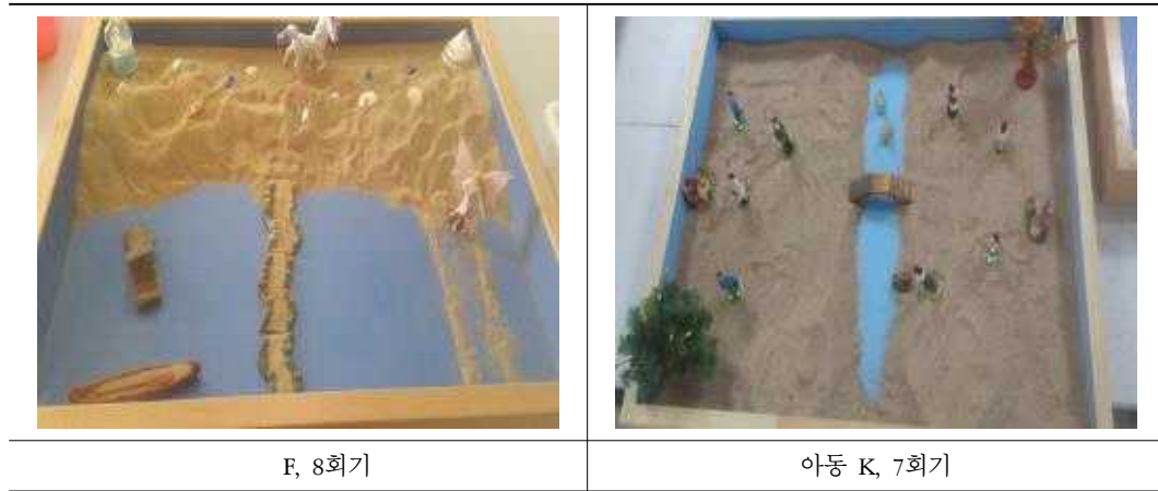
표 8. '연결' 주제의 모래장면

연결은 관계 혹은 아동 내면의 정신적 요소들의 결합을 의미한다. 양극단이 만날 때 나타나는 것은 인격의 핵인 자기의 중심이 건드려진 것이라고 할 수 있다. 자기 에너지는 대립되는 것들을 연결시키고 서로 다른 에너지를 통합시키는 힘이다. 아동 내면의 이러한 연결은 자기 자신이 다른 영역을 발견하고 받아들여 자기 자신 뿐만 아니라 타인을 이해하는 것에 있어 더 넓은 시선을 가질 수 있음을 의미한다. 타인에 대한 시선이 확장되면 아동은 일방적인 또래관계에 치우치지 않고 균형잡힌 또래관계를 맺을 수 있다. 또한 연결은 관계 시도의 의미일 수 있다.