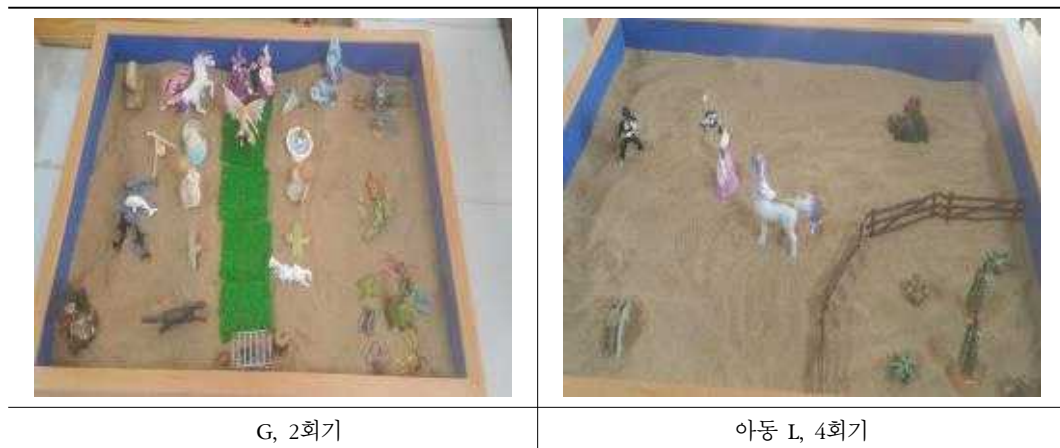
표 7. ‘장애와 방해’ 주제의 모래장면

장애와 방해는 새로운 성장과 발전의 가능성을 지연시키는 방해를 말한다. 조선족 아동들은 이를 모래장면에서 재판을 방해하는 마녀, 공주들이 모아놓은 보석을 빼앗으려는 마녀, 전쟁을 일으키는 나쁜 사람, 귀신의 집, 피라미드에 있는 보물을 빼앗으려는 괴물, 탐에 들어가려는 악당 등의 장면으로 표현하였다.