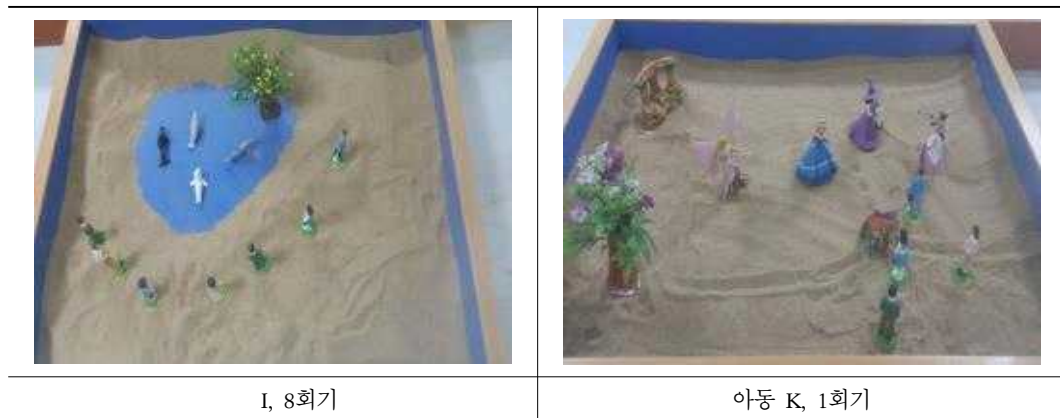
표 11. ‘통합과 적응’ 주제의 모래장면

‘엄마, 아빠가 바다에서 죽고 저 둘만 살았는데 둘은 자라서 한 명은 마법사가 되고 한명은 공주가 되었어요. 마법사가 마법으로 양동이에 음식이 나오게 해요.’ (아동 A, 7회기), ‘가족들이 이곳에서 살고 있어요. 아빠가 이곳에서 다 같이 살려고 집을 마련했어요.’ (아동 D, 7회기), ‘사람들이 모여서 물고기를 구경하고 있어요.’ (아동 I, 8회기), ‘가족이 호수가에 놀러와서 먹고 있어요.’ (아동 J, 7회기), ‘학교에 가고 있어요. 춤을 배울 수도 있고, 마법을 배울 수도 있어서 재미있을 것 같아요.’ (아동 K, 1회기), ‘바다가 있는.. 바다가 있는 집을 샀어요. 바다를 구경하는 사람들이구요.’ (아동 K, 8회기)