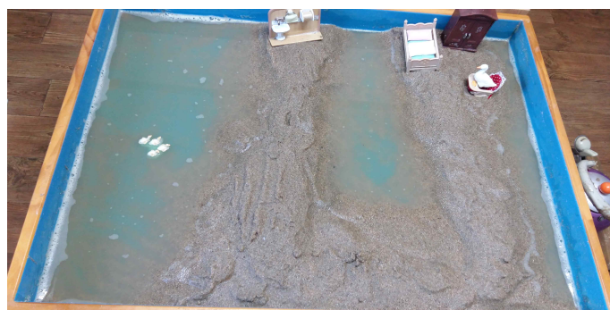
Sand picture #7

모래사진의 U자 모양은 이러한 양육의 컨테인을 의미 할 수 있으나 아직은 안전하게 보호된 상태는 아닌 것처럼 보인다. “물이 너무 많으면 양동으로 퍼내면 된다”는 아동의 표현에서 두 가지로 볼 수 있는데 한 가지는 모의 과잉된 억압의 상태로 볼 수 있으며 양동으로 퍼내는 것의 의미는 자신의 잃어버린 자율성을 찾는 것과 독립을 할 수 있다는 긍정성이 엿보인다. 모의 보고에 의하면 이때 아동은 혼자 잘 수 없었는데 자기 방을 따로 갖고 싶다고 하였다고 한다. 아동기는 학교에서 동성의 또래 관계 형성에 관심 갖게 되면서 자