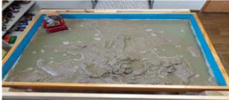
Sand picture #4