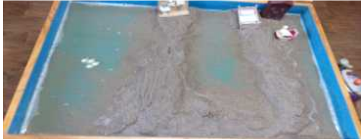
Sand picture #7