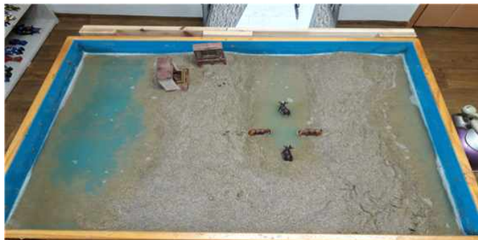
Sand picture #6

한참동안 말없이 모래를 짓이기던 아동은 위에서 아래로 U자 모양을 만든다. 그리고 다시 한 번 물을 붓는다. 아동은 치료자에게 송아지를 가리키며 “예네들이 집이 마음에 안 들어서 갯벌로 이사 갔어. 집에 먹을 것이 없어서 갯벌에서 먹을 것을 찾고 있어요.” 라고 말 하였다. 갯벌은 갯가, 즉 바닷가의 넓은 벌판이란 뜻이다. 이곳은 바닷가의 평편하고 물의 흐름이 완만한 곳에 물속의 흩알갱이들(퇴적물)이 내려앉아 만들어진다. 갯벌 안에서는 수많은 생명들이 쉼 새 없이 먹고 이동하며 치열한 삶을 꾸려가고 있다. 아동이 집에 먹을 것이 없어서 갯벌로 이사를 가는 행위는 먹을 것이 없는, 정서적으로 메마른 이곳을 떠나 자신에게 필요한 양분을 찾아 떠나는 아동의 독립성과 자아의 발달을 의미한다. 아동은 집이 마음에 들지 않아서 갯벌로 이사를 가는 능동적인 행동을 한다. 자신의 삶속의 필요를 적극적으로 찾아가는 이 모습은 모에게 억압되어 자신의 의사를 긍정적으로 말하지 못하고 짜증을 내던 것을 언어로 표현 할 수 있는 힘이 생긴 것이다. 모의 보고에 따르면 아동은 또래친구에게 “왜 나만 하라고 하는데!, 잘난 척 하지 마” 등의 말을 할 수 수 있었다고 한을 했다고 한다. 또한 잠잘 때 엄마를 떨어져서 자지 못했는데 친구 집에 가서도 잠을 자고 올 수 있었다고 한다. 4는 여성적 에너지, 여성의 수라고 볼 수 있는데 모래사진의 송아