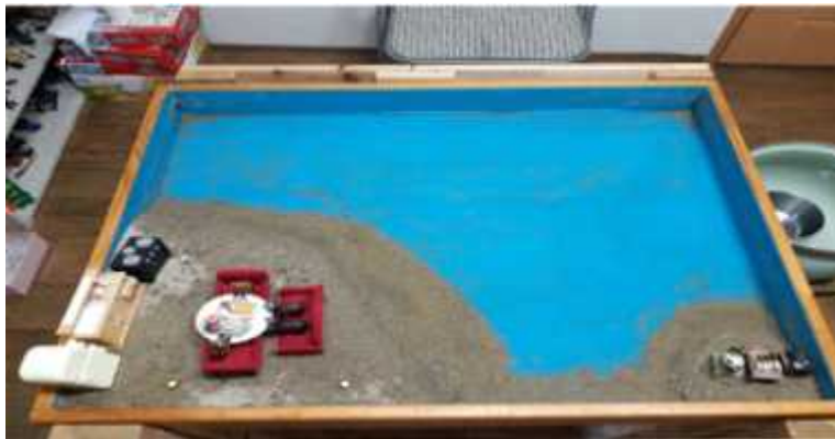
Sand picture #12

Expressions such as “rich,” “poor,” “friends whom I get along with,” and “friends whom I don’t get along with” may represent the manifestation of the opposites: the negative mother archetype and the positive mother archetype. These statements also show her ambiguous feelings towards the mother and the beginning of a psychological separation. That she sometimes gets along with her friends and sometimes doesn’t seem like a statement indicating that she has obtained insight about herself. When she is able to integrate those insights, she would learn how to express herself appropriately within interpersonal relationships. The oven is the symbol of transformation. The oven contains, and transformation occurs when the food contains inside is cooked. Just as food undergoes a transformation by being cooked in the oven, the client has to integrate the opposites: rich and poor, friends with whom she gets along and doesn’t, etc.