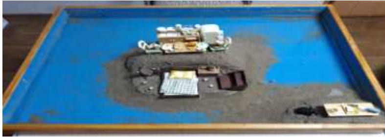
Sand picture #14