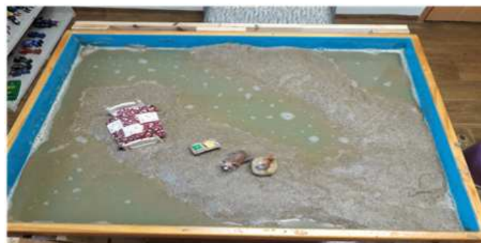
Sand picture #5

아동은 모래상자에 여러번 물을 쏟아 부었는데 물을 부을 때 아동은 조심하지 않고 붓는 모습이 통쾌해 보였다. 많은 양의 물은 홍수, 쓰나미, 진창속의 죽음을 표현한다. 이는 심리학적으로 모든 기능의 정지이며 하나의 세계를 해체하는 것으로, 근원지와 만남을 유도한다(박행자, 2012). 초기에 나타난 홍수는 모든 에너지가 잠재적으로 정체되어 있는 카오스 상태로 초기 외상(Trauma)을 경험한 아동들에게 많이 나타나는 심한 외상(Trauma)의 표현이