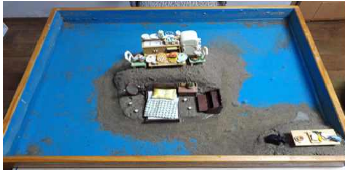
Sand picture #14