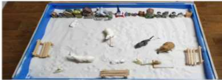
Sand picture #17

The four bears and sixteen houses in the last sand picture are strong symbols of the energy of integration. Number four symbolizes the four principal lunar phases, four seasons, and the four elements of the conscious. It also represents the four basic aspects experienced through the act of becoming conscious and a boundary where something new begins. The number sixteen is also associated with the number four, as four times four equals sixteen. It is a symbolism for the realization of a complete differentiation of the four aspects of the conscious (Abt, T, 2005/2007). We can expect the child to separate from the primal unity with the mother, develop a new ego-consciousness, and safely carry out the next development task. The symbols seem to say that the client has begun the journey of discovering her identity.