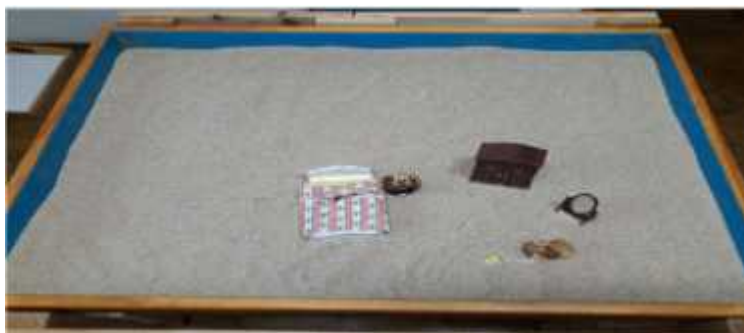
Sand picture #1

client is experiencing a conflict between regression and independence. In that regard, perhaps this particular sand picture represents the need for her to overcome her fear and break away from the regression. She needs to go inside the closet to embark on a journey to confront her fear. She seems to be in confusion between the state she is in now (regression) and the state that she ought to be in to find her genuine ego (independence).