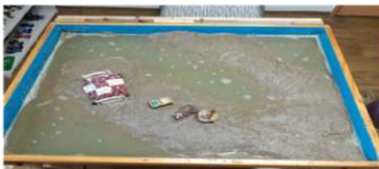
Sand picture #5

The client poured water into the sand tray several times. She was careless about pouring water in, which appeared gratifying. A significant amount of water represents flood, tsunami, death in the mire, etc. Psychologically, this indicates the suspension of all functions and a dismantlement of an entire world and also facilitates the meeting with its original source (박행자, 2012). Flood in the early phase of a sandplay process represents a state of chaos in which all energies remain stagnant. It is a sign of a severe trauma in case of children who experienced trauma in early years of life. Flood that appears in the middle phase of a sandplay process represents the meeting with the unconscious and serves as a prelude to a rebirth after death (Turner, 2005). Flood can also symbolize the eruption of inner emotions. There is the process of