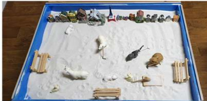
Sand picture #17