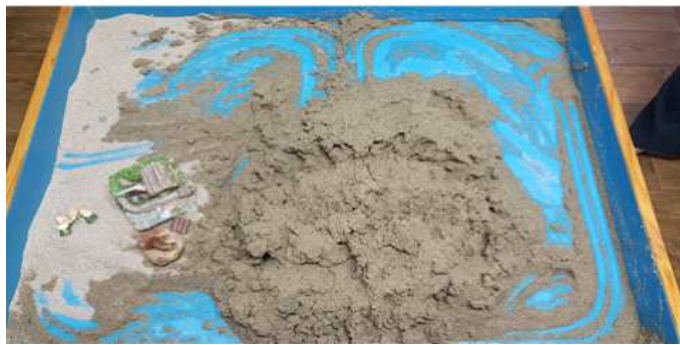
Sand picture #3

어둠과 여명의 상태로 주체와 객체의 구별이 불가능하며 하나의 동일한 것으로 융합된 카오스 상태라고 말했다. 물은 이러한 집단무의식처럼 한 주체로서 구별이 어려운 미분화상태로 여러 물질과 융합될 수 있는 가능성을 상징한다. Eliade(1952)도 물이 일체의 '존재 가능성의 원천'이며 '저장고'라고 말했다. 이와 같이 물과 카오스는 생명과 성장의 가능성을 보유하고 있지만 아직은 형태가 없는 혼돈된 상태이다. 물은 무의식을 상징한다(Cooper, 1978). 아동은 자신의 무의식으로 하강 하여 혼돈된 상태, 미분화된 상태의 자아를 모래놀이를 통해 돌아볼 준비를 한 것으로 보여진다.