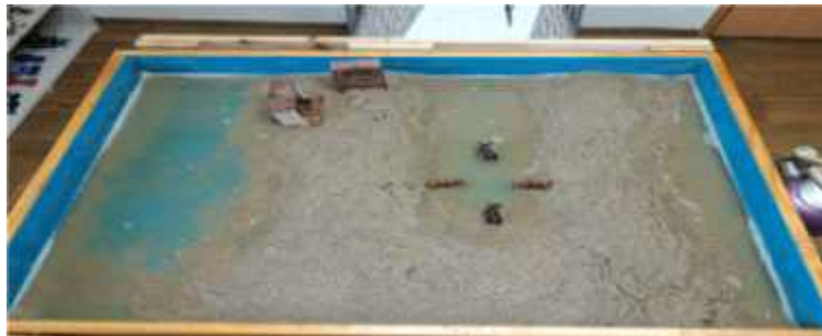
Sand picture #6

The client kneaded wet sand for a long time without saying a word and made an upside-down U-shaped structure with it. Then she poured water inside the tray once again. Pointing at the calves, the client said, "They didn't like their home so they moved to the mudflat. There's nothing to eat at home so they're looking for food in the mudflat." The mudflat is an expansive field of mud near the coast. Sediments in water become deposited in leveled areas where water is slow in current to form mudflats. So many creatures live fiercely inside the mudflat, ceaselessly moving around and finding food. Moving to the mudflat because there is nothing to eat at home signifies the client's moving away from an emotionally-barren home to a place that provides her with necessary nurturing. In other words, it represents her independence and ego development. The client took an active measure to move to the mudflat because she does not like home. Actively trying to satisfy the needs in her life is connected to the fact that she has now gained the energy to verbally express herself instead of simply becoming irritated at the situation. The mother reported that around this time the child could tell her peers things like, "Why're you only blaming me!" or "Don't show off." Moreover, she slept over at a friend's house without the mother. Number four is a feminine number, or the