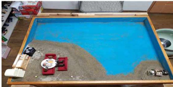
Sand picture #12

아동의 말에서 부자, 가난함, 맞는 친구, 안 맞는 친구 등의 표현은 부정적인 모성원형과 긍정적 모성원형의 대극적인 모습이 출현한 것으로 보여 진다. 이것은 모에 대한 양가감정과 모와의 심리적 분리가 되어 감을 보여준다고 볼 수 있다. 아동이 친구와 맞는 것도 있고 안 맞는 것도 있다는 말에서 아동은 자신을 통찰 한 것으로 보여 지며 이러한 것이 통합될 때 타인과의 관계 안에서 자신을 어떻게 표현해야 하는가를 알 수 있을 것 이라고 본다. 오븐은 변환의 상징이다. 오븐은 컨테인 할 수 있으며 그 안에서 음식을 익히는 과정의 변환이 일어난다. 이러한 오븐의 상징은 아동이 부자, 가난함, 맞는 친구, 안 맞는 친구 등의 대극적인 부분을 오븐 안에서 음식이 익어지며 변환되듯이 자신의 것으로 통합되어야 한다.