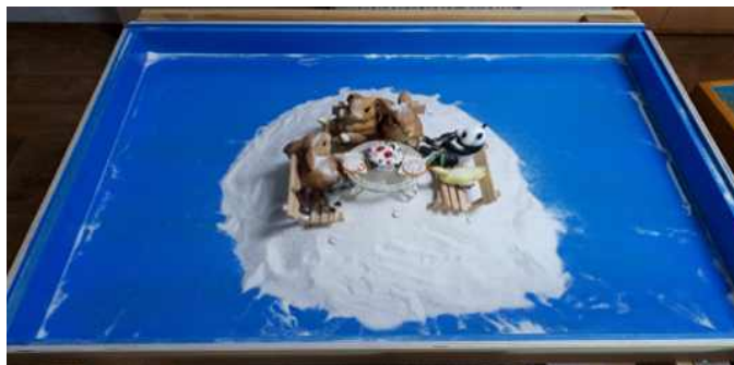
Sand picture #15

우리는 하늘과 땅을 연결 한다. 아동은 ego와 Self의 연결이 되어가는 모습으로 볼 수 있다. 생일 파티는 탄생을 축하하는 것이다. 친구와 함께 생일축하를 하는 장면은 또래관계 안에서 즐거운 경험을 하는 것으로 보이며 한편으로는 새로운 탄생을 의미하기도 한다. 아