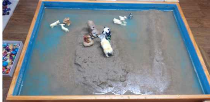
Sand picture #8