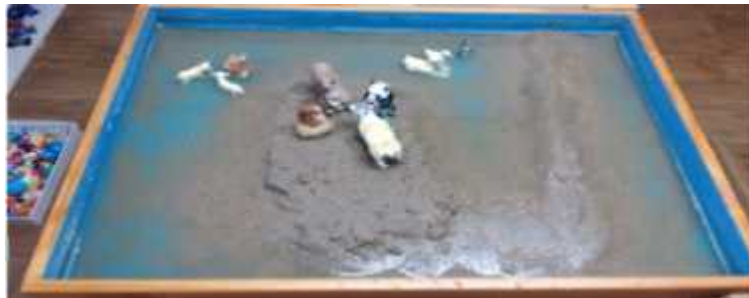
Sand picture #8

could represent the client's adaptation to her peer group. It signifies the beginning of her sociality, and perhaps we may be able to see her moving from the world of maternity to the world of paternity. Right after this session, the mother reported that the child told one of her friends not to show off. The mother was amazed to see the client expressing her emotions verbally. The U-shaped sand structure is now looking closer to a circle. This may imply that centralization is taking place in the client's inner world and be a prelude to her ego development.