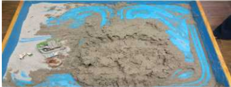
Sand picture #3