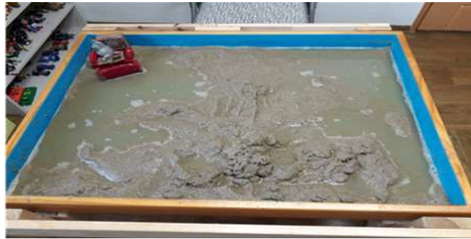
Sand picture #4

썩은 물, 끓어죽은 너구리 등은 아동의 무의식의 죽음을 상징적으로 말한 것 같다. 죽음 후 새로운 탄생이 있다. 노아시대 홍수로 최악으로 인해 혼돈된 세상이 멸망하고 새로운 세계가 만들어진 것처럼 아동의 내면세계에 죽어야 할 것들은 죽고 새로운 자신의 것을 스스로 만들어 나갈 것을 기대해본다(창7장17-24).