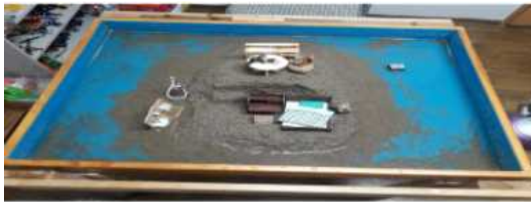
Sand picture #11

faucet and the shower head appear to indicate a process of purification. The flower represents energy at the center moving towards outside; though the flower in the box is not yet evident, it could represent the potential manifestation of the Self (David,1993). The stairs represent ascendance, transcendence, and a movement towards a new existential level. The stairs inside the circular formation is a representation of the development of consciousness, once again showing that the client's ego is developing and becoming conscious.