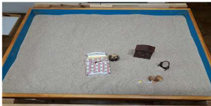
Sand picture #1

것이라고 말 한 것의 의미는 두 가지가 있는데 하나는 혼자 산다는 것은 심리적으로 고립되고 사회적으로 또래관계에서 고립되어 있고 굉장히 외롭다는 것을 의미 할 수 있고 또한 가지는 우리나라에서 토끼는 달나라 계수나무 아래서 방아를 찧는다. 이것은 아동이 무언가 도달해야 하고 성취해야 함을 의미 한다고 볼 수 있다. 또한 토끼는 아메리카 동부삼림지대의 인디언들 사이에서는 장난꾸러기(TRICKSTER)로 통한다(Cooper, 1978). 내담아동은 토끼와 같이 자유롭고 장난기 있는 놀이를 통해 퇴행의 욕구를 충족하고 싶어 하는 것으로 보여 진다. 토끼 발 앞에 줄로 연결되어 있는 작은 장난감 오리가 있다. 오리는 하늘과 땅, 정신과 육체를 연결 하는 연결의 상징인데 오리발에 끈이 달린 것으로 보아 연결이 더 강조된 것으로 보인다. 또한 아동은 내면의 어떤 에너지와 분열되어 있기 때문에 지금 무기력 한데 그 에너지와 다시 연결될 필요가 있는 것은 아닐까 하는 생각이 들기도 한다. 또, 한 가지는 어렸을 때 욕조에 넣고 놀이 하는 장난감 오리로 어린 시절의 퇴행을 의미 할 수도 있다. 그래서 장롱으로 들어가는 것은 성장 하고 독립하는 것을 의미 한다면 오리는 퇴행 하는 상태로 이 사이에서 갈등하는 상태는 아닐까 하는 생각이 든다. 또 한 가지는 자기의사를 뚜렷하게 분명하고 당당하게 표현해서 관철 하는 독립적인 태도보다는 울고 징징대고 짜증내고 수동적으로 자기를 표현 하는 퇴행을 의미 할 수도 있다. 퇴행과 독립 사이에서 아동은 갈등 하는 것은 아닐까? 그래서 이 모래상자는 바로 이 아동이 두려움을 극복하고 퇴행에서 벗어나서 그 장롱 안으로 들어가 두려움과 맞서야 하는 여정에 들어가야 하는 것은 아닐까 생각 된다. 아이상태로의 지금의 모습과 앞으로 나아가 진정한 자아를 찾아야 하는 퇴행과 독립의 혼돈된 상태로 보여 진다.