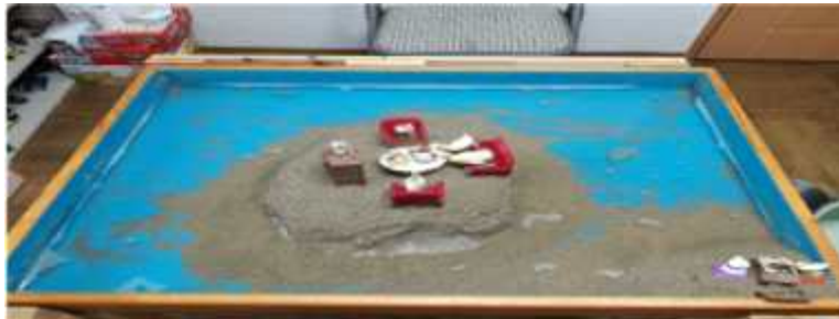
Sand picture #13

Cats represent the feminine mystery as well as the positive and creative aspects (Ackroyd, 1993). It also symbolizes patience, desire and freedom (Cooper, 1978). Food is a symbol of peace and resolution of discord as well as vitality and friendship (David, 1993). By restoring her feminine aspect, which was repressed by the mother, the client would be able to gain the strength to engage in good peer relationships and express her emotions in a positive manner.