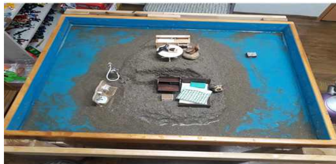
Sand picture #11

아직은 모래사진이 중심으로 집중된 완벽한 사분위의 만다라를 형성하고 있지는 않지만 머지않아 통합적 의식의 출현을 예고한다 하겠다. 부정적 모성원형을 극복하고 의식과 무의식을 분리를 통해 완전한 전체성을 가지는 것은 이상향이라고도 할 수 있다. 물의 출현과 혼합은 모의 어두운 그림자를 벗어나 자신의 무의식으로 하강을 두려워하지 않게 된 내담아동의 긍정적 발달에 에너지로 보여 진다. 또한 세면대와 샤워기의 출현으로 보아 자신을 씻기는 정화의 과정으로 보여진다. 꽃은 중심으로 바깥으로 움직여 나오는 에너지의 발현으로 상자안의 꽃은 아직은 드러나지 않지만 잠재된 Self의 출현으로 볼 수 있다(David, 1993). 계단은 상승, 초월, 새로운 존재론적 수준으로의 이행을 뜻한다. 원모양안의 계단은 의식성 발달의 형상으로 아동의 자아가 발달되며 의식화가 되어 감을 다시 한 번 보여준다.