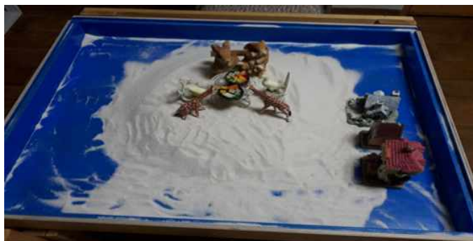
Sand picture #16

아동의 모래상자 중앙에 기린이 앉아 있다. 기린은 조망을 멀리 볼 수 있음을 상징한다 (Cooper, 1978). 그것은 어떤 상황을 객관적으로 볼 수 있는 인지력이 있음을 말한다. 내담자가 세상을 바라보는 조망이 생겼다는 것은 내담자의 정서적 변화와 발달을 의미한다. 목이 길거나 관이 높은 동물은 신성성 즉 영(spiriti) 또는 내면세계와 관계하는 상징을 지니고 있다. 모래상자를 꾸미고 내담아동은 자신이 느끼고 있는 가족에 대한 보고를 진솔하게 내어 놓기 시작하였다. 자기감정이나 특히 자신의 가족과 관련된 이야기나 느낌 보고에 회피적이고 비밀스럽던 내담아동의 사יק에 변화가 생긴 것으로 보여진다. 또한 또래 관계의 상