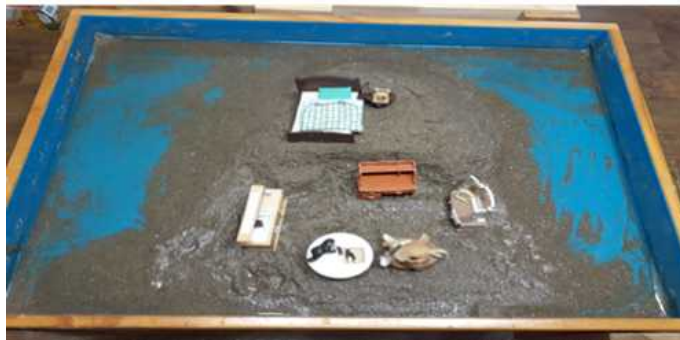
Sand picture #10

원숭이는 뻘뻘스러움, 몰염치, 호기심, 나쁜장난, 비천한 본능을 상징 한다(Cooper, 1978). 식탁위에 앉아 있는 원숭이, 그 옆의 화장대 거울에 비치는 원숭이는 아동의 무의식에 있는 본성을 바라보고 직면 해가는 과정일수 있음을 보여준다. 아동의 모는 아동이 요즘 친구에 대한 이야기를 엄마에게 하고 자신의 일을 조금씩 자발적으로 해 나가고 친구를 맞춰주며 자신을 조절 하는 것 같다고 보고 하였다. 모래놀이에서 중심화가 시작된 것으로 보여 지고 이러한 모의 보고는 아동의 자아 발달이 진행 되어 감을 의미 한다고 볼 수 있다. 원모양의 안쪽에 보여 지는 계단 모양은 아동의 내면의 의식화가 이루어지는 단계를 보여준다고 할 수 있다. 중심화가 된다는 것은 더 높은 차원을 향하고 의식적인 자각을 접근하도록 도와준다는 것이다(Turner, 2005). 아동의 자기배열이 되어가는 과정을 보여준다고 할 수 있다.