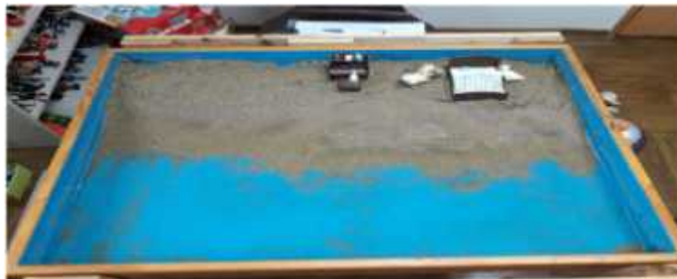
Sand picture #9

In sand tray the upper realm signifies sky, consciousness and masculine energy whereas the bottom realm represents unconsciousness, the underworld and feminine energy. The duck family in the client's sand picture is in the conscious realm. This could mean that only when children are provided with care within a stable family relationship in the conscious realm can they feel emotionally stable and achieve development (Turner, 2005).