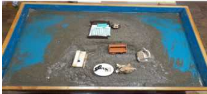
Sand picture #10

level and access conscious awareness (Turner, 2005) or, in other words, shows the process of Self constellation for the child.