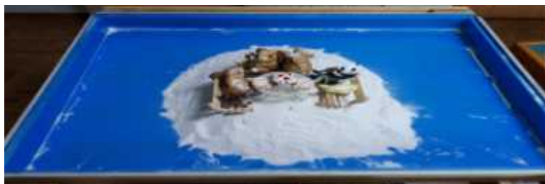
Sand picture #15

The duck connects sky and earth. For the child, this could indicate the connection between her ego and Self. Birthday parties are held to celebrate birth. A birthday party with friends allows joyful experience with peers. It also symbolizes a new birth. Therefore the birthday party