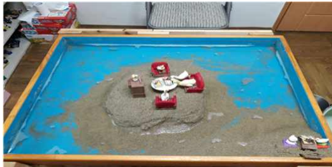
Sand picture #13

고양이는 여성적인 신비함을 간직하고 긍정적이고 창조적인 측면을 나타낸다(Ackroyd, 1993). 또한 인쇄, 욕망, 자유를 뜻한다(Cooper, 1978). 음식은 평화와 불화의 해소의 상징이며 생명력, 친교를 상징한다(David, 1993). 아동은 모로부터 억압된 여성성을 회복함으로 또래관계가 잘 이룰 수 있는 힘이 길러지고 자신의 감정을 긍정적으로 표현 할 수 있는 힘이 길러질 것으로 기대 된다.