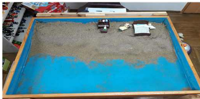
Sand picture #9

“아빠오리는 열심히 일 하고. 언니 오리는 공부해요. 엄마오리가 자는 것을 보고 있어요. 아기오리는 침대에서 자요.” 언니 오리는 공부를 열심히 하는데 자기 자신은 공부 하는 것이 어렵고 힘들다고 말 하였다. 공부하는 오리의 모습이 자신과 같이 느껴진 것 같다. 아동이 어려워하는 과목은 수학과 과학인데 5학년 올라와서 너무 어려워서 따라가기 힘들다고 하였다. 아기오리가 잠자는 모습을 어미오리가 지켜보고 아빠오리도 침대 옆에서 일하는 모습, 그 옆에 공부하는 언니오리의 모습에서 아동은 부모의 충분한 돌봄을 경험하기를 원 하는 것으로 보여 진다. 위의 젖은 모래와 아래의 파란 바닥이 드러나 보이는 것은 물과 땅이 위 아래로 나뉜 것이기도 하며 이것은 아동의 모와의 단일 체 에서 분리 개별화가 일어나고 있음을 의미 할 수도 있다. 여전히 아래 바닥에는 물이 차 있지만 물의 양이 줄어들었음을 볼 수 있다. 모래놀이치료에서 물은 모래를 침식시키고 진창이 되게 하며 경계를 없앤다(Barbara, 2005). 모래상자에서 적절한 양의 물이 사용되는 경우, 물은 재탄생으로 생명수, 우물, 식수, 강, 바다 그리고 세례 등으로 표현된다. 아동은 이제 점진적으로 자아가 자기의 영역으로 움직일 준비가 되어 있음을 보여 주는 것으로 보여진다.