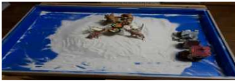
Sand picture #16

communication with the outer world—the domain of the ego—through sandplay. The mother's overly caring and repressive attitude disrupted the client's growth. However, now the client has developed a sense of awareness through which she can see herself objectively, just like the giraffe. But the house on the right implies that the client still needs nurturing and nourishment.