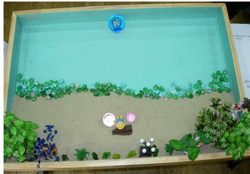
Fig. 4. Client Sand picture from session 4

마지막 상자를 꾸미며 내담자는 모래상자의 상단의 모래를 모두 하단으로 끌어내렸다. 그리고 이곳은 잔잔한 바다라고 했다. 바다 중앙에는 유리구슬을 놓았고 모래 상자 중앙에는 여행을 떠나기 위해 준비하는 여자아이 피겨를 놓았다. 그리고 그 옆에 핑크빛의 유리구슬 두 개를 놓았다. 내담자는 “이제 여기는 더 이상 차갑고, 어둡지 않고 마음이 편안해지는 곳이에요”라고 이야기를 했다.