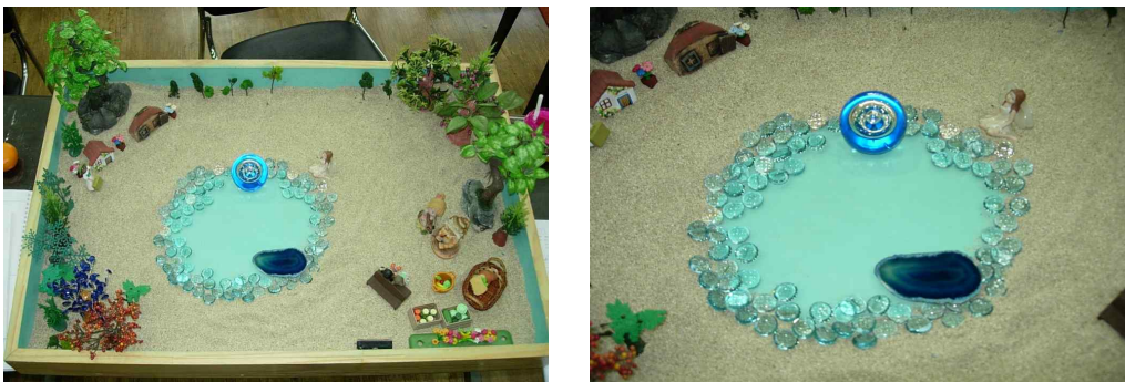
Fig. 2. Client's sand picture from session 2

The client's sandbox contained swans and beads made of glass. A swan symbolizes dignity and achievement. Swans have to ceaselessly move their feet underwater to keep their graceful figure above the water. A graceful posture can only be maintained through such continuous effort. In the client's sandbox, the glass swans were also constantly moving their feet under the cold water to maintain a graceful and beautiful appearance that would catch the angels' attention. It symbolized the relationship between the client and her mother.