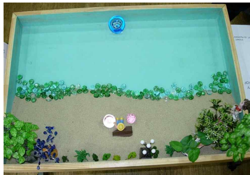
Fig. 4. Client's sand picture from session 4

The colors of the glass marbles that appeared in the third sandbox were now warm and bright. Although the glass marble filled with gold glitter in the middle of the pond was not yet in touch with the figure of the girl ready to leave on a trip with her travel bag, the light-pink glass marble was in contact.