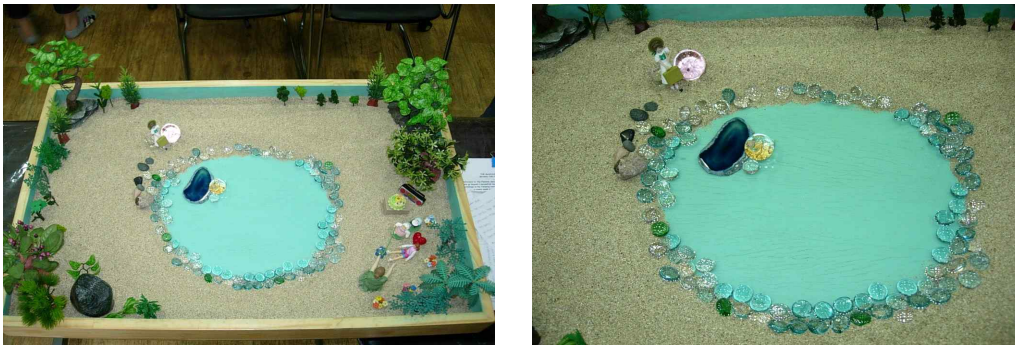
Fig. 3. Client Sand picture from session 3

세 번째 모래상자의 중앙에는 조금 더 커진 연못이 만들어졌다. 연못 안에는 금가루가 가득 든 유리구슬과 자수정 판이 놓였다. 연못 주변은 유리알들로 둘러싸여 있었고 연못의 왼쪽 위에는 여행 가방을 들고 있는 소녀피겨를 놓았다. 소녀피겨 옆에는 연분홍 유리구슬을 놓았다. 모래상자의 오른쪽 아래에는 엄마와 놀고 있는 아이의 피겨, 그리고 음식들이 놓였다.