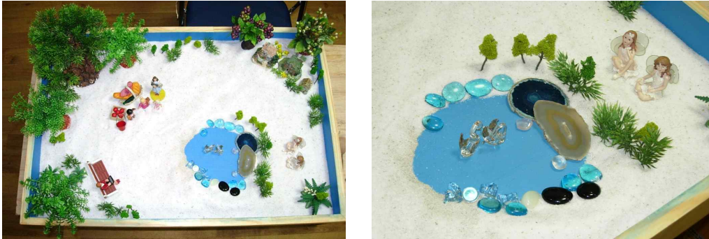
Fig. 1. Client's sand picture from session 1

the symbolism of the glass that emerged during sandplay therapy of a female client in her late forties.