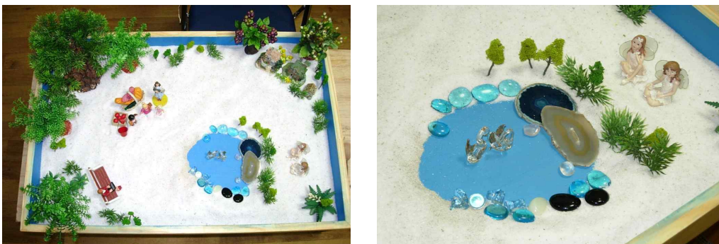
Fig. 1. Client Sand picture from session 1

그녀는 첫 세션에서 모래상자의 오른쪽 아래쪽에 연못을 만들었고, 연못 속에 유리로 된 두 마리의 백조를 놓았다. 연못 가장자리에는 유리알을 놓았고 “수정같이 차가운 물이에요”라는 말과 함께 자수정 판을 두 장 올려놓았다. 그리고 연못 앞에는 두 명의 천사를 놓았다. 내담자는 아래쪽에 놓인 천사가 차갑고 표정이 없어 보인다고 했다. 모래상자의 왼쪽 위에는 음식과 아이들, 그리고 오즈의 마법사의 도로시 피겨를 놓았다. 그리고 왼쪽 아래쪽에는 벤치에 앉아 컴퓨터로 일을 하는 여자피겨를 놓았다.