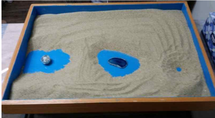
Figure 7. Separating

and divorcing. Psychologically, it would represent the process of ego separation from the state of being in an excessive identification with parents, people, group values, complexes, etc. (Jang, 2017).