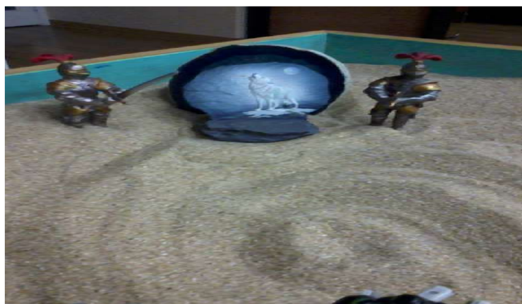
Figure 3. Rock with Wolf Howling and Two Guards

“이 늑대는 자신의 슬픔과 억울함을 신께 기도드리며 울부짖는 것 같아요. 저는 아들로 태어나지 못해서 억울했어요. 자신의 소중한 것을 지키기 위한 몸부림인 것 같아요.”