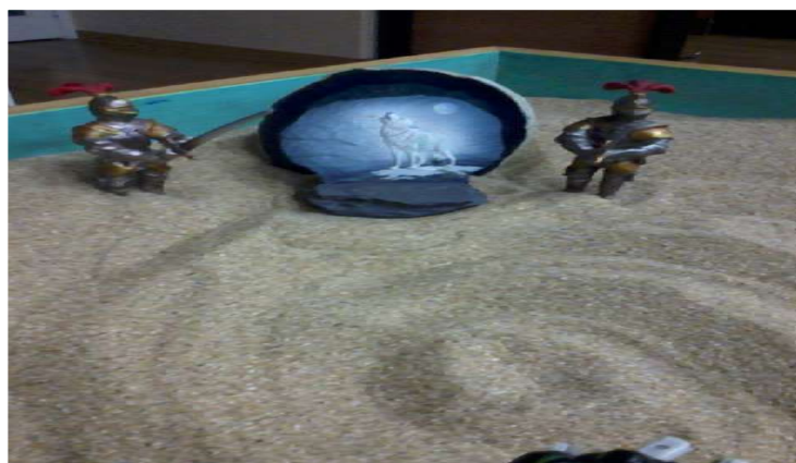
Figure 3. Rock with Wolf Howling and Two Guards

In this stage, the old ego patterns, i.e., old circumstances and elements, are eliminated. Old attitudes are washed away and purified, leaving only the valuable attitudes and actions. In sandplay, this stage would be represented through washing, wiping, taking a bath, or peeing; figures that express anguish and grief would be used; symbolisms related to easing of hardened emotions and crying would appear (Jang, 2017).