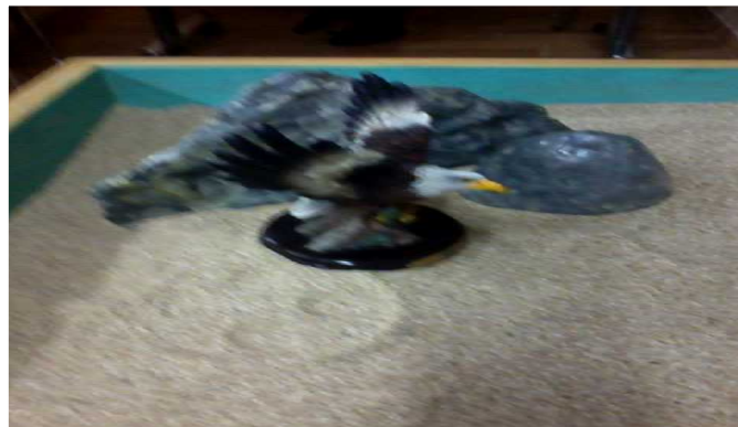
Figure 5. An eagle in front of a rock

Sublimation ( sublimatio , uplifting/inflating) is the process in which matter transforms into vapor through distillation. In sandplay, that would be represented through flying, ascendance, stairs, ladder, airplane, bird, wind, breathing, etc.