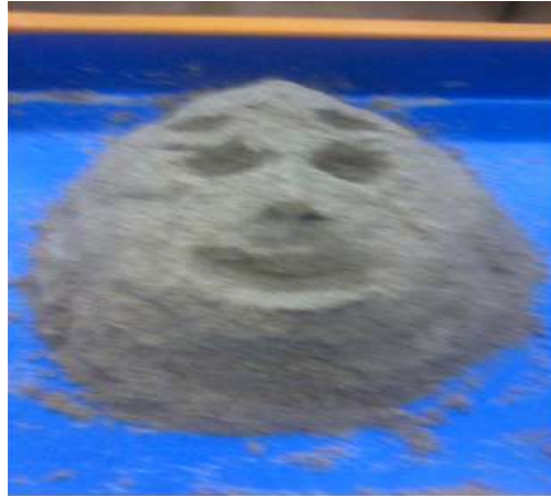
Figure 4. A large rock face

내담자는 자신이 진정으로 원하는 모습에 대한 바람을 물과 모래를 섞어서 다음과 같이 표출하고 있다.