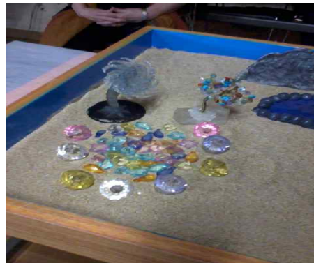
Figure 2c. Jewels in the Unconscious

Rocks in sandplay generally symbolize stiffness, coldness, and hardness (Cooper, 1978/1994). The client's rock expresses frustrations due to unresolved inner problems and the ego's desire to progress further and the contrasting reality. It is an emotional expression of the dissonance between the client's desire for change and the reality.