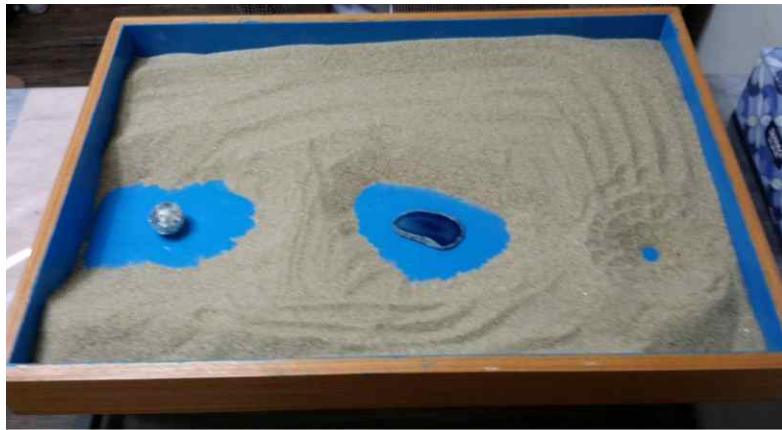
Figure 7. Separating

있다. 이것의 심리적 의미는 부모를 비롯한 사람, 집단의 가치, 콤플렉스 등과의 과잉 동일 시로부터 자아가 분리되는 과정을 의미한다(장미경, 2017).