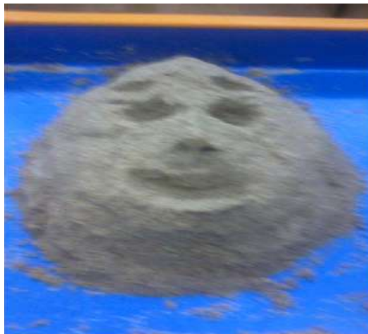
Figure 4. A large rock face

In general, the use of water in the sandplay therapy process indicates the ego intention to