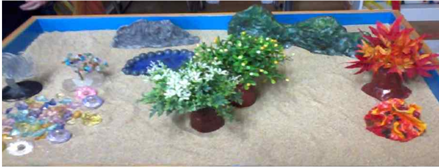
Figure 2a. First picture of sand play