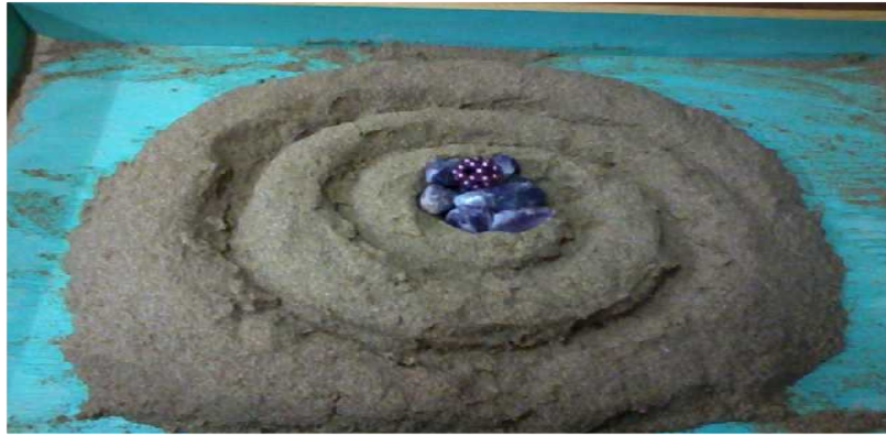
Figure 8. Amethyst Jewel and The emergence of creation and birth Self

The client represented her awareness of the new Self, its energy, and the growth of a new “I” with jewels and pearls.