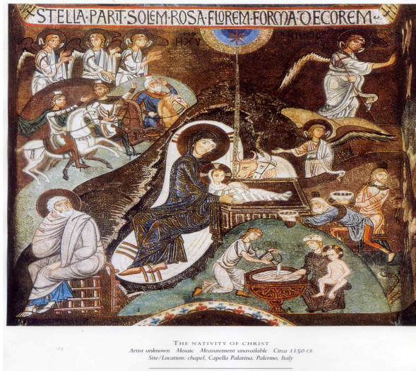
Figure 1. Nativity Scene

성자를 안고 있는 성모 마리아의 초상화(Figure 1)는 성스러운 것과 직결되는데, 그림에서 성모 주변에 동굴, 석주, 바위가 나타난다. 예루살렘에 있는 신전의 바위는 위대한 모신을 나타내는 상징이다(Neumann, 1974).