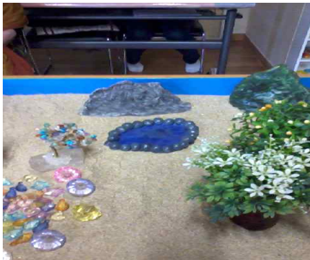
Figure 2b. Unpleasant rock