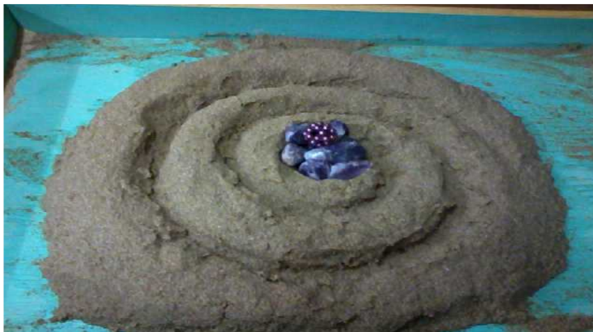
Figure 8. Amethyst Jewel and The emergence of creation and birth Self

모래상자에서 적절한 양의 물이 사용되었는데 물은 재탄생으로 생명수, 우물, 식수, 강, 바다 그리고 세례 등으로 표현된다. 이는 내담자가 미지의 것으로 나아가는 자아의 의도적인 행동으로 양분된 자아(ego)가 자기(Self)의 영역으로 통합되어 한 방향으로 움직이는 것으로 볼 수 있다(Turner, 2005/2009).