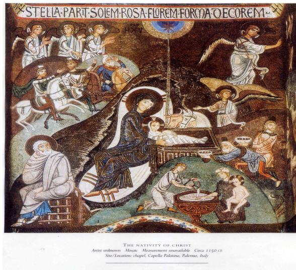
Figure 1. Nativity Scene

Jung called the rock, a representation of the mother archetype which is the symbol of creation and birth, a pregnant mother symbolizing the unconscious (Jung, 1964/13). Sometimes rocks appear in the form of caves, which symbolize the womb that contains the meaning of a shelter. The womb is linked to birth and resurrection, and is connected to the center of the