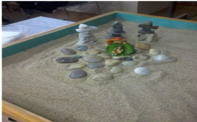
Figure 6. Krishna on a rock backed by cut stone towers

Putrefaction ( mortification , killing/dying) in alchemy stand for death or annihilation of a substance. It can be expressed as dead bodies, graves, coffins, shooting, stabbing, killing, burying, and excrement such as feces in sandplay therapy. The psychological meaning of such emotional state is that the ego or the ego complex is killed so as to be transformed by the Self. On the negative side, it may also symbolize repression or inhibition (Jang, 2017).