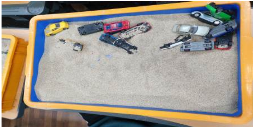
Fig 2. Sandpicture created by Child D in Session 2

Some cars have flipped over, some are on their sides, and some are on top of one another. They are placed in an irregular and disorderly manner in the sandpicture. The cars take up only one side of the sandpicture, leaving the other side empty. A few cars are buried under the sand.