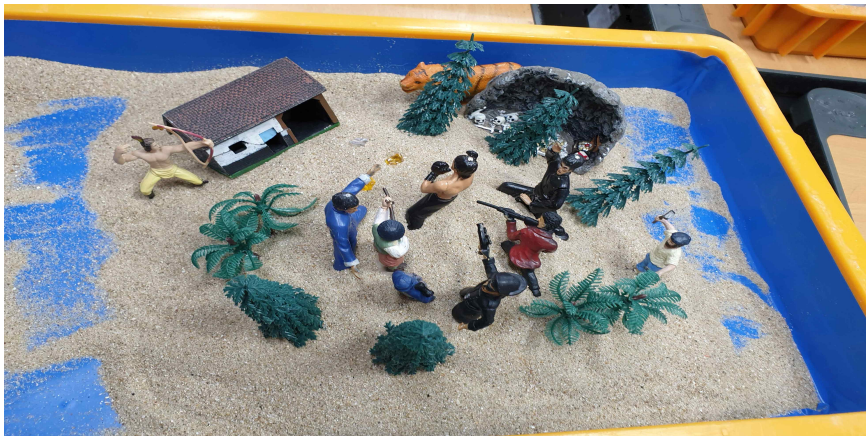
그림 4. 아동E 4회기 모래장면

모래상자의 모래를 중앙으로 모아서 가운데는 모래가 많고 주변은 상자의 바닥이 보인다. 총을 든 사람, 활을 쏘는 사람, 도끼를 든 사람, 글러브를 낀 사람이 한쪽 방향을 향하여 겨누고 있다. 사람들 주위로는 벽이 갈라져 있는 집과 나무들이 있다. 나무 뒤로는 해골과 뼈가 놓여 있으며 그 뒤에는 호랑이가 나무 뒤에 숨어있다.