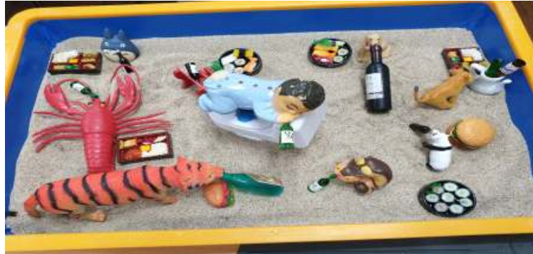
Fig 1. Sandpicture created by Child I in Session 1

the baby. This is what the baby is wearing. The baby is drinking on the toilet because he wanted to poop but found soju there. Although not seen here, there is a reporter in the corner. The reporter takes pictures and shares them on Instagram. They become insiders on social media. Here, they are depressed, but they strive to become insiders.”