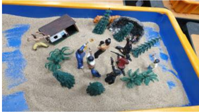
Fig 4. Sandpicture created by Child E in Session 4