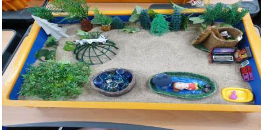
Fig 3. Sandpicture created by Child C in Session 2