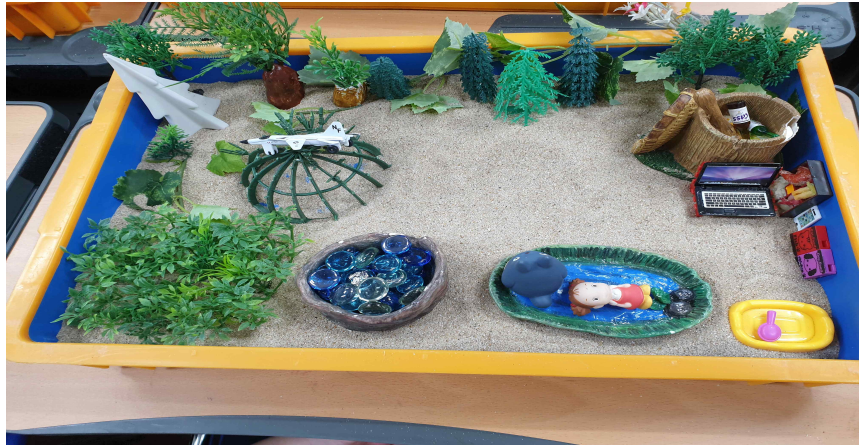
그림 3. 아동C 2회기 모래장면

성인이다. 애는 소지품을 다 가져왔다. ... 조용할 거 같다. 아무도 없는 거 같아서 좋다. 가족이 간섭해서 가출했다. ... 애가 불쌍해 보인다.”