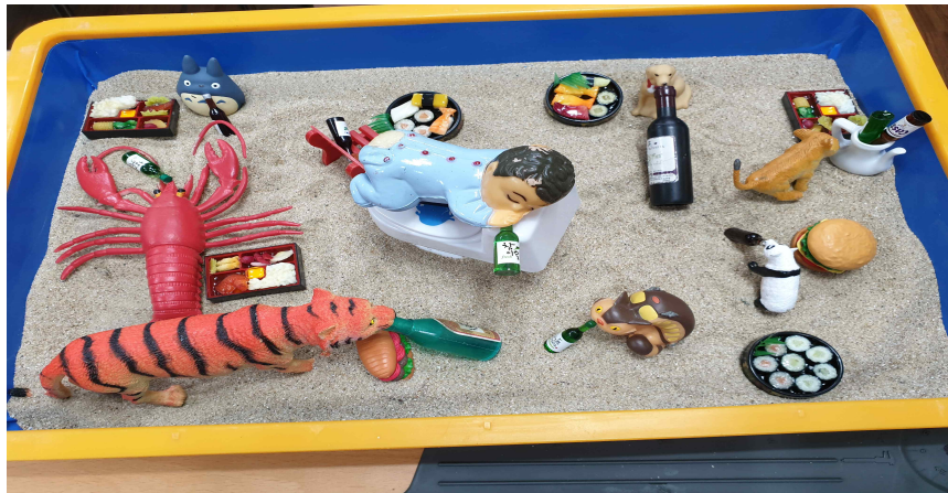
그림 1. 아동 1회기 모래장면

또한 아기의 좌측에는 다른 동물에 비해 커다란 크기의 붉은색 가재와 호랑이가 술을 먹고 있다.