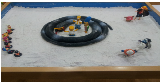
Fig. 7. Child E's sandpicture from session 1

The constellation of the Self in Child E's In the first sandpicture, the child appears to be surrendering to his parents. And in session 10, a round mound appeared at the tray's center. The mound was a snow-covered volcano that erupted at first but later became an igloo in which three penguins lived. The child kept putting the penguins in and out of the igloo.