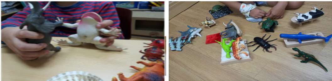
그림 1. 아동 A 1회기 모래장면과 10회기 모래장면

아동은 “대왕 개구리”가 “호랑이”를 물거나 “대왕개구리”가 “사슴벌레”를 잡아먹는 첫 모래상자를 꾸몄다. 나쁜 부분이 선한 부분을 삼켜버리려는 모습으로 드러나 있다. 집어삼켜 죽음을 가져오는 삼키는 어머니상은 부정적 모성원형을 나타낸다(Ammann, 2009).