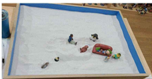
Fig. 13. Child H's sandpicture from session 1

archetypal images in both children's sandpictures can be interpreted as a healthy father archetypal image constellated through the relationship with their fathers in early childhood and also through the re-enactment of forming a relationship with the therapist. This represents growth towards a health development process, in which the child in early adolescent phase overcomes his dependence on the mother and shifts to the patriarchal world so as to develop "masculine consciousness" (Jang, 2017).