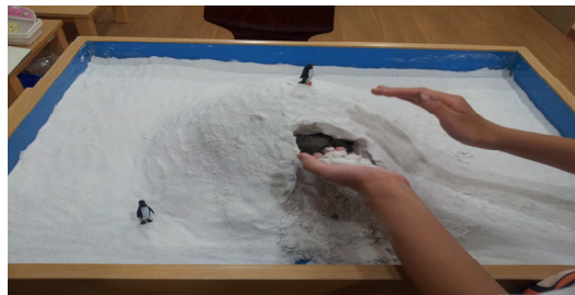
Fig. 8. Child E's sandpicture from session 10