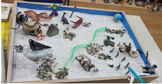
그림 9. 아동 F의 1회기 모래장면