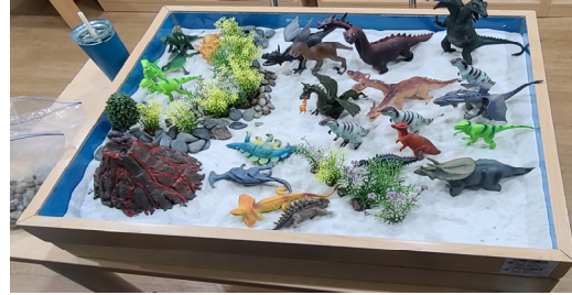
그림 10. 아동 F의 9회기 모래장면

삶의 건강한 흐름으로 나아가기 위한 아동의 힘과 투쟁이 분노의 거센 표출과 같은 정점으로 치닫는 놀이로 재현되어 나타난 것이다. 삶의 건강한 흐름으로 나아가기 위해 반드시 치러야 하는 상처와 고착(Neumann, 1973)을 견디기 위해 치료사가 지지하는 가운데 아동은 모래상자에서 이를 표현하며 애쓰는 모습을 보였다.