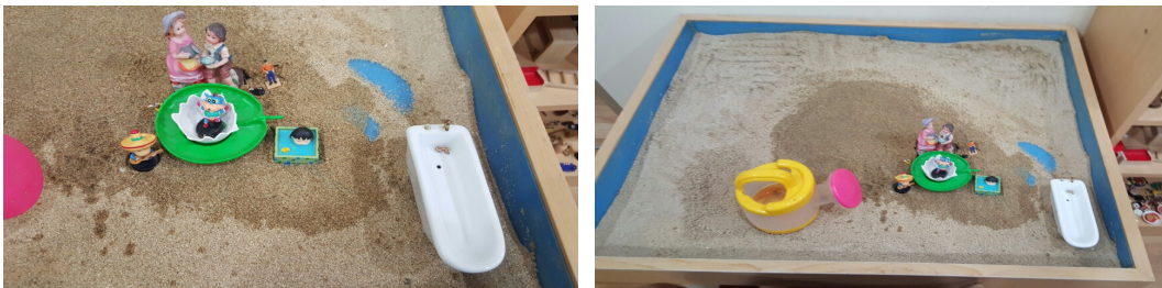
그림 6. 아동 D의 9회기 모래장면