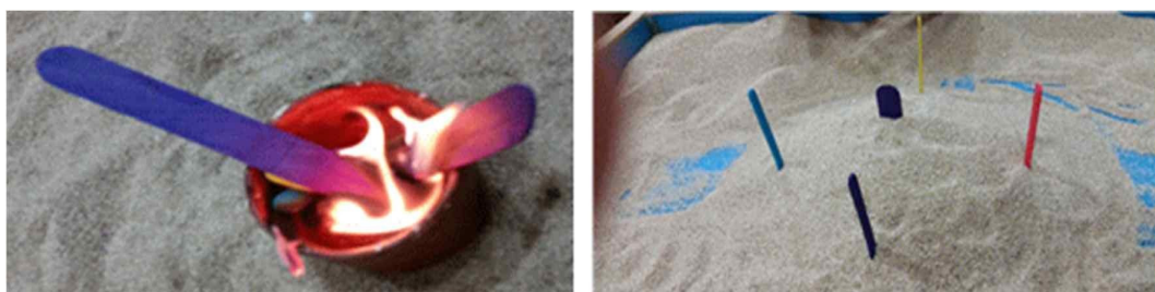
Fig. 4. Child C's sandpicture from session 6

This is a representation of an empty uroborous. The man and the girl may symbolize her separation from her father.