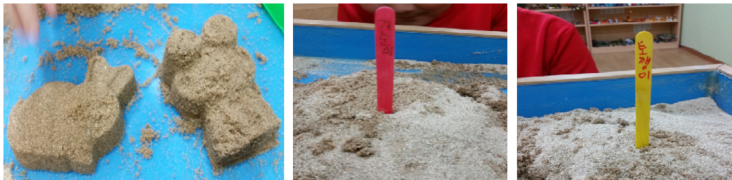
그림 3. 아동 C의 1회기 모래장면

이후 아동은 빨간 화로 안에 하드스틱을 넣고 활활 태웠다. 이는 아직 자신에게 알려지지 않은 일종의 심적 죽음을 맞이하는 장면이다. 빨간 화로에서 불로 태운 이후 빨간 화로만 남은 상태에서 그것을 무덤처럼 덮은 후 다시 꺼내는 작업은 심리적 죽음 후에 빨강계