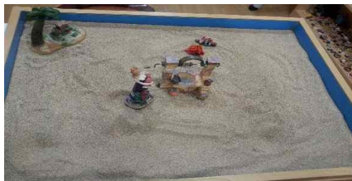
Fig. 12. Child G's sandpicture from session 10

exists a means to access something deep down (Turner, 2009). Drawing water from the well is symbolic, like fishing; it brings what is in the deep unconscious up to the brighter world (Kalff, 2010). Child G expressed his repressed emotions in the unconscious at the beginning of sandplay. But he managed to gradually overcome them and achieved growth in terms of becoming adapted to the collective through positive and conscious effort (Kalff, 2010).