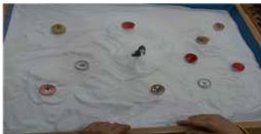
Fig. 11. Child G's sandpicture from session 1