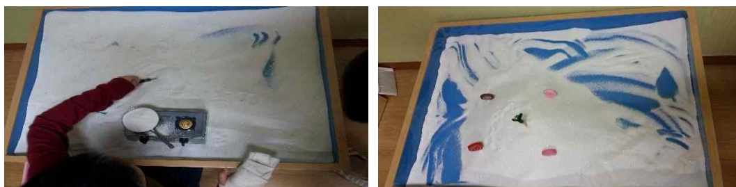
Fig. 2. Child B's sandpictures from session 1 and session 7

mother archetype, awakened the sleeping dinosaur to get ready to bring things to consciousness, and brought the deep aspects of the unconscious to the brighter world by carrying it out of the water. Child A also exhibited changes in the outer world, being able to gradually control his impulses both at school and home. At first, Child A hesitated to touch sand, which reminded him of his very first memory associated with touching, and found it difficult to relax in front of the therapist. But he eventually began to feel secure in the therapy room and achieved healthy psychological development based on that feeling of security and familiarity along with his inner power and energy. Overall, his sandplay process showed a huge transformation in which the negative mother archetypal energy changed into one that is nurturing.