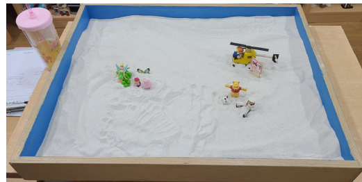
그림 14. 아동 H의 9회기 모래장면

이들 아동의 모래놀이에서의 변화는 부성원형이 질서를 잡으려 하고, 양육과 삶의 질을 높여주는 에너지로 등장하는 것으로 나타났다. 아동의 외부에서는 외현적 반항행동이 조절되기 시작했고, 우울·불안의 내재적 정서문제에서 조금씩 벗어나는 변화되는 모습을 보였다.