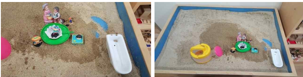
Fig. 6. Child D's sandpicture from session 9