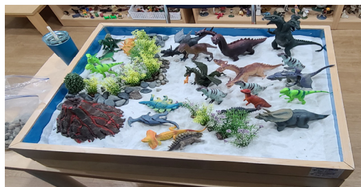
Fig. 10. Child F's sandpicture from session 9