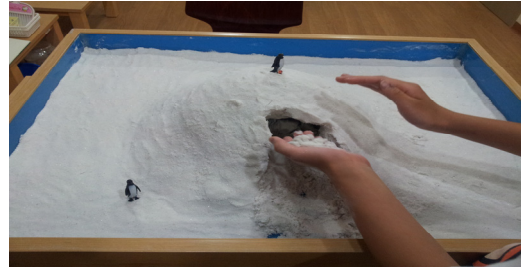
그림 8. 아동 E의 10회기 모래장면

초기 상실과 외상으로 자기의 구성을 손상당하면 모래놀이에서 자기를 중심에 두는 것으로 삶의 질서와 의미를 회복하려는 시도를 나타낸다(Turner, 2009).