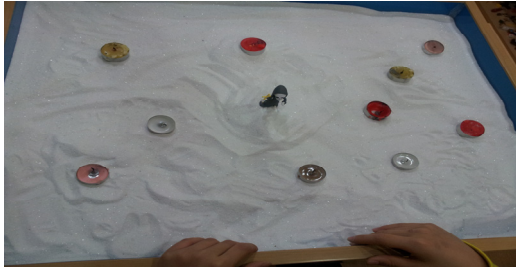
그림 11. 아동 G의 1회기 모래장면