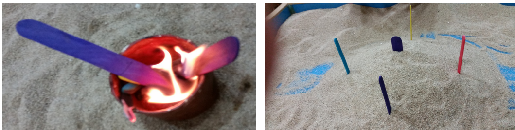
그림 4. 아동 C의 6회기 모래장면