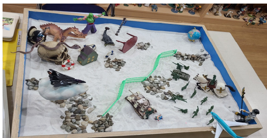
Fig. 9. Child F's sandpicture from session 1

In sandplay, a healthy ego separated from the mother must grow into one that identifies