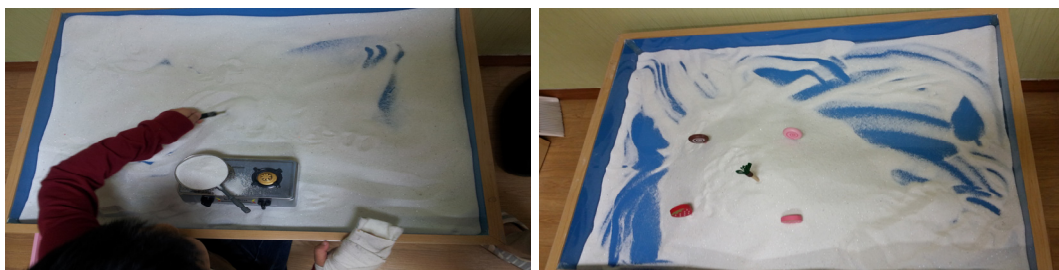
그림 2. 아동 B 1회기 모래장면과 7회기 모래장면

이후 아동 B는 치료사와의 관계형성에서 좀 더 안정된 모습으로 편안해졌으며, 초기의 산만하던 모습에서 주의집중력이 나아지는 등 두 아동 모두 문제행동이 조금씩 완화되었다.