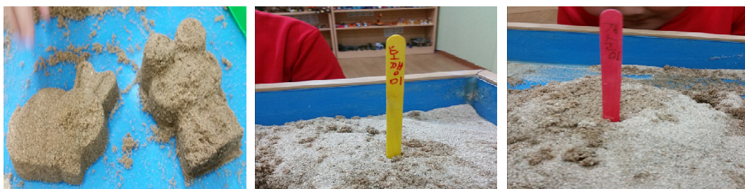
Fig. 3. Child C's sandpictures from session 1