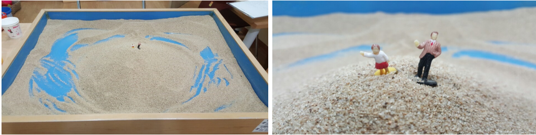
그림 5. 아동 D의 1회기 모래장면