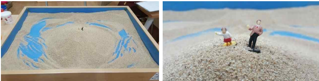
Fig. 5. Child D's sandpicture from session 1

Child D formed a closer relationship with the therapist and her overt actions were reduced. She became brighter and also showed growth in terms of her positive aspects.