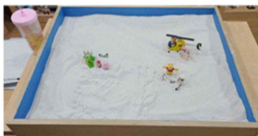
Fig. 14. Child H's sandpicture from session 9

In Child G's and H's sandplay processes, the father archetype appeared as the energy that brings order and enhances the quality of nurture and life. In the outer world, they began to show less overt disobedience and gradually overcame emotional problems such as depression and anxiety.