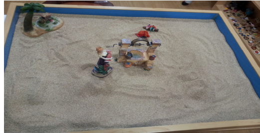
그림 12. 아동 G의 10회기 모래장면

10회기의 모래상자에서 아동은 우물에서 물을 떠야 살 수 있는 마을에서 사람들이 살아가는 내용으로 “적응”으로 나아가는 변화를 맞이한다. 우물은 아래에 있는 것을 이용하고자 하는 의도와 더욱 깊은 곳에 있는 것에 접근하기 위한 수단이 존재한다는 것을 나타내는 상징이다(Turner, 2009). 또한 우물에서 물을 길어오는 작업은 물고기를 낚는 것과 같이 상징적인 행동으로, 무의식 속 깊은 내용을 밝은 세상으로 불러내는 행위이다(Kalff, 2010).