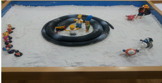
그림 7. 아동 E의 1회기 모래장면