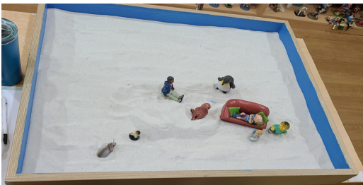
그림 13. 아동 H의 1회기 모래장면

모래상자에서 출현한 아버지 역시 어머니만큼 강한 ‘부모정신’으로 어머니를 대신할 수 있다. 부성원형적 이미지가 두 아동의 모래장면에 동일하게 나타나는 것은 어린 시절 아버지와 관계를 통해 배열된 그리고 치료사와의 관계맺음의 재경험을 통해 배열된 건강한 부성원형적 이미지로 이해할 수 있으며, 청소년 초기 아동의 모권에 대한 의존이 극복되고, 부권적 세계로 이동하는 ‘남성적 의식성’의 발달이 드러나는 건강한 발달 과정의 지속을 볼 수 있다(장미경, 2017).