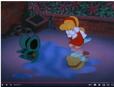
그림 9. 눈사람이 녹아서 물이 된 장면

곡하고, Walter 'Jack' Rollins이 작사한 동명의 노래 Frosty the Snowman이 원안이 되었다(Daily Herald, 2019). 「Frosty the Snowman」은 약 25분가량의 애니메이션(2018)으로, 눈사람 프로스트와 소녀 카렌은 눈사람이 녹지 않도록 함께 북극을 찾아 떠나게 된다. 눈사람이 녹지 않도록 냉장용 기차 칸(refrigerated boxcar)에 함께 올라타는데, 카렌은 결국 심한 감기에 걸리게 된다. 그런 카렌을 위해 온실에 들어간 눈사람은 마법사의 꾀에 의해 온실에서 녹아버리게 된다.