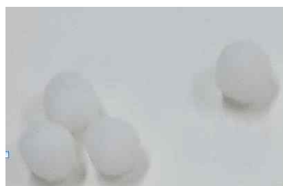
Figure 5. Expression tool selected first

[Figure 4] shows spheres remade into snowman after being used as a picture of self-representation, which were in a way the figure of a family expressed at the level of life experience while being the figures of many inner sides of oneself at the same time. Both the planar snowman expressed on the drawing paper and the three-dimensional snowman are the figures of many inner sides of the Self, and can be understood as various archetypes - animus, shadow, persona, etc. - meant by Jung. The snowballs in [Figure 5] were understood as a tool symbolizing pure white snow that had not yet been used. On looking at [Figure 4], it can be seen that the snow falling from the sky is white on the center, and both the color purple representing the ground and yellow used for snowman were also expressed. The meaning involved in the foregoing is that although all snow looks pure white, it expresses conflicting feelings such as pain, conflicts, hope, growth, and happiness that are invisible to people's eyes, and contains the wish that all life experiences that might be opposite to each other will be integrated into one and expressed as a snowman.