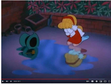
Figure 9. The scene where the snowman melted into water

together to prevent the snowman from melting. They ride together in a refrigerated boxcar to prevent the snowman from melting, but Karen becomes to catch a bad cold. The snowman who entered the greenhouse for Karen as such becomes to melted in the greenhouse due to the magician's enticement.