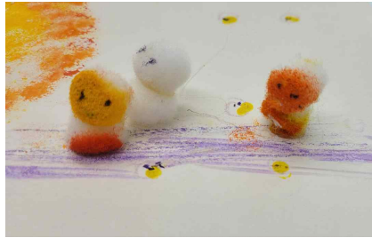
그림 4. 스펀지볼 눈사람

에 보이지 않는 고통, 갈등, 희망, 성장, 행복 등의 상충하는 감정들을 표현한 것으로, 서로 상반될 수 있는 모든 삶의 경험들이 하나로 통합되어 눈사람으로 표현되길 바라는 마음을 담고 있다.