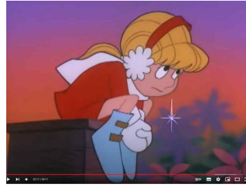
Figure 10. The scene where Karen is shedding tears