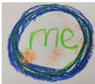
Figure 2. me, the space of return