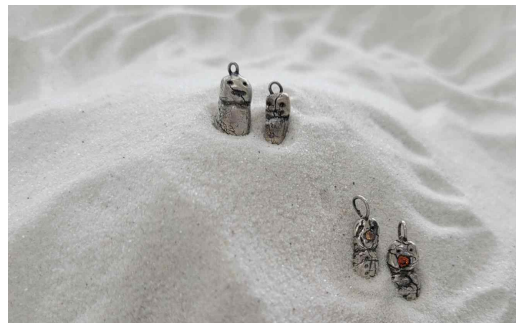
그림 14. 내담자 D의 사례

그림 13은 내담자 C의 모래놀이치료 장면으로, 50대 초반의 전문직 여성이다. 내담자 C는 자신의 꿈을 향해 배움을 즐기며, 20대부터 계획해 온 꿈들을 하나씩 실천하며 삶을 열정적으로 살아오고 있었다. 과거의 자신은 남들과 잘 어울리지 못하는 성격으로 인해 스트레스가 많았고, 혼자 있는 것을 선호했지만 최근 5년 전부터 의식적으로 사람들과 어울리려고 노력했으며, 최근엔 운동을 즐기는 삶을 살고 있다고 했다. 처음에는 혼자 즐길 수 있는 운동이기 때문에 수영을 시작했지만, 지금은 사람들과 어울리려는 목적으로 바쁜 일상 일지라도 틈을 내서 다양한 운동과 취미를 즐기고 있다고 했다. 내담자 C는 부모 두 분 모두 위암과 폐 선암으로 건강에 대한 염려증을 갖고 있었고, 내담자가 4살 때, 집안에 도둑이 들었던 기억이 있어서 안전에 대한 강박이 있었다. 그림 13을 보면, 자신과 가족을 모두 눈사람으로 표현하고 있었다. 특히 자신은 육조에서 행복한 표정을 하는 눈사람을 택했다. 서 있는 눈사람이 아니라 앉아있는 눈사람을 택한 이유로, ‘자유롭게 보여서’라고 말했다.