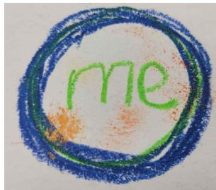
그림 2. me, 회귀의 공간