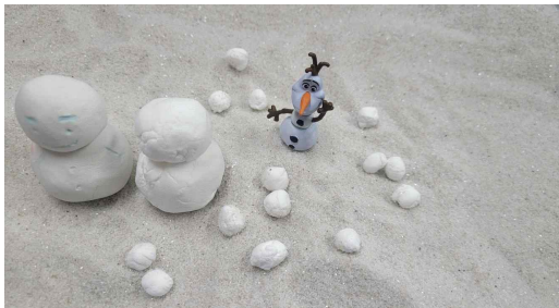
그림 11. 내담자 A의 눈사람과 눈

앞서 문헌 고찰을 바탕으로 모래놀이치료 장면에서 나타난 내담자의 눈사람 상징 사례를 이해를 도우려 한다. 모래놀이치료 장면에서 눈사람은 흰색으로 나타나고 있었으며, 내담자 A의 모래놀이치료 장면에서 나타난 눈사람은 모래와 물을 섞어서 만든 것이 아니라 흰색 점토를 별도로 사용하여 눈과 눈사람을 모래상자에 위치시키는 모습을 볼 수 있다. 이것은 눈사람이 가진 흰색의 고유한 색이 주는 무의식적인 심상과 근원적 경험에 의한 것으로 해석된다.