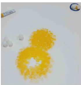
Figure 1. White sponge ball