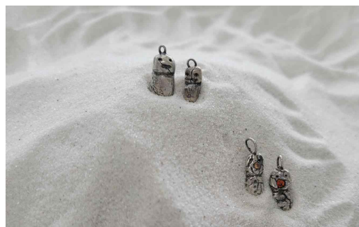
[Figure 14] Case of client D