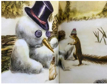
Figure 6. A scene where the snowman is melting

meet a snowman in the form of a cloud in the sky. The snowman says he will return when it gets cold (Dedieu, 2019/2020). In this fairy tale, the snowman disappeared from the world of his friends, but is in a different shape, the form of a 'cloud' in another world [Figure 8], and promises to 'return' to his friends when the season gets cold again.