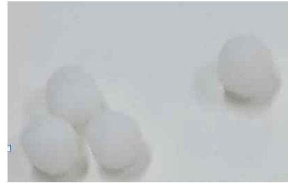
그림 5. 가장 먼저 선택한 표현 도구

이부영(2021)은 Jung은 만다라의 모든 것이 중심과 관계를 맺고 있으며, 그것을 통해서 질서 지어지며, 동시에 에너지의 원천을 묘사하는 인격 중심을 느끼게 한다고 했다. Jung은 만다라를 음(陰)과 양(陽)에 있는 천지간의 모든 대극의 융합이라고 보았다. 만다라 중심에서의 사람은 작은 '나'로서가 아니라 '자기(Self)'로서 느끼며 생각하고 있으며, 원의 변두리를 포함하며 '자기'에 속하는 모든 것, 즉 인격 전체를 이루는 대극을 그 안에 품는 것으로 보고 있다. Aniella(1961/2012)에 의하면, Jung은 만다라가 하나의 점, 즉 중심점으로 되돌아간다는 것을 깨달았다. 만다라는 모든 길의 표현이자, 중심을 향한 길, 즉 개성화(자기실현)를 향한 길이라고 했다. 그림 3과 그림 4에서 표현된 눈사람은 Jung이 말한 만다라 중심의 원이 모든 변두리와 관계되어 연결되는 것과 같은 맥락으로, 가운데에서 시작되어 외곽으로 점점 그 크기를 키워나가는 무의식적 내면을 작업한 결과로 이해될 수 있었다.