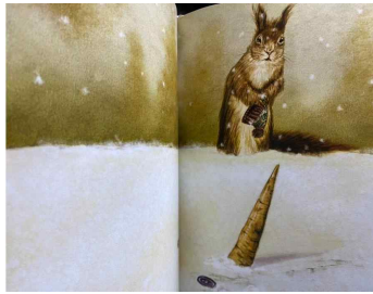
Figure 7. A scene where the snowman disappeared