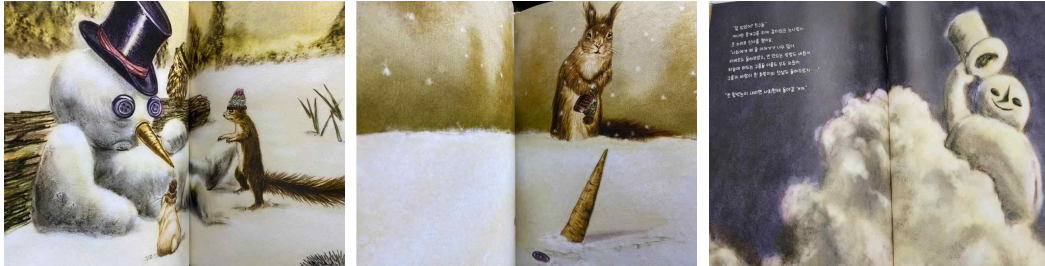
그림 6. 눈사람이 녹는 장면