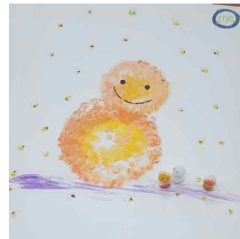
그림 3. 자기표상-눈사람

그림 1, 그림 2, 그림 3은 박사과정 대상관계 수업을 통해 자기표상으로 눈사람을 그렸던 자기 탐색적 집단미술치료 장면이다. 자기표상(self-representations)을 표현하기 위해 가장 먼저 선택한 도구는 '흰색의 스펀지볼'이었다. 흰색의 스펀지볼은 눈사람을 만들 수 있는 눈(snow)의 상징이었다. 스펀지볼에 물감을 묻혀서 질감이 느껴지게 표현되었으며, 처음 물감을 찍은 중심점에서부터 외곽으로 점점 확대시켜가며 원을 크게 표현했다. 화지에 가장 먼저 그린 것은 'me'라는 우측 상단의 원형으로, 그것은 '나만의 우주'를 의미하고 있었다. 물감이 묻은 스펀지볼들은 버리지 않고 눈사람으로 표현되었는데, 'me'의 공간은 스펀지볼이 잠시 머무르는 곳으로, 회귀의 공간이었다. 그림 2는 자기표상이라는 '세계'를 표현한 스펀지볼, 즉 '눈'이 만들어지는 곳이자, 눈이 '세계'로 내려와 쓰임을 하고 다시 돌아가는 회귀의 장소로 표현되었다. 흰색의 눈사람에 덧대어 질감을 표현한 다른 색들은 '열정', '호기심', '아픔', '실패' 등의 다양한 삶의 의미를 나타내고 있었다.