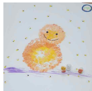
Figure 3. Self-representation-snowman