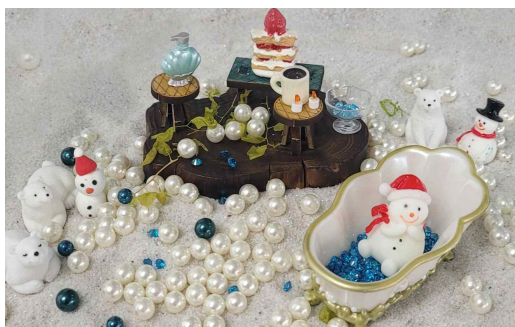
[Figure 13] Sandplay therapy scene of client C