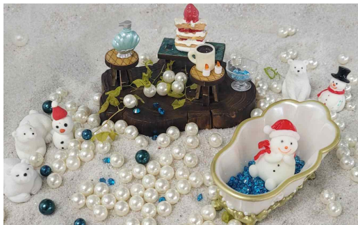
그림 13. 내담자 C의 모래놀이치료 장면

들로부터 독립하고 싶어 했으며 이혼까지 생각하고 있었다. 그림 12에서 내담자는 상자 우측 벽에서부터 울타리를 치며 눈사람과 눈이 내린 나무를 그 안에 배치했다. 자신을 눈사람으로 표현했으며, 스티로폼으로 눈을 표현했다. 울타리 안쪽엔 눈이 내렸으나 울타리 밖은 눈이 내리지 않았다. 울타리 안은 매우 추운 곳이지만, 따뜻한 털목도리를 했기 때문에 자신은 그 안에서 행복하다고 말했다. 내담자 B는 울타리 밖을 설명하면서 잠시 머뭇거렸다. “밖은 생명이 없어요, 울타리 너머로 군고구마 냄새가 넘어오지만, 나는 그것을 먹을 수 없어요, 왜냐면 만지면 내가 녹을 거니까요” 라고 말했다. 자세히 보면, 울타리 밖의 나무는 추위에 잎이 모두 떨어져 앙상하면서도 앞쪽엔 따뜻함이 있는 군고구마가 놓여 있다. 내담자 B는 울타리 안과 밖에서 대극의 상황을 모두 표현하고 있었다. 울타리로 안과 밖의 경계를 명확히 구분하면서, 울타리 밖은 자신은 관여할 수 없는 세상으로, 울타리 안은 춥지만 따뜻하고 안전하게 느끼는 곳으로 인식하고 있었다.