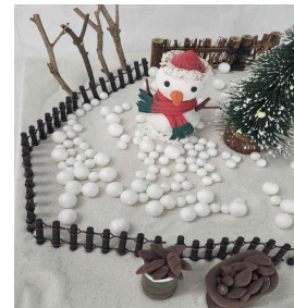
그림 12. 내담자 B의 사례

그림 12는 모래놀이치료 장면에서 나타난 눈사람으로, 내담자 B의 사례이다. 내담자 B는 40대 후반으로, 프리랜서로 부동산 관련 일을 하며 가계의 생계를 주도적으로 꾸려온 기혼 여성이었다. 내담자 B는 어려서부터 부모님의 이혼으로 홀어머니를 모시고 살아왔으며, 어머니가 당뇨병증으로 돌아가시기 전까지 친정의 생계까지 돌보며 책임을 다해왔다. 막내로 태어났으나, 맏이의 역할을 하며 자랐고, 집안 형편이 어려워 고등학교를 우수한 성적으로 졸업하고도 대학 진학을 포기하고 생활전선에 뛰어들었다. 회기에 참여할 당시 남편과 딸이 자신과는 다르게 모든 일에 나태함을 가지는 것에 화를 주체할 수 없어 잦은 갈등이 있었다. 내담자 B는 딸로서, 부모로서, 아내로서, 직장인으로서 맡은 일에 책임을 다해왔고, 부동산 투자에 성공해 점점 더 좋은 집으로 이사하면서 부를 축적해왔다. 하지만 자신과는 다르게 책임감 없는 가족들의 태도에 스트레스가 극도에 달했고, 잦은 다툼으로 인해 가족