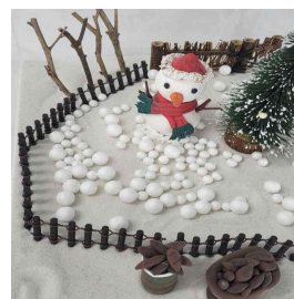
Figure 12. Case of client B