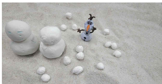
Figure 11. snowman and snow of client A

Based on the earlier literature review, understanding will be helped with clients' cases of the symbol of the snowman that appeared in Sandplay therapy scenes. snowman appear in white at the Sandplay therapy site too. It can be seen that the snowman that appeared in client A's Sandplay therapy scene [Figure 11] was not made by mixing sand and water, but snow and snowman were placed in the sandbox using white clay separately. This is interpreted to have been made with the unconscious image and fundamental experience given by the unique color of white of the snowman.