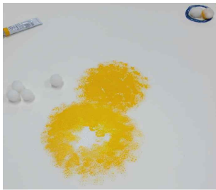
그림 1. 흰색 스펀지볼의 쓰임

하는 것이라고 했다. 또 자기실현은 분석을 받지 않아도 가능한 것으로 보았는데, 자기실현 과정은 모든 인간에 내재하는 원형적 과정이기 때문이다. 사람은 태어날 때부터 잠재력을 가지고 태어나기 때문에 누구라도 자신의 전체를 실현할 수 있다고 보았다. 다만 자아의식이 내면세계에서 오는 창조적 메시지에 주의를 기울이고 자기 자신을 성찰하는 태도를 갖추어야 함을 전제로 했다.