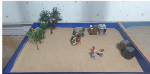
(그림 8) 9회기 모래상자