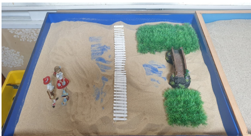
Figure 7. Session 8 sandbox