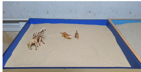
(그림 2) 2회기 모래상자