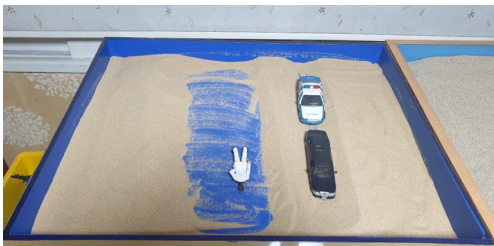
(그림 5) 5회기 모래상자