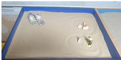
(그림 11) 12회기 모래상자