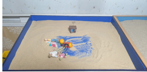
(그림 4) 4회기 모래상자