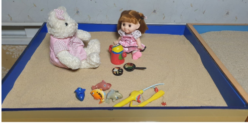
(그림 3) 3회기 모래상자