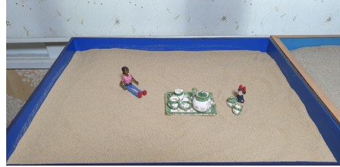
(그림 10) 11회기 모래상자