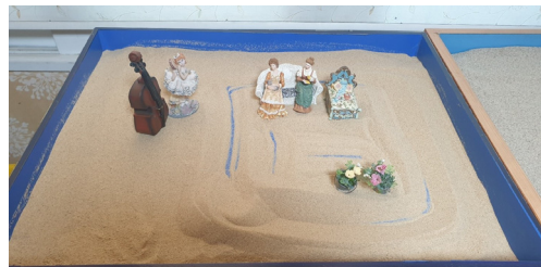
(그림 6) 7회기 모래상자