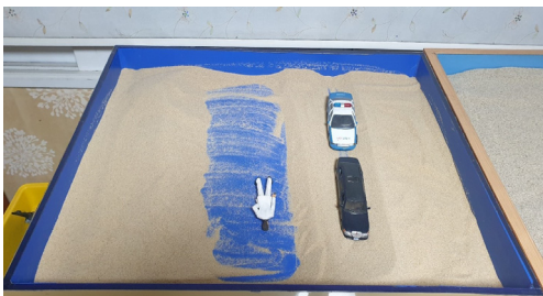
Figure 5. Session 5 sandbox