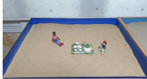
Figure 10. Session 11 sandbox