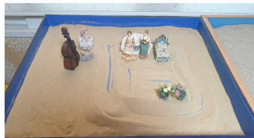
Figure 6. Session 7 sandbox