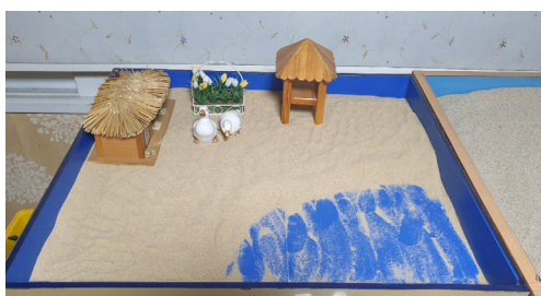
Figure 1. Session 1 sandbox