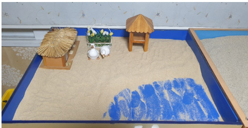
(그림 1) 1회기 모래상자