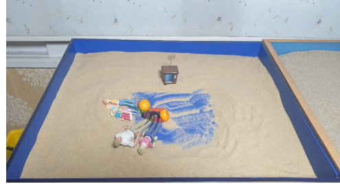
Figure 4. Session 4 sandbox