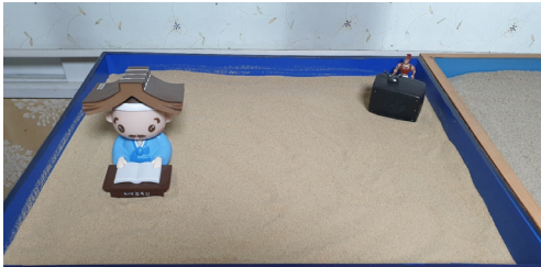
(그림 9) 10회기 모래상자