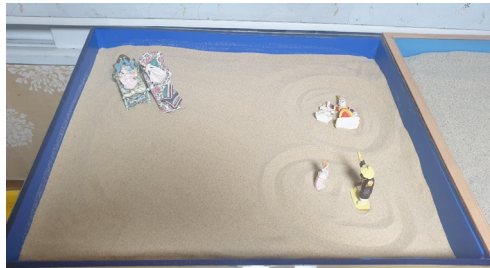
Figure 11. Session 12 sandbox