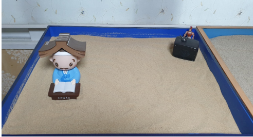
Figure 9. Session 10 sandbox