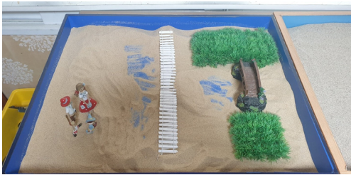
(그림 7) 8회기 모래상자