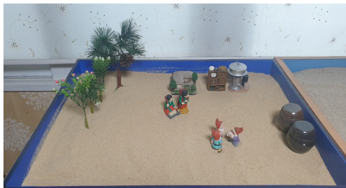
Figure 8. Session 9 sandbox

unconsciousness that connects the outside and inner worlds, enabling the ego and self to interact (Kwack, 2021). The water and bridge in the session 8 sandbox break away from the basic insecure attachment relationship and restructure the maternal instinct to restructure the damaged ego-self axis(Jang, 2017). However, the energy and quantity are still insufficient. In session 9, the dwarfs are the young egos, and unlike their realistic parents, the three dwarfs in the fairy tale are healing on the inner side by restoring their purity through the dynamics of play. The ego that has been nurtured and grown strong overcomes the complex of maternal instinct (Jang, 2017), and became to promote the balanced development of the animus through inner growth and healing.