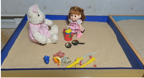
Figure 3. Session 3 sandbox