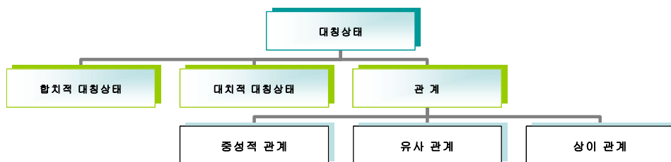
【표 4】 <대칭상태> 부류의 구성

이상과 같은 통사의미 속성들의 차이를 고려하여 relation과 rapport 류의 대칭명사들을 포함하는 <중성적 관계>와 parenté와 affinité류를 포함하는 <유사 관계>, différence와 dissemblance 류의 명사를 포함하는 <상이 관계>가 <관계>의 하위부류로 설정되었다. 그 결과 구축된 <대칭상태> 부류는 다음과 같은 구성을 갖는다.