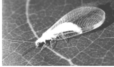
출처: 이종욱 (1998), p. 219.