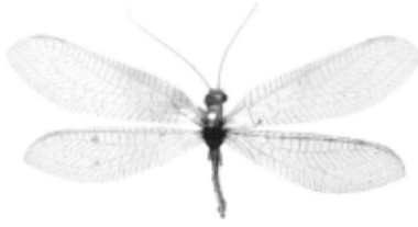
출처: 박규택 외 (2012), p. 129.