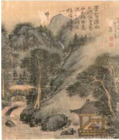
[그림 1] 정선(鄭敏), 《사공도시품첩》(司空圖詩品帖), <유동>(流動), 우면, 1749년