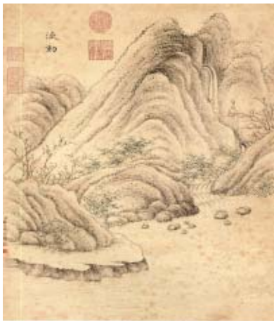
[그림 3] 반시직(潘是稷), 《사공도이십사시품도》(司空圖二十四詩品圖), <유동>, 우면