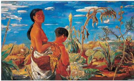
〈이인성, 「가을 어느날」(1934)〉

화에서의 조선적인 것, 또는 향토색을 둘러싼 논쟁의 추이를 몰랐을 개연성은 희박하다. 1934~36년경에 조선양화단(朝鮮洋畵壇)에서는 매우 조선적인 그림들이 창작되었다. 그 무렵에 발표된 김동리의 「무녀도」(1936), 박태원의 「천변풍경」(1936), 이태준의 『달밤』(1936), 이효석의 「모밀꽃 필 무렵」(1936) 등이 조선적인 색채가 농후한 회화를 연상시키는