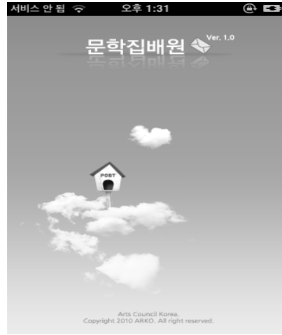
[그림 8] 문학집배원 어플리케이션

영상매체에 익숙한 현재의 독자층들은 책을 읽는 것만이 아닌 듣는 것, 감상하는 것으로도 받아들이고 있다. 스마트폰을 통한 감상방식은 인터넷 창을 띄워 정보를 검색했던 기존의 매체활용방식보다 편리하고 간단하다. 이처럼 통신기기 발달의 첨병 역할을 담당한 스마트폰을 활용해 시배달을 서비스하려 한 <문장>의 노력은 전자매체를 통해 실시간 변화하는 독자층의 소리를 담아내려는 소통공간의 창출 시도로 평가될 수 있다.