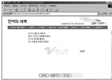
[그림 1] 언어의 새벽

1990년대 초반부터 시작되었는데, 당시의 변화는 선형성에 기반을 둔 시의 전통 안에서 전개된 소재 중심의 변이로 사회, 문화적 변화상의 시적 반영이었다. <언어의 새벽: 하이퍼텍스트와 문학>(http://eos.mct.go.kr) [그림 1] (이하 <언어의 새벽>)과 <生時·生詩>(www.livepoems.net)[그림 2]가 실험적으로 운용된 2000년이 되어서야 디지털 매체가 직접 창작에 적용되며 ‘재매개’의 양상으로 우리 시단에 최초로 등장하였고, 이전 시기의 시도와 차별화되는 현대시의 디지털화 양상들이 나타나게 되었다.