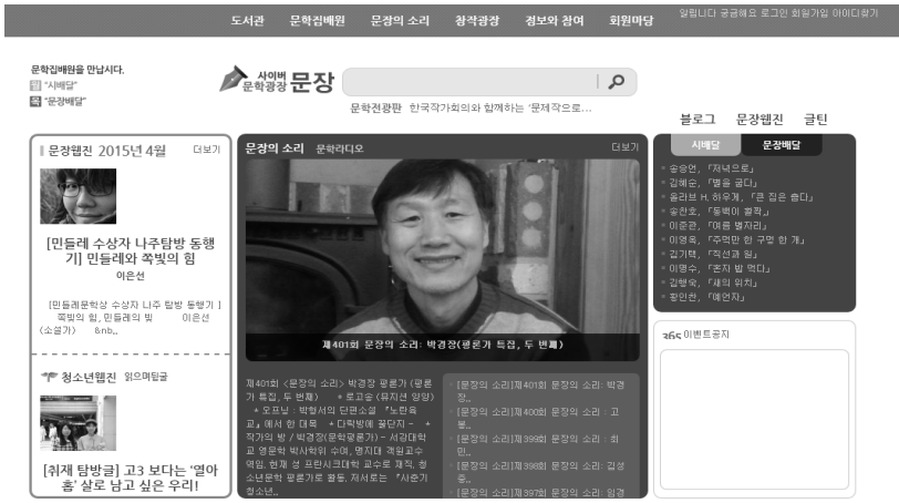
[그림 5] 사이버 문학광장 문장

본고에서는 디지털화로 대표되는 사회, 문화적 측면의 변화가 시 장르의 창작과 수용방식에 미친 영향을 보다 구체적으로 살펴보기 위해, 가장 최근까지 시의 디지털화를 시도해온 <사이버 문학광장 문장> ( http://www.munjang.or.kr/ )[그림 5] (이하 <문장>)을 분석의 대상으로 삼아 이들이 진행해온 실험적 양상을 검토해보고 그 의미와 한계를 짚어 보기로 한다.