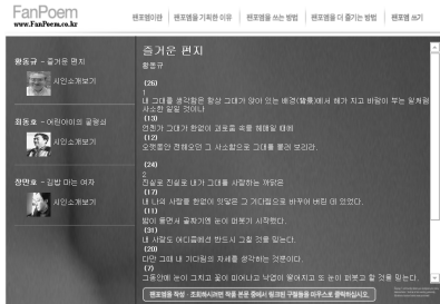
[그림 3] 팬포엠