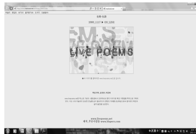
[그림 2] 生時·生詩

2000년 새로운 예술의 해를 맞아 문화관광부 문학분과위원회의 지원을 받아 진행된 <언어의 새벽>과 <生時·生詩>는 국내 최초의 하이퍼텍스트 시 쓰기 실험을 표방한 프로젝트의 성격으로 진행되었으며, 기성 문단의 시인들과 일반 독자들이 디지털화된 하나의 공간에서 미디어 매체를 활용한 새로운 창작과 감상의 방식을 경험하게 하려는 목적을 갖고 진행되었다. 하지만 이들 사이트의 구축과 운영은 이벤트성 행사의 성격을 강하게 드러내었고, 대중적 홍보의 부족 때문인지 실제로는 일반 독자들의 참여가 저조해 능동적 독자의 참여라는 하이퍼텍스트의 성격이 부각되지 못했다. 16)