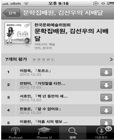
[그림 7] 시배달 팟캐스트