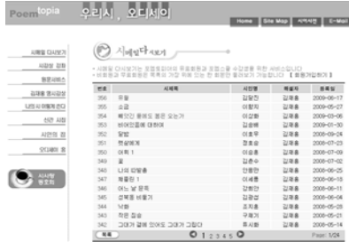
[그림 4] 포엠토피아

이들 초기의 디지털화 양상은 한편으로 너무나 기술적 측면에 치중해 시의 질적 측면을 고려하지 못한 듯 보일 때도 있고, 한편으로는 전통적인 시의 내용을 그대로 웹상에 재현하는 듯 보여 디지털 시라면 보다 “이렉적이고 극적이며 평범하지 않” 21) 을 것이라는 독자의 기대를 빚나 가기도 한다. 또한 새로운 매체시대에도—죽음을 맞이하지 않고—저자의 영향력이 오히려 막대해지는 현상을 보이기도 했다. 22) 이처럼 지금까지 국내 시단에 등장한 디지털화의 실험적 시도들은 비선형성, 다매체성, 독자의 적극적 참여라는 하이퍼텍스트의 특성을 성공적으로 구현했다고