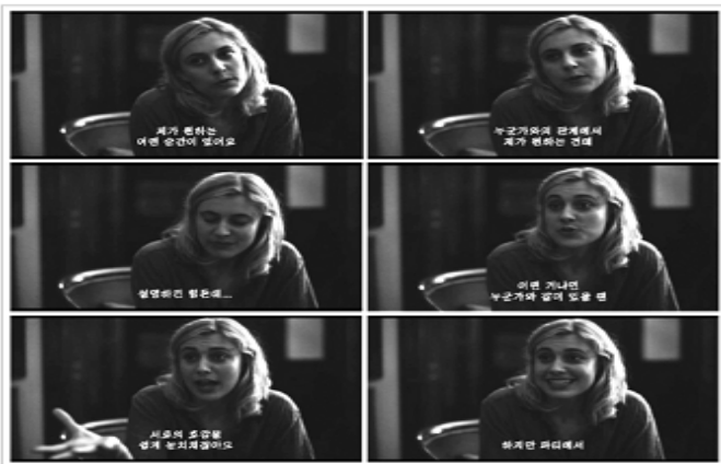
[그림 6] 함성호 <우리들의 시간> 일부

—영화 『프란시스 하(Frances Ha)』 중에서 / 감독 : 노아 바움바흐 (Noah Baumbach)