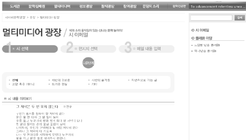
[그림 10] 개편 전 사이버 문학광장 문장(2012년) 내 ‘멀티미디어 광장’의 ‘시 이메일’ 코너

직접 자신의 시를 낭송하는 ‘작가낭송 플래시’ 코너와 ‘느낌별 플래시’ 코너로 나뉘었다. 또한 ‘시 이메일’ 코너[그림 10]에서는 네티즌 독자들이 직접 시를 본문으로 삼아 편지지를 선택하고 꾸며 이메일을 작성해 보낼 수 있게끔 했다. 이는 사용자가 각 단계별로 ‘시’와 ‘편지지’의 메뉴를 선택함으로써 자신의 독서경로를 만들고, 이를 개인의 상상력 속에서 ‘메일’로 작성하는 일종의 창작과정으로 이어진다는 점에서 매체를 통한 재매개의 성격을 지닌다. ‘놀이’의 개념을 차용하여 독자의 능동적인 참여와 시의 창의적 수용을 도모하는 이 같은 코너들은 새로운 매체를 활용해 시가 지닌 놀이로서의 성격 54) 을 잘 구현한 경우로 평가받을 수 있으나 현재 자취를 감춰 아쉬움을 남긴다.