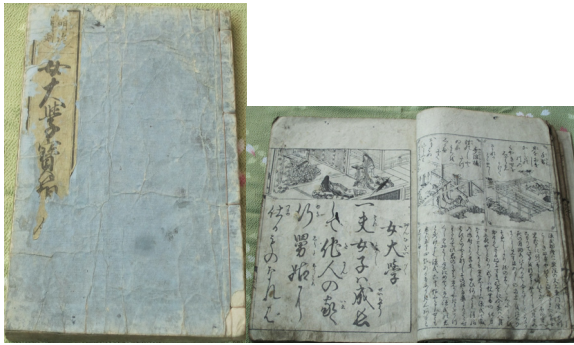
[그림 4] 『여대학 다카라바코』(女大學寶箱) 표지 및 「여대학」 첫 면.

교훈형 여성용 ‘왕래물’인 ‘여대학’은 1716년에 출판된 작자 미상의 『여대학 다카라바코』(女大學寶箱)에 수록된 『여대학』 19개 조만을 인용하여 편찬하거나 내용을 더하여 편찬한 여성 교훈서의 총칭이다. 가나 문자와 한자를 같이 쓰고 한자에는 독음을 달아 읽기 쉽게 하고 그림을 넣어 내용의 이해를 도왔다.