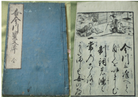
[그림 3] 『온나이마가와 다카라 문고』(女今川寶文庫) 표지 및 내용. 이미숙 소장

와조』(今川状)를 본떠 여성이 일상생활에서 지켜야 할 마음가짐을 ‘~를 하지 말아야 한다’는 금지조항 23개조로 정리한 것으로, ‘온나이마가와 다카라 문고』(女今川寶文庫)라는 책을 보면, 본문 첫머리에 “이마가와를 본떠 스스로를 경계하는 제사(制詞)의 조목들”이라는 기술이 있고, 그 뒤에 23개조의 주의할 점과 이러한 훈계를 지키기 위한 마음가짐이 기술되어 있다. 그 주요 내용은 “여성이 놀이에 능하거나 타인을 원망하거나 질투하거나 비방하거나 무시하거나 하는 것을 훈계하고, 부모의 깊은 은혜를 잊지 말고 남편에게 나를 내세우지 말며 천도(天道)에 따라 행동할 것을 요구하며, 스스로 분수를 알고 조신하게 행동할 것을 일상생활의 구체적인 사례를 들어 가르치고 깨우친” 36) 것이다.