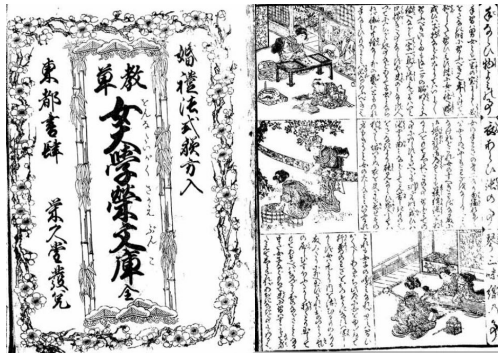
[그림 2] 『여대학 사카에 문고』(女大學榮文庫) 속표지(왼쪽) 및 제1항 「습자와 독서(手ならひ物よみの事, 오른쪽 위). 도쿄가쿠게이 대학(東京学芸大学) 소장

에도 시대 여성교육은 비록 경제력 있는 무사나 조닌, 그리고 농민 집안의 여성에 한정된다는 한계는 있었지만, 여성들의 교육 또한 남성교육과 마찬가지로 집 안을 벗어나 '테라코야'를 장(場)으로 하여 저변을 넓혀 나아갔고 가장 기본적인 교육내용은 읽고 쓰기 능력을 키우는 '습자'였다.