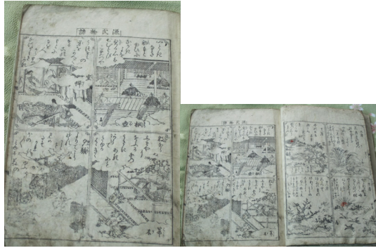
[그림 5] 『여대학 다카라바코』(女大學寶箱) 내 「겐지 모노가타리」(源氏物語).

하지만 이후 교훈형 여성용 ‘왕래물’로 유통되고 향유된 것이 『교여자법』의 취지를 종합적으로 살린 『여대학 다카라바코』가 아니라, 그 일부분인 『여대학』을 그대로 인용하여 제작하거나 아니면 그 내용에 다른 내용을 첨가하여 제작한 ‘여대학’류였다는 사실에는 주목할 필요가 있다. 즉 『여대학 다카라바코』와 ‘여대학’류에 담긴 여성지식은 변별하여 판단할 필요가 있으며, ‘여대학’류의 여성지식은 『여대학 다카라바코』의 종합적인 여성지식이 아니라 여성에게 유교이념을 고취시키고 가부장적인 사회 속에서 여성의 위치를 종속화하려는 여성지식으로 기능하였다고 볼 수 있다.