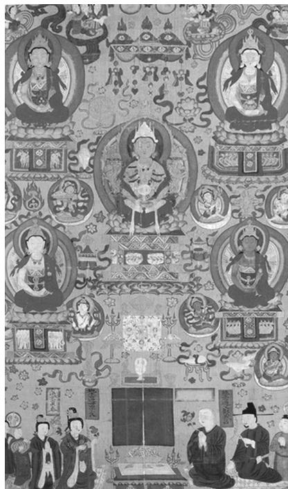
[图 8] 金刚界五佛 法国吉美博物馆藏(MG.17780) 北宋 绢本着色 101.0 × 61.0 cm