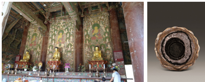
[图 9] (右) 直指寺大雄殿三世佛後佛帧 麻本着色 朝鲜1744年/图10(左)法门寺捧真身菩萨像莲座顶面篆刻三品悉地真言 唐代

其二，朝鲜点眼仪以奉请金刚顶37尊，作为对佛尊格的加持，赋予其圣化和神威的象征。因此在韩国的佛像、佛画上可见书写相关的梵字或真言。佛画一般书写在作品背面、正面画幅四方边缘，或是画中佛像的顶上、口、胸、眼下、眼睛、眉、眉间白毫以及宝冠上。依李宣镛研究，朝鲜后期佛画之梵文种子字或真言皆依据『造像经』书写，大致分两种类型，一是混用『造像经』中「诸佛菩萨腹藏坛仪式」、「妙吉祥大教王经」、「三悉地坛释」所述诸真言，如1701年南长寺「甘露帧」、1708年「宝镜寺挂佛」、1744年「直指寺三世佛后佛帧」(图9); 二是仅书『造像经』「三悉地坛释」中所述真言，如1687年「麻谷寺挂佛」、1745年「浮石寺挂佛」、1770年高方寺「神众图」、1790年南长寺「十六罗汉图」等。 22)