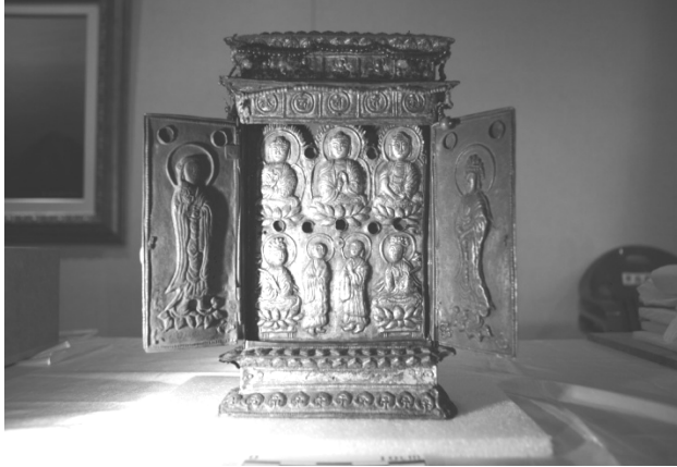
[图 6] 高峰国师橱子愿佛 松广寺圣宝博物馆藏 丽末朝初

中国敦煌地区金刚界五佛图象的滥觞，最初在九世纪初敦煌莫高窟第370窟主室窟顶已出现金刚界五佛图象形式的雏形，但还没有出现成熟的具有中央本尊的密教五方佛图象。 19) 开始有中尊大日如来的金刚界五佛图象，主要在五代宋初曹氏归义军时期及西夏至元两时期。曹氏归义军时期有榆林第28窟、第35窟东壁北侧五代绘「五智如来曼荼罗」、藏经洞绢画MG.17780, EO.3579, 以及『金刚峻经』曼荼罗残片P.2012中的金刚界五佛；西夏末期至元的莫高窟第465窟、第464窟窟顶，以及榆林第4窟四壁壁画上方的金刚界五佛。这些作品阮丽认为皆属曹氏归义军时期的宋初之作。 20) 从五佛的配置形式来看，「法身中围会三十七尊」与榆林第35窟东壁北侧五代绘「五智如来曼荼罗」或藏经洞出土MG.17780(图8)，都是中心置毗卢遮那佛，四隅画四佛和各眷属，构图形式颇为类似。