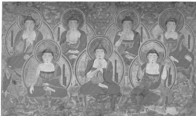
[图 2] 松广寺五十佛帧(部分) 毗卢遮那佛(下中) 卢舍那佛(下左) 释迦如来佛(下右), 阿弥陀佛阿佛、阿閼佛、宝生佛、不空成就佛(上排由左向右) 139 × 232 cm 松广寺圣宝博物馆藏 朝鲜1725年

药王药上二菩萨经』内述三劫三千佛于因位时所闻持的五十佛，经主要在阐述称礼佛名灭除诸罪的功德。 12) 依『仔夔文节次条列』「分坛排置规」述在水陆斋毗卢坛布置「五十佛图」，可知是与水陆斋仪式有关的佛画。 13)