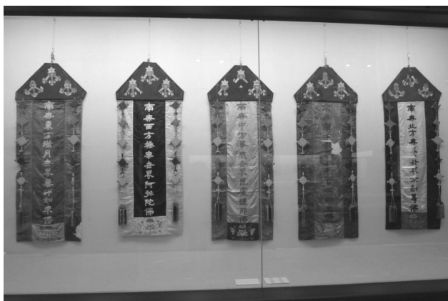
[图 4] 五方幡 梵鱼寺圣宝博物馆藏 朝鲜后期

查阅朝鲜佛教仪式集，除「礼五佛」外，还发现「五方佛请」、「五方赞」、「五方幡书规」等仪文。但五色或佛名与金刚界五佛不同，整理如 [表二]。由表列来看，『造像经』、『诸般文』「点眼文」所出现的五方佛、五色与『金刚顶经』一致，可知点眼仪所依是金刚顶密法，『五种梵音集』、『作法龟鉴』、『天地冥阳水陆斋仪梵音删补集』、『密教集』中的「五方佛请」、「五方赞」、「茶毗作法」、「千手四方观」等，所礼请五佛为东方满月世界药师佛、南方欢喜世界宝胜如来佛、西方极乐世界阿弥陀佛、北方无忧世界不动佛、中方华藏世界毗卢遮那佛，如现梵鱼寺藏五方幡 (图4)。五色是中央黄、东方青、西方白、南方赤、北方黑，和中土阴阳五行五色的说法一致， 16) 应和使用仪式的不同有关。但由此也可看出密教仪轨吸取它文化要素，呈现出通俗化的面貌。