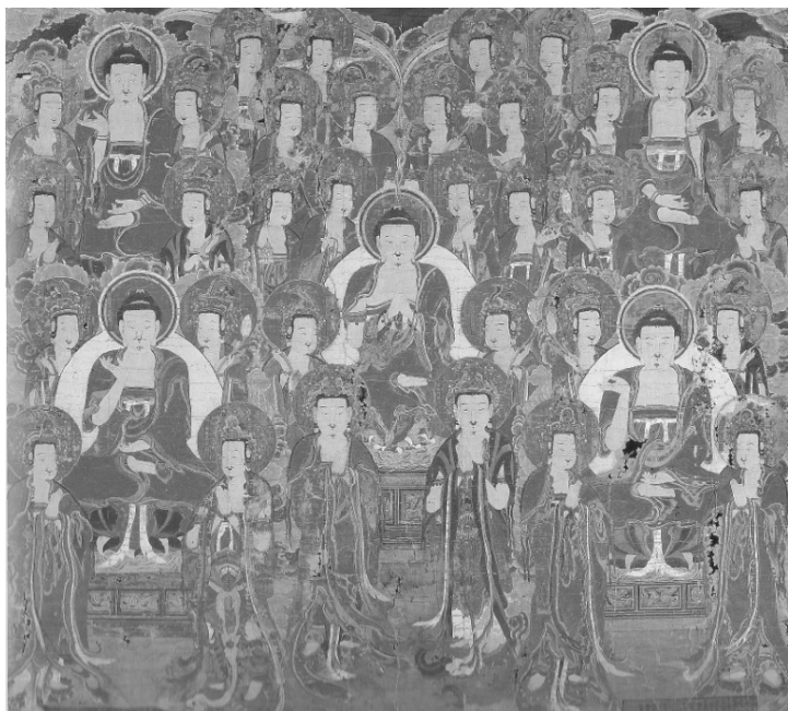
[图 7] 法身中围会三十七尊 大兴寺圣宝博物馆藏 朝鲜1845年

敦煌所见金刚界五佛以石窟壁画或绢画为主，而朝鲜属挂轴式绢画，安奉于大光明殿佛坛佛像后面，作为礼拜之用。这与点眼仪中迎请金刚界曼荼罗37尊作为证明的职能又不同。和密教以曼荼罗图的佛菩萨形相示现众生，作为观想或觉悟的媒介物，也有差别。从配置场所和榜题书三十七尊名称大致与敦煌『瑜伽佛礼文』所述相同来看，不免使人起疑与礼金刚界37尊忏仪有关。如前述，草衣禅师发起绘制『法身中围会三十七尊』，与祈愿金正喜获得赦免有关，表示当时在寺院或主事者必然知晓顶礼金刚顶瑜伽37尊仪式，才以此为之。总之，仅凭此画要梳理出金刚顶瑜伽37尊仪式在朝鲜半岛流传的全貌，相当不足，但就金刚顶瑜伽37尊佛画的稀少性来说，仍是弥足珍贵的资料。