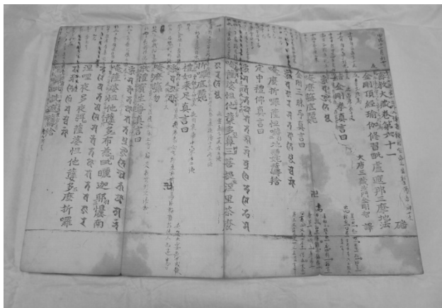
[图 5] 金刚顶经瑜伽修习毗卢遮那三摩地法 湖林博物馆藏 高丽

大光明殿佛坛供奉毗卢遮那佛像，后配置『法身中围会三十七尊』，图中毗卢遮那佛位于中央，四端依顺时针方向配置南西北东四方佛，五佛中毗卢遮那佛、观自在佛、不空成就佛三尊背后有身光。各佛周围菩萨围绕，中央毗卢遮那佛为四波罗蜜菩萨、四摄菩萨和八供养菩萨；四方佛各分配十六金刚大菩萨。其中北方不空成就佛的金刚法菩萨，疑为金刚牙菩萨笔误。三十七尊名称经与敦煌『瑜伽佛礼文』对照，发现大致相同(参照表三)。值得注意的是，莲花部部主乃依『金刚顶经』的观自在佛，不是阿弥陀佛。与『造像经』、『诸般文』等仪式集所列西方观自在佛一致。