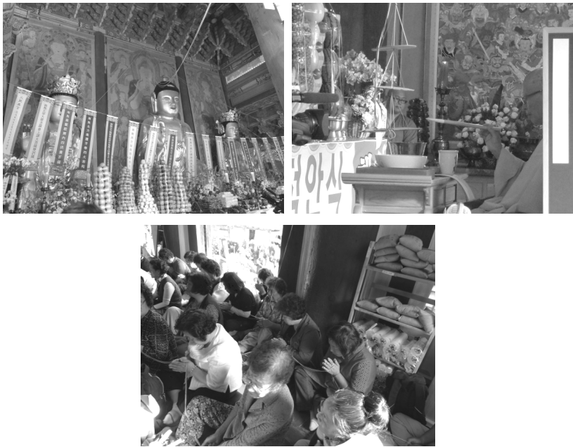
[图 3] (3张) 点眼仪中佛像和与会者手中所缠绕五色丝线。忠清道无量寺极乐殿后佛帐修复完工点眼仪式，2015.9.19.摄。