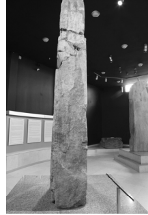
[사진 2] 빌개 카간 비문의 남쪽 면