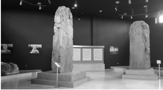
[사진 1] 빌개 카간 비문(왼쪽)과 쥘 테긴 비문