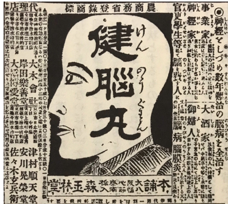
[그림 2] 메이지 후기에 발행된 일본의 신문에 실린 건뇌환 광고.