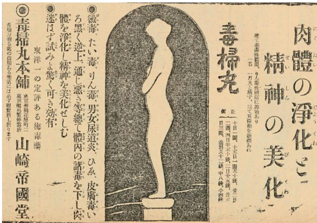
[그림 4] 1926년 『조선신문』의 독소환 광고.

독소환, 독멸 등 생약을 사용한 매독약은 페니실린이 나올 때까지 꾸준한 인기를 누렸다. 31) 1920년대에 등장하는 매독 약 광고에는 매독, 태독, 린독, 남녀요도염, 냉증(ひょう), 피부독이 검게 올라오는 것 등에 잘 들고, 순환이 안 좋은 체내의 각종 독을 빼내주어 육체를 정화하고, 정신을 미화해주는 등의 약의 다양한 효능을 설명한다. 고민하지 말고 한 번 사용해 보면 놀랄만한 효과가 있다고 약의 사용을 부추긴다. 약이 매독, 태독 등 각종 독에 효과가 있다고 설명하고 있지만, 광고의 맨 마지막에는 ‘동양 제일의 정평이 나 있는 매독약’이라는 수식어를 덧붙이고 있어, 여전히 매독약으로 사용되고 있음을 확인할 수 있다. 32)