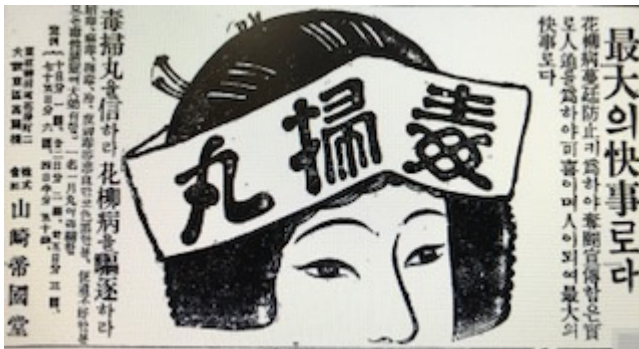
[그림 5] 1922년 『동아일보』의 독소환 광고.

것이었다고 하지만, 매독약은 식민지 조선 사회에서도 꾸준히 판매되는 스테디셀러가 되었다. 동아일보에 실린 독소환 광고가 이를 증명해 준다. 33) 광고의 형태는 약의 효능과 그에 대한 설명, 약값, 제조원, 등록상표 혹은 매약을 대표하는 이미지로 구성되어 있어, 조선신문에 실린 그것과 크게 다르지 않다. 다만, 광고문구에서 동아일보에서는 매독이라는 용어 대신 화류병이라는 용어를 사용하고 있다는 점, 조선신문과 동아일보에 등장하는 이미지 캐릭터, 구매 가능한 약 분량 등에서는 차이점이 보이기도 한다. 34) 이렇게 광고의 문구와 이미지 등은 시기에 따라 변화되는 모습을 보이지만, 20세기 초에 만들어진 소비자에게 제공하는 정보의 형식은 공통적으로 작동하고 있음을 확인할 수 있다.