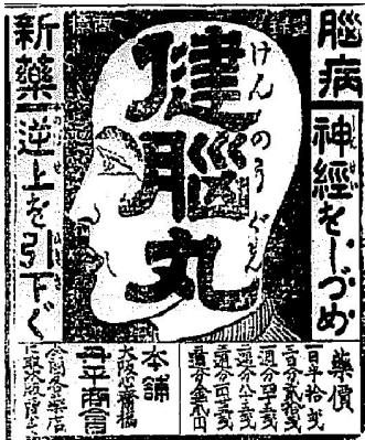
[그림 1] 1906년 『조선신문』의 건뇌환 광고.

1906년 『조선신보』 25) 에 등장하는 건뇌환의 광고는 머리카락이 없는 사람의 옆얼굴에 건뇌환이라는 글자가 새겨져 있는 등록상표를 광고의 정중앙에 배치하고, 효능을 자세히 기록한다. ‘뇌병의 신약’이며, 신경을 안정시켜주며, 피가 몰리는 증상[逆上]을 완화해준다. 뇌출혈, 신경통, 두통, 뇌막염, 안면신경통, 히스테리, 이명, 전간, 불면증, 중풍, 뇌졸중 등 각종 머리와 뇌, 피의 순환과 관련된 대부분의 증상을 열거하고 있어, 얼굴과 머리에 나타나는 대부분의 증상에 효능이 있음을 나타내고 있다. 이는 소비자에게 어쨌든 뇌와 머리에 관련된 문제를 가지고 있으면 이 약을 사용해보면 효과를 얻을 것이라는 의미로 다가갈 수 있다. 그 이외에 약의 효능과 함께 이 약품을 제조한 일본의 상점명과 약값이 기재되어 있다. 26)