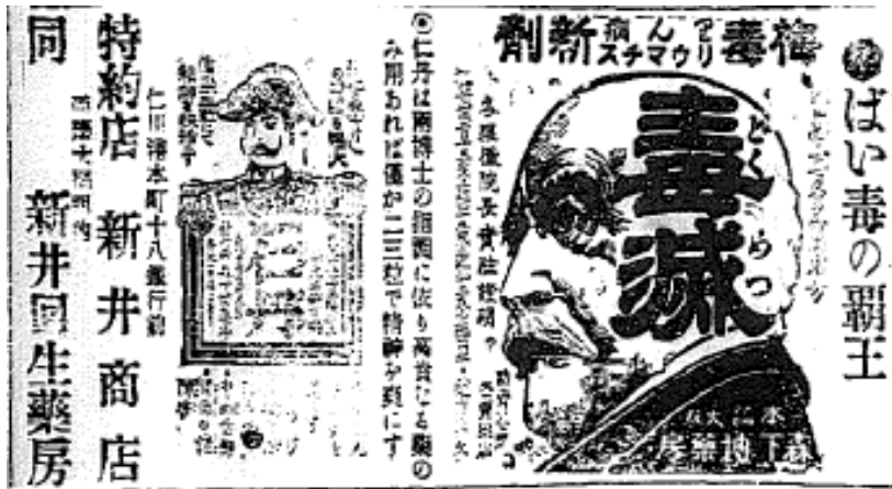
[그림 3] 1906년 『조선신문』의 독멸(毒滅) 광고.

이 아니라 의학사 7명이 합동으로 처방하고, 공립 구미원장(驅黴院長)이 실험하고, 설명한 것으로 약에 권위를 부여하고 있다.