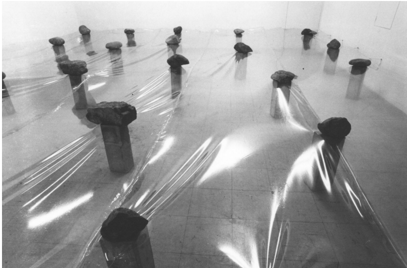
[도판 1] 스가 키시오, <다분율>(多分律, 1975) 콘크리트, 돌, 플라스틱 시트, 가변 크기.