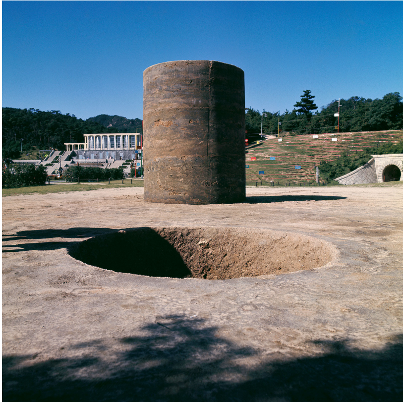
[도판 4] 세키네 노부오, <위상 - 대지>(位相 - 大地, 1969) 흙, 시멘트, 가변 크기.