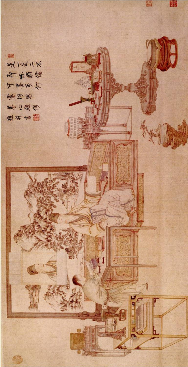
[그림 3] <건륭황제시일시미도>(乾隆皇帝是日圖), 종이에 채색, 76.5 x 147.2cm, 북경(北京) 고궁박물관(故宮博物院).