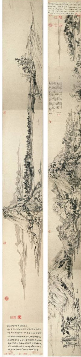
[그림 5] 황공망, <부춘산거도>(富春山居圖), 무용사권(無用師卷), 1350년, 종이에 수묵, 33.0 × 636.9 cm, 타이페이[臺北] 국립고궁박물원(國立故宮博物院).