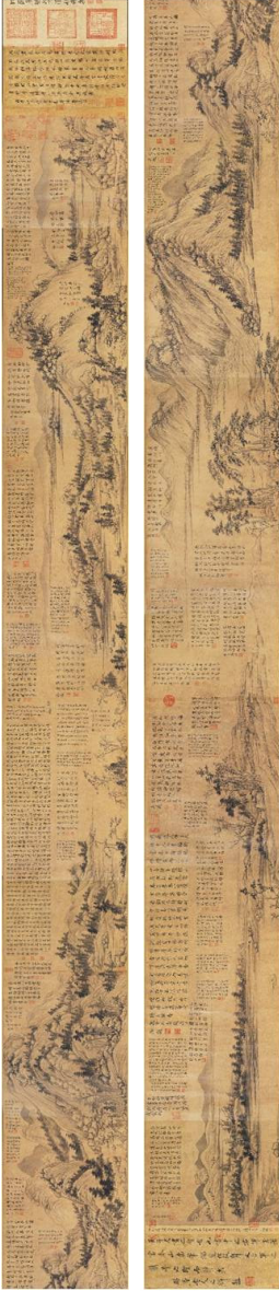
[그림 4] 전(傳) 황공망(黃公望, 1268-1354), <부춘산거도>(富春山居圖), 지명권(子明卷), 타이페이[臺北] 국립고궁박물원(國立故宮博物院).