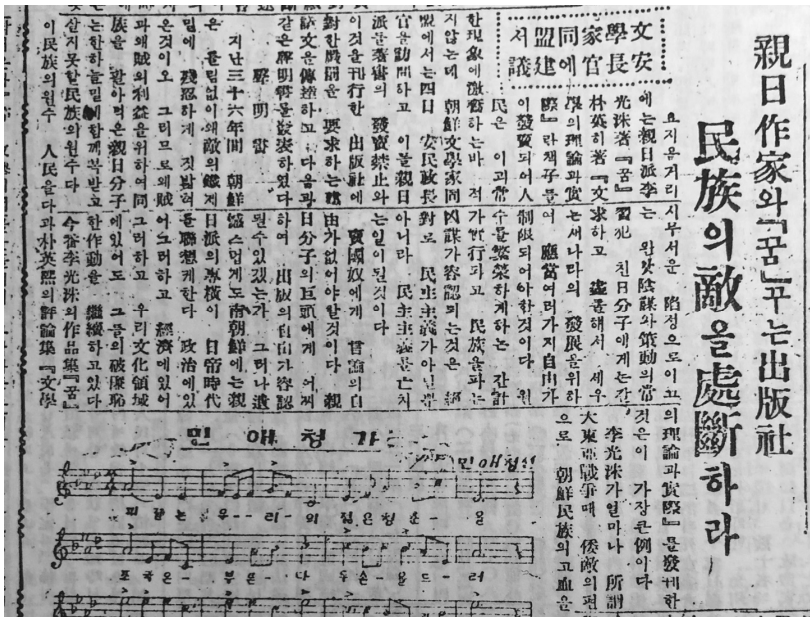
[그림 2] ‘친일작가와 『꿈』꾸는 출판사 민족의 적을 처단하라’, 『문화일보』, 1947.7.6.

“요지음 거리에는 친일파 이광수 저 『꿈』 박영희 저 『문학의 이론과 실제』란 책자들이 발매되어 인민은 이 괴상한 현상에 격분하는바 적지 않은데 조선문학가동맹에서는 4일 안민정장관[안재홍 민정장관-인용자]을 방문하고 이들 친일파들 저서의 발매금지과