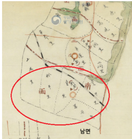
[그림 3] 과천군 약도의 남면 일대 48

아래의 [그림 3]은 당시 통첩된 면 통폐합 조사 방침에 따라 신·구 면 경계와 소속 리의 위치, 각종 지형 및 시설을 표시하여 첨부한 도면이다. 여기서 과천군 남단의 남면과 이에 인접한 하서면 사이에는 산맥과 같은 지형이 표시되지 않았으며, 동쪽의 산맥은 광주군과의 경계를 이루는 산맥을 표시한 것이다. 물론 [그림 3]은 정밀한 지형도라기보다는 대략적으로 각