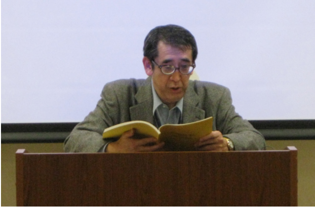
[그림 1] 학술교류회에서 토론하는 히로세 테이조 교수(2012년 2월 15일)

한 석사논문을 작성한 직후여서 일본에서 식민지 조선의 토목을 연구하는 히로세 테이조 교수를 만나는 것 자체가 신나는 일이었다. 교류회 장소에서 히로세 교수에게 필자의 석사학위논문을 드리고, 뒤풀이에서 히로세 교수 옆자리에 앉아 이런저런 대화를 나눴던 기억이 생생하다. 대화라기보다는 히로세 교수께 일방적으로 배웠다고 해야 할 것이다. 그 뒤 히로세 교수의 많은 논문을 읽으며 식민지 조선에서의 토목사업과 정책, 토목관료에 관한 정보를 얻고 지식을 확장할 수 있었다.