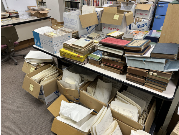
[그림 2] 히로세 교수가 수집한 자료의 일부(2024년 11월 25일 필자 촬영, 리쓰메이칸대학 코리아연구센터)