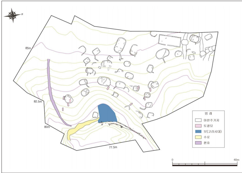
[그림 2] 곡성 동화정원 가지구 유구분포도 23

호자(변기: 고락산성), 벼루(검단산성), 녹유 잔(고락산성) 등 중앙의 문화, 혹은 지식관료의 존재를 암시하는 유물도 출토된다. 이러한 양상은 백제 중앙의 문화를 향유하는 주민집단의 이주를 반영하는 것으로 해석할 수 있다. 24