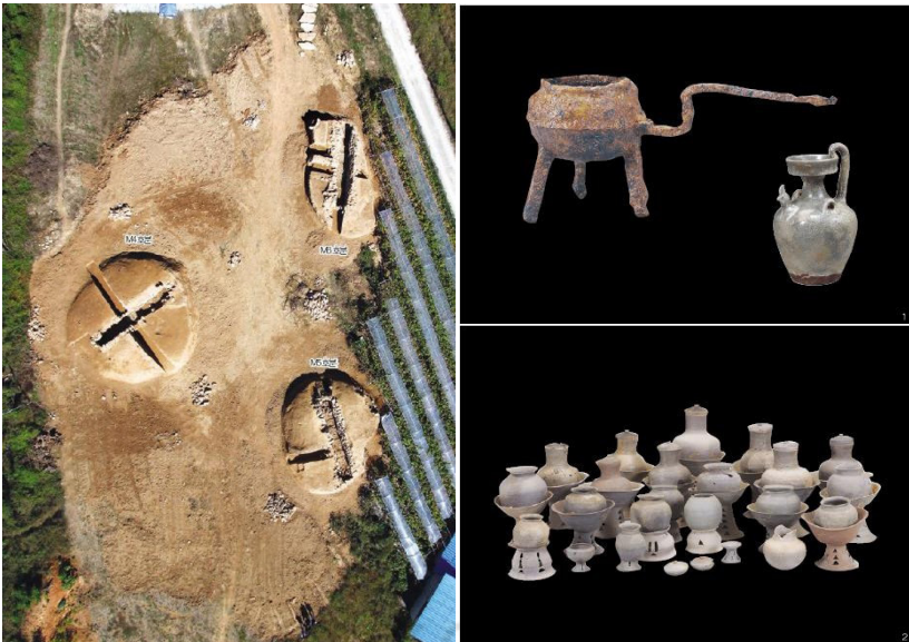
[그림 1] 남원 월산리고분군 조사 광경 및 출토유물

만약 고고학 자료의 도움을 받지 못하였다면 호남 동부지역은 기문, 대사 등 몇몇 지명의 위치 비정 후보군에 머물렀을 것이다. 고고학의 경우 백