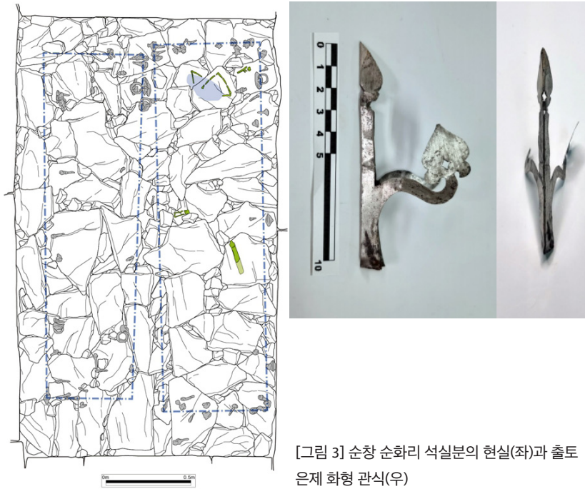
[그림 3] 순창 순화리 석실분의 현실(좌)과 출토 은제 화형 관식(우)

이다. 척문리 고분에서는 백제의 나솔(奈率) 이상의 관인이 소유한 은제 화형 관식이 실물로 출토되었다. 초촌리고분군은 호남 동부 최대 규모의 백제 고분군으로서 200기 이상의 횡혈식석실묘가 분포하고 있다. 피장자에 대해서는 백제 중앙 출신 지방관을 중시하지만 고분군의 총 개체수를 고려하면 중앙에 적극 협조한 현지인도 당연히 포함되어 있을 것이다. 초촌리고분군과 척문리고분이 분포하는 남원 이백면 일대는 백제의 프론티어이다.