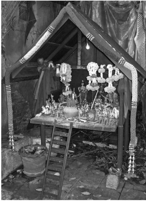
<그림 3> 태국에서 흔히 찾아볼 수 있는 정령승배의 신당의 모습.

혼상제를 비롯한 집안의 중요한 행사들을 주관하며 농산물을 시장에 팔아 집안의 경제를 이끌어나가고 있다. 1830년대 초에 영국인 열은 태국의 아낙네들이 “떠다니는 집”(floating house)에서 새벽부터 장사를 하는 데 비해, 남편은 하릴없이 뒷전에 앉아 있었다고 말한다(Earl 1971, 160).