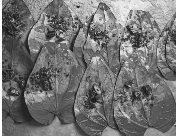
<그림 2> 석회를 바른 구장잎과 빈랑열매

필리핀의 가톨릭교회, 인도네시아와 말레이시아의 이슬람 성직자, 베트남의 유교적 정부의 가치 판단에 의해, 그리고 지난 1세기간 산업화와 도시화의 물결에 동남아시아 사회의 도처에서 오늘날 거의 사라졌다. 그러나 주술적 목적을 갖는 이 관습은 동남아시아 토착인들 사이에서 과거에 광범위하게 행해졌으며(Reid 1988, 77-79; Turton 1987, 366), 지금도 태국과 미얀마 등의 나라에서는 농촌에서 문신을 한 사람을 종종 볼 수 있다. 빈랑열매를 구장잎과 석회와 함께 씹는 소위 ‘빈랑 문화’(Reid 1988, 42-44; Umemoto 1983)와 치아를 검게 물들이는 습속(Huard and Durand 1994, 216)은 오늘날 도시 지역과 농촌의 대부분 지역에서 찾아보기 힘들지만, 이들 역시 동남아시아의 토착적 문화에 속한다.