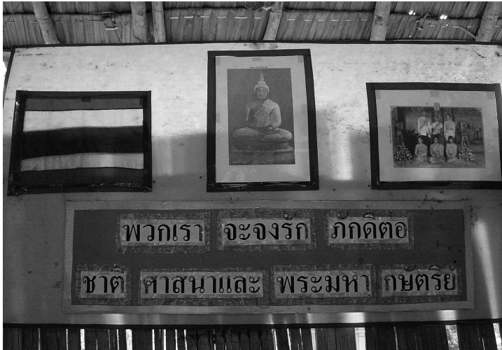
<그림 5> 태국 서남부의 한 카렌족 마을의 학교 현관에 걸려 있는 현판. "우리는 국가와 종교와 국왕에 대해 충성하겠습니다" 라는 문구가 쓰여 있다.

집권 청사진을 발표하자, 여당도 민심을 자기편으로 끌어들이기 위하여 각종 이슬람 진흥 및 강화 정책을 내놓았다(동남아선교뉴스레터 2005/37, 18-19).