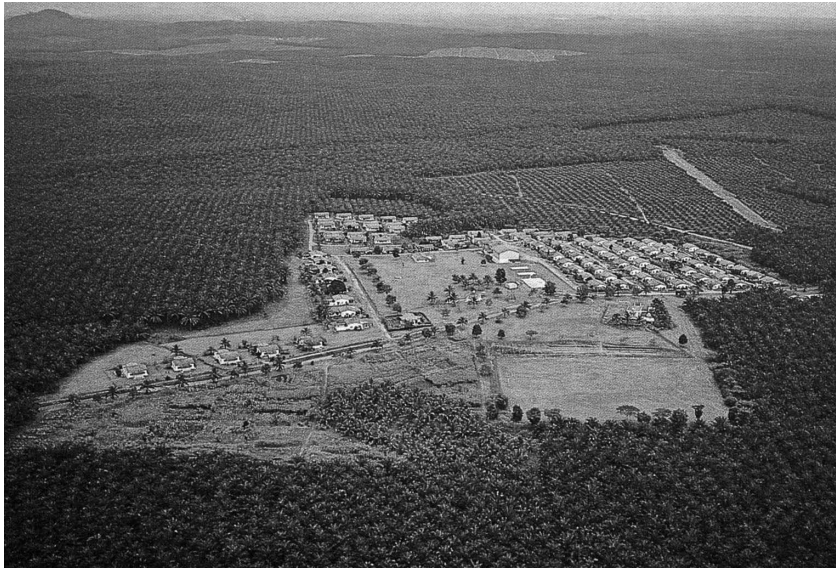
<그림 5> 말레이시아의 기름야자 플랜테이션.

과 인도인들이 대거 이주하여 인구수가 대폭적으로 증가했을 뿐만 아니라 인구 구조도 크게 변화한 것을 들 수 있다. 이 변화는 나중에 이들 국가에서 인도인 혹은 중국인과 관련하여 심각한 민족 갈등의 뿌리가 되었다. 식민주의는 또한 동남아시아 사회에 서양의 사상과 학문을 보급시키고 근대적인 학교교육 체제를 도입했다. 근대적 학교 교육을 통해 식민 지배에서 비롯된 사회적 및 경제적 문제에 대해 새로운 인식을 갖게 된 토착 엘리트들은 민족주의 운동을 이끌어 나갔다 (Steinberg 1987, 347 ff.).