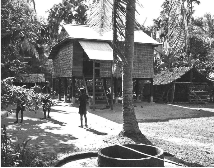
<그림 1> 캄보디아 시엠레엡 근교 농촌의 전형적인 고상가옥

풍부한 강우량이 있고 하천과 운하가 잘 발달한 자연 환경을 갖는 동남아시아의 농경문화는 이 지역의 독특한 토착적인 식품문화와 주거문화를 낳았다. 동남아시아의 여러 나라들에서는 ‘액젓’이 중요한 식품이다. 대표적인 것으로 태국의 남쁠라, 베트남의 느억맘, 캄보디아의 퍽뜨레이 등을 들 수 있다. 이들은 모두 물고기로 만든 생선 간장(魚醬)으로서 동북아시아의 콩 간장(穀醬)과 비교된다. 아시아의 간장 문화에서 가장 오래된 것에 속하는 생선 간장은 고온다습한 기후에서 부패하지 않을 뿐만 아니라 몸에 염분과 단백질을 보충해 주는 적절한 음식으로 일찍부터 발달했다. 또 동남아시아의 농촌 지역에서 흔히 볼 수 있는 고상(高床)가옥은 하천의 유역이나 밀림이 우거진 곳에 정착하여 살기 위해 홍수의 피해에 안전하고 환기에도 좋으며 땅에서 올라오는 습기를 막고 야생동물로부터 보호할 수 있는 가옥으로 발달한 것이다. 이러한 고상가옥은 땅과 집바닥 사이에 공간을 두지 않은 중국식 가옥이나 중국의 영향을 받은 베트남인들의 집과 확연히 구별된다. 그리하여 17세기 라오스의 수린야봉사 왕은 베트남과 국경을 정할 때, 기둥 위에 집짓고 사는 사람은 라오스에 속하고, 땅에 붙어 집짓고 사는 자는 베트남에 속한 것으로 했다고 한다(Wyatt 1984, 122).