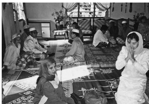
<그림 1> 혼례에서 신부가 이슬람 교리에 따라 혼인서약을 하고 있는 장면

혼인서약은 이맘에 의해 집행된다. 이맘은 혼례에서 혼인서약을 주관하는 공식적인 역할뿐 아니라 혼례의 시작과 끝을 알리는 역할을 수행한다. 그는 혼례의 전반적인 사항을 관장하는 실질적이며 상징적인 존재이다. 혼례에서 이맘의 실질적 역할을 혼례를 이슬람식으로 주관하는 것이다. 이는 혼인서약의 핵심을 이룬다. 말레이시아의 말레이 사회에는 이슬람 교구(kariah)가 있는데, 여기서 보통 1명의 이맘을 임명하여 소관업무를 주관한다. 이맘은 이슬람 사원의 금요 대예배 뿐 아니라 교구 내에서 발생하는 모든 종교 관련 업무를 수행한다. 이런 점에서 각 교구에 속한 이맘은 마치 1인 정부와도 같은 역할을 한다고 할 수 있다. 혼례에서 신부가 소속된 교구의 이맘은 혼인서약은 물론 혼인신고와 등록 등을 포함하여 혼인과 관련된 모든 책임을 지는 존재이기도 하다.