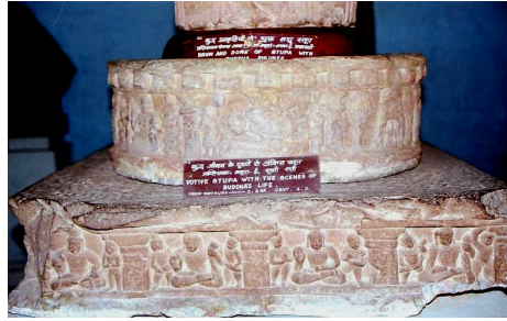
<그림 11> 팔상도(원형부분). 마투라 출토. 쿠산시대. 마투라박물관.

만, ‘八相’의 경우 사상도의 주제를 제외한 나머지 네 장면들은 굽타시대 사르나트 이후에 유행한 팔상의 주제와는 사뭇 다른 양상을 보이고 있어서 팔상이 정착되기 이전의 과도기적 양상을 보이고 있음을 알 수 있다. 7)