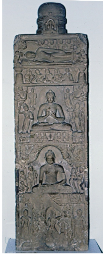
<그림 24> 사상도. 사르나트 출토. 굽타시대. 사르나트고고박물관.

사상도에 표현된 각각의 도상적 특징을 살펴보면, 먼저 ‘탄생’ 장면에서는 마야부인이 두 손을 위로 올려 나뭇가지를 잡고, 허리를 비틀고 있는데, 이와 같은 자세는 고대인도 산치의 약시상에서 유래하며 간다