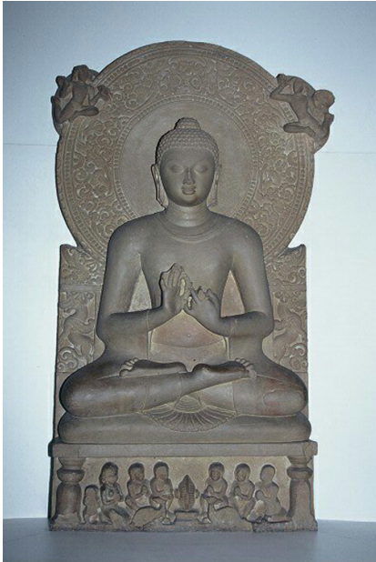
<그림 12> '초전법륜'도, 사르나트 출토, 굽타시대, 사르나트고고박물관.