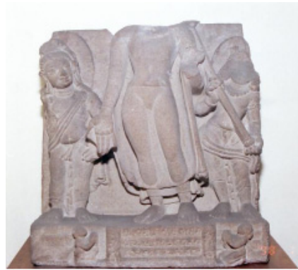
<그림 26> 삼십삼천에서 내려오는 붓다. 사르나트 출토. 굽타시대(5세기경). 캘커타인도박물관.

사상도의 주제 이외의 ‘붓다에게 꿀 공양을 하는 원숭이’ 장면과 ‘술 취한 코끼리를 조복시키는 붓다’ 장면에 이어 ‘삼십삼천에서 내려오는 붓다’ 장면의 경우는 단독의 불전부조도<그림 26>로도 제작되고 있음을 알 수 있는데, 계단 좌우에 무릎 꿇고 합장한 채 붓다를 바라보는 인물이 각각 배치되어 있다. 22) ‘삼십삼천에서 내려오는 붓다’ 장