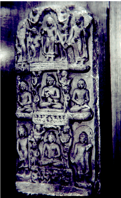
<그림 19> 불전의 여러 장면들. 사르나트출토. 굽타시대(5세기경). 캘커타인도박물관.