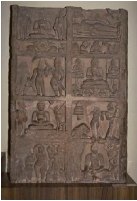
<그림 23> 팔상도. 사르나트 출토. 굽타시대(5세기말 경). 사르나트고고박물관.

리의 모습이다. 쿠산시대 간다라에서는 원 안에 흰 코끼리가 표현되는 것이 일반적이었는데<도 22>, 이곳에서는 원의 모습은 사라지고 흰 코끼리만 표현되어 있어서 굽타시대에 들어와서는 ‘탄생’ 장면에 도상적인 변화가 일어났음을 엿볼 수 있다. 또한 위의 두 작품은 맨 윗부분이 파손되어 있지만, 화면 전개로 보아 열반도가 배치되었을 가능성이 크며, 한 단에 좌우 두장면이 배치되는 것으로 보아 열반도와 또 다른 장면이 배치되었을 가능성이 크다.