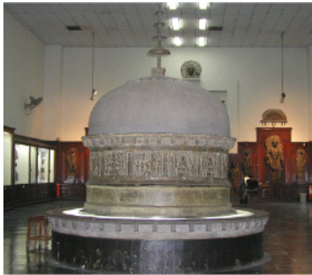
<그림 4> 시크리 스투파, 시크리 출토, 라호르 박물관.