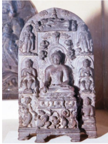
<그림 15> 석가팔상도. 팔라시대. 뉴델리국립박물관.

나 표현기법 등에 있어서 기본적인 틀을 제시했다는 점에서 중요하며, 이후 쿠산시대 마투라와 굽타시대 사르나트에서는 앞 시대의 간다라에 비해 수적인 면에서는 부족하지만, 불전주제의 구성 및 각 장면의 도상 면에서는 각각 다양한 특징을 나타내면서 전개하고 있는 점에서 중요하다고 하겠다. 다음 장에서는 굽타시대 사르나트에서 제작된 불전부조도 중에서 대표적인 작품이라 할 수 있는 사상도와 팔상도를 중심으로 경전에 기술된 불전내용과 함께 도상적 특징을 살펴보겠다.