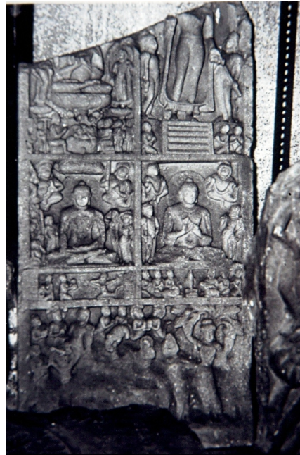
<그림 20> 불전의 여러 장면들. 사르나트출토. 굽타시대(5세기경). 캘커타인도박물관.