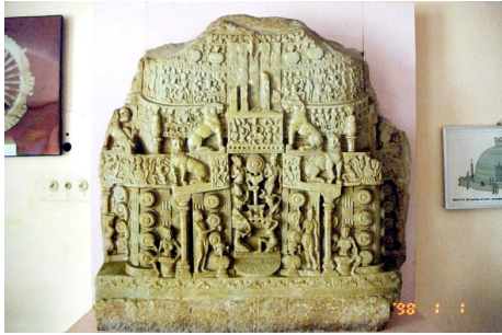
<그림 5> 스투파도. 아마라바티 출토. 사타바하 나시대. 아마라바티고고박물관.

<그림 2>이나 일본 나라국립박물관 불전부조도<그림 3>처럼 이 른바 봉헌소탑의 형식으로 남아 있는 작품이나, 라호르박물관의 시크 리 스투파의 13장면의 불전부조도<그림 4>, 그리고 불전부조도 속에 표현된 스투파의 모습<그림 5> 등을 통해 유추해보면, 불전부조도가 주로 스투파의 기단부나 드럼부 등에 주로 장엄되어 있었던 것을 알 수 있다.