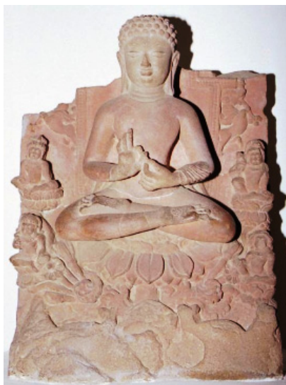
<그림 28> '초전법륜'도. 사르나트출토. 굽타시대(5세기말경). 뉴델리국립박물관.

면을 주제로 한 작품 중에서 스와트 지역에서 출토된 쿠산시대 간다라의 작품<그림 27>이 유명하다. 불상이 표현되지 않던 시기의 작품으로 붓다의 모습은 계단 아래 단에 불족적으로 상징적으로 표현되어 있고, 좌우에는 수행자 모습의 브라흐마(범천, 바라보아 왼쪽)와 귀족풍의 인드라(제석천, 바라보아 오른쪽)가 정면을 바라보면서 합장하고 있다. 불족적 근처에는 민머리의 인물이 무릎을 꿇고 두 손으로 붓다의 발을 만지려는 듯이 표현되어 있는데, 불전의 내용으로 보아 이 인물은 바로 가섭존자라 볼 수 있다.