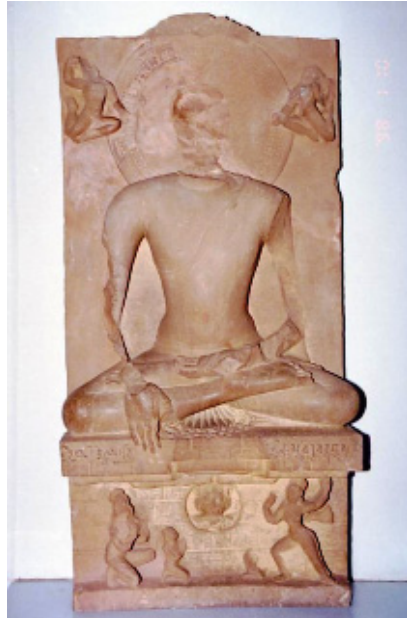
<그림 13> '항마성도'도, 사르나트 출토, 굽타시대, 사르나트고고박물관.