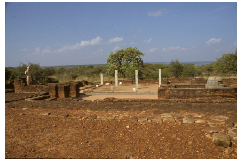
<그림 8> 나가르주나콘다 불교유적지. 익슈바쿠시대. 남인도 안드라지방.

붓다의 생애나 전생에서 일어난 일들을 주제로 삼는 불전미술은 인도고대초기의 산치(Sanci)<그림 6>, 바르후트(Bharhut)를 비롯하여 쿠산시대 간다라에서 크게 유행하여, 100여개가 넘는 주제를 바탕으로 조각이나 회화로 조성되었다. 5) 불전미술은 쿠산시대의 간다라와 마투라, 남인도 사타바하나시대의 아마라바티<그림 7>나 익슈바쿠시대의 나가르주나콘다<그림 8>, 굽타시대의 마투라와 사르나트, 그리고 팔라시대에 이르기까지 텍스트(불교경전)와 화면구성 및 표현기법 면에서 다양한 양상을 나타내면서 전개해왔다.