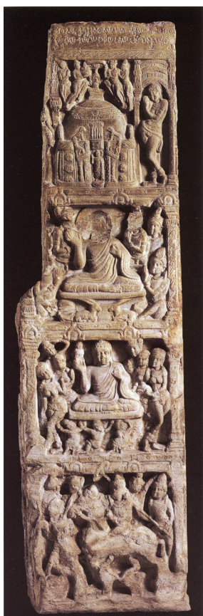
<그림 25> 사상도. 아마라바티 출토. 사타바하나시대. 마드라스박물관.

라의 탄생도에서도 쉽게 볼 수 있다. 그 외의 등장인물은 대부분 파손이 심해 자세히 알 수 없지만, 뉴델리국립박물관의 불전부조도<그림 21>의 탄생장면을 참고한다면, 마야부인을 바라보아 오른쪽은 시녀가, 왼쪽은 마야부인의 오른쪽 옆구리에서 탄생하는 싯다르타 태자, 그리고 태자를 받아내는 인드라가 배치하고 있음을 짐작할 수 있다. 이처럼 사르나트에서는 간다라처럼 마야부인과 인드라에 관계한 시녀와 시자들이 대거 등장하는 것이 아니라, 시녀는 1~2명, 혹은 인드라 혼자 등장하는 등 매우 간소하게 구성된다. 이와 같은 점은 이미 쿠샨시대의 마투라에서도 볼 수 있어서 서북인도의 간다라와는 등장인물 수에서도 큰 차이를 나타내고 있음을 알 수 있다.