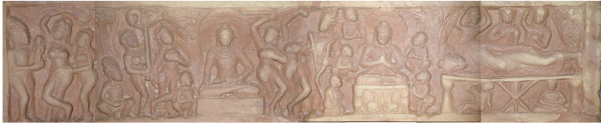
<그림 9> 사상도. 람나가르 출토. 쿠산시대 마투라. 마투라박물관.