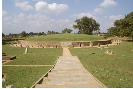
<그림 7> 아마라바티 불교유적지. 사타바하나시대. 남인도 안드라지방.