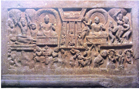
<그림 10> 오상도. 라지가트 출토. 쿠산시대. 마투라박물관.