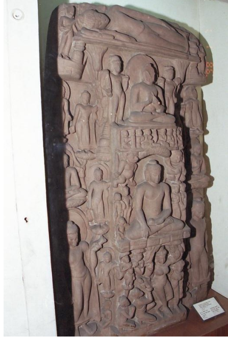
<그림 18> 사상도와 사위성신변도. 사르나트 출토. 굽타시대(5세기경). 캘커타인도박물관.