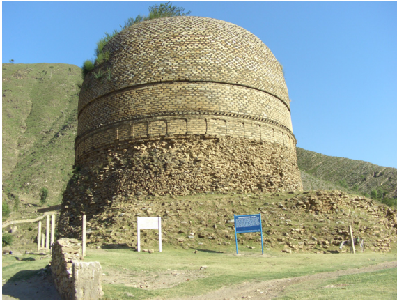
<그림 1> 싱게르다르 스투파, 쿠산시대. 파키스탄 스와트 지역.

한 발전을 보였다. 불전미술 역시 앞 시대의 전통을 이어받으면서도 구성면에서 불교성지와 관련되어 사상도, 팔상도 형식으로 표현됨으로써 작품으로 통한 불교성지 순례라는 시각적인 효과를 극대화하고 있다. 더 나아가 사위성신변도(천불화현도)나 초전법륜도 등 사르나트와 관련이 깊은 주제를 대상으로 한 작품이 단독으로 표현되는 등 매우 독특한 양상을 나타내고 있다. 본 논문에서는 이와 같은 굽타시대 사르나트에서 제작된 불전부조도 중에서 대표적인 작품을 중심으로 그 도상적 특징과 경전상의 기술에 대해 살펴봄으로서 인도불전미술의 전개과정 및 도상특징을 고찰해 보고자 한다.