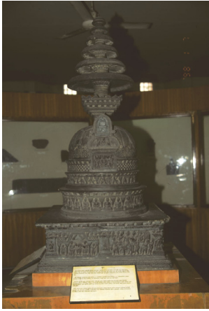
<그림 2> 봉헌소탑, 로리안 탕가이 출토, 쿠산시대. 켈커타인도박물관.