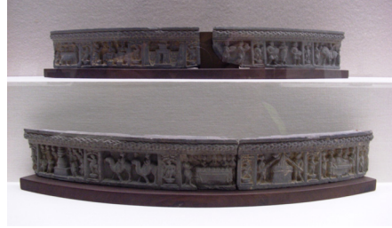
<그림 3> 불전부조도 일부. 쿠산시대. 나라국립박물관.