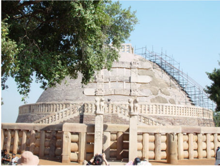
<그림 6> 산치 대스투파 전경.