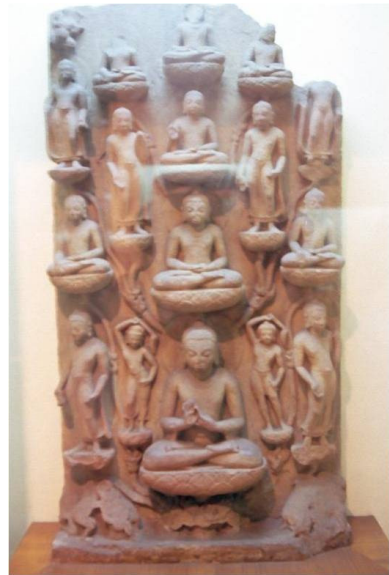
<그림 16> '사위성신변'도. 사르나트 출토. 굽타시대(5세기경). 사르나트고고박물관.

북인도의 사르나트로 그 제작지가 옮겨졌다. 특히 불전미술은 사르나트에서만 제작되었는데 주로 사르나트고고박물관, 캘커타인도박물관, 뉴델리국립박물관 등지에 분산되어 소장되어 있다. 11)