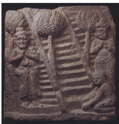
<그림 27> 삼십삼천에서 내려오는 붓다. 스와트 출토. 쿠산시대. 스와트박물관.