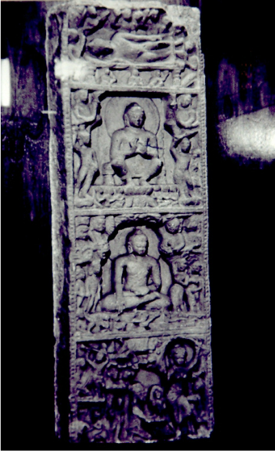
<그림 17> 사상도. 사르나트 출토. 굽타시대(5세기경). 캘커타인도박물관.