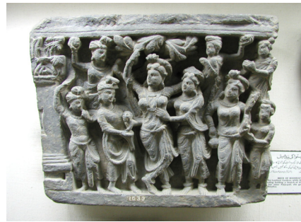
<그림 22> 탄생 간다라출토. 쿠산시대. 라호르박물관.