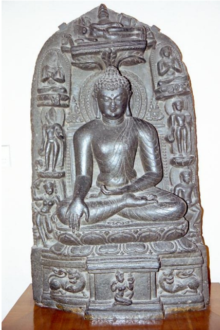
<그림 14> 석가팔상도. 파트나 출토. 팔라시대(14세기경). 캘커타인도박물관.