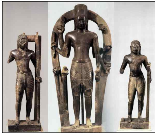
<그림 6> Rama, Visnu, Balarama 입상. Phnom Da 양식. 프리앙코르 시기, 6~7세기. 편암. 캄보디아 Takeo주 프놈다 출토. 프놈펜 국립박물관, 高 각각 185.9, 287.0, 176.0cm.

위에서 언급한 환주는 수·당대에 베트남의 중국 경계에 설치한 주이며(陳佳榮 2002, 875) 30) , 비경(比景) 역시 베트남 중부 지역을 지칭한다(陳佳榮 2002, 177). 31) 따라서 중국에서 베트남으로 넘어와 북에서부터 환주-비경-참파에 이르는 남행 루트를 이야기하고 있으며, 이 루트를 해로로 가면 더 빨리 갈 수 있다는 설명을 하고 있다. 위 기사에 의하면 베트남에서는 정량부가 우세하였으며, 소수의 설일체유부가 존재했음을 알 수 있다. 그리고 여기서 남쪽으로 내려가면 부남, 즉 캄보디아 푸난(Funan)에 다다른다고 하였다. 아울러 이 일대 사람들의 생김새와 함께 의정은 ‘곤륜’을 베트남 지역을 일컫는 의미로 사용하고 있음을 알 수 있다. 그런데 캄보디아를 섬부주 32) , 즉 인간이 살고 있는 세계의 대륙 끝으로 보고 있다는 점과 캄보디아에 불교가 전래된 것은 그리 역사가 오래되지 않았던 것으로 보고 있다는 점이 주목된다. 캄보디아에 불교가 전래된 것은 대략 6세기경으로 추정되고 있다. 그런데 의정이 방문했을 당시에는 다시금 ‘惡王’이 등장하여 불교가 사라지고 외도들이 성행하고 있다고 하였는데, 이는 중계무역으로 번성하던 부남국이 중국의 직접적인 무역개입으로 점차 세력이 약해지고 대신 진랍