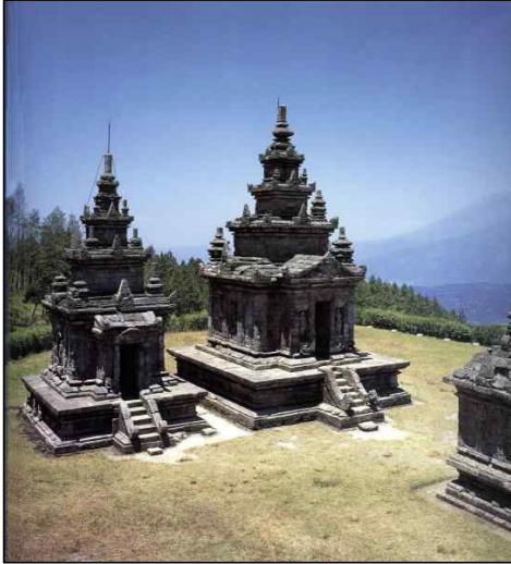
<그림 16> Gedong Songo 제3그룹, 중부자바 기(8세기), 인도네시아 중부자바, Semarang.

물고 있는 이유를 고승들로부터 배울 것이 많기 때문이라고 밝히고 있는데, 이를 통해 당시 동남아시아, 특히 인도네시아의 불교문화가 매우 발전하였음을 알 수 있다. 의정이 머물렀던 당시의 인도네시아에는 아직 보로부두르 사원은 건립되기 이전이었을 것이며, 이보다 약간 이른 시기인 8세기에 세워진 계동 송고(Gedong Songo)와 같은 사원이 비록 의정이 머물렀던 7세기 후반보다 늦기는 하지만 아마도 그가 직접 보고 머물렀던 곳의 모습을 어느 정도 반영하고 있지 않을까 생각된다<그림 16>.