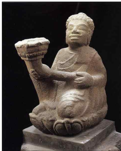
<그림 7> 승려좌상. Champa Dong Duong 양식(9세기말~10세기초), 베트남 Dong Duong 출토. 참파조각박물관. 사암, 高 54.9cm.

서, 의정의 설명에 의하면 스리랑카 사람들은 두벌의 캄발라를 입는데, 재봉질하지 않은 모직천으로 되어 있으며, 허리띠 대신 길이 4m 가량의 넓은 천으로 허리를 둘러 아래로 내려뜨린 복식을 착용했던 것으로 풀이이다. 대북 고궁박물관(臺北古宮博物院) 소장의 <唐閻立本王會圖>에 묘사된 사자국 사절<그림 7>의 모습과 일치하지는 않지만, 의정에 의하면 앞에서 여미는 옷이 아니라 뒤집어쓰는 형태의 옷인 듯하며, ‘두 심(兩尋)’ 길이의 허리에 두르는 길다란 천은 캄보디아 관음보살입상이 착용한 하의<그림 8>나 혹은 남경박물관(南京博物館) 소장 <양직공도(梁職貢圖)>에 나타난 낭아수(狼牙修) 35) 사절이 착용한 몸을 감고 있는