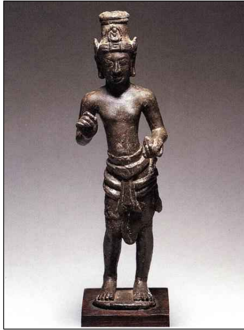
<그림 9> 관음보살입상, 프리앙코르 시기(7세기), 캄보디아 Takeo주 Angkor Borei, Wat Kompong Luong 출토, 프놈펜 국립박물관. 高17.8cm. 출처: 『世界美術大全集』 東洋編12, 東南アジア의 삽도 36 인용.

서, 의정의 설명에 의하면 스리랑카 사람들은 두벌의 캄발라를 입는데, 재봉질하지 않은 모직천으로 되어 있으며, 허리띠 대신 길이 4m 가량의 넓은 천으로 허리를 둘러 아래로 내려뜨린 복식을 착용했던 것으로 풀이이다. 대북 고궁박물관(臺北古宮博物院) 소장의 <唐閻立本王會圖>에 묘사된 사자국 사절<그림 7>의 모습과 일치하지는 않지만, 의정에 의하면 앞에서 여미는 옷이 아니라 뒤집어쓰는 형태의 옷인 듯하며, ‘두 심(兩尋)’ 길이의 허리에 두르는 길다란 천은 캄보디아 관음보살입상이 착용한 하의<그림 8>나 혹은 남경박물관(南京博物館) 소장 <양직공도(梁職貢圖)>에 나타난 낭아수(狼牙修) 35) 사절이 착용한 몸을 감고 있는