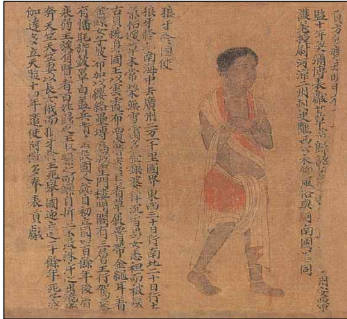
<그림 10> 南京博物館 소장 <梁職貢圖> 중 狼牙國 사절 부분. 출처: 『中國美術全集』 繪 畫編1, 原始社會至南北朝繪畫의 도99 인용.