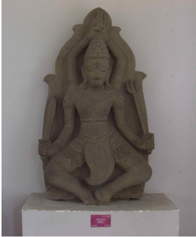
<그림 7> 시바상. 12세기후반-14세기. 베트남 빈딘성 안농현 타프 만출토. 다낭시 참파조각박물관.

리던 궤녕 주변의 빈딘지구로 이전하게 되는데, 이곳에서는 타프 만 사당을 중심으로 활발한 조상활동이 이루어졌고, 이를 가리켜 타프 만 양식이라고 한다. 이 양식은 대체로 신체는 살이 오르고 비대한 모습으로 조형화되지만, 세부표현에서는 극단적이라고 할 만큼 과장된 모습도 보이는 것이 특징이다. 이 작품은 시바의 탄다바(舞踏), 즉 춤을 추는 시바상을 표현한 것으로, 인도의 팔라왕조나, 특히 엘로라석굴에 나타난 무답상과 같은 수많은 팔과 무기를 든 활력에 찬 도상을 아니지만, 양손을 머리 위로 올려 깎지를 끼고, 다른 두 손은 밑