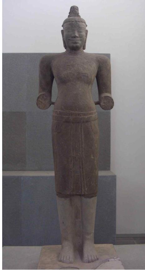
<그림 6> 시바상. 12세기후반-14세기. 베트남 빈딘성 안논현 타프 맘출토. 사암. 높이120cm. 다낭시 참파조각박물관.

다음으로 힌두교의 대표적인 신으로 알려진 시바상에 대해 살펴보면, 먼저 베트남 참파왕국의 대표적인 유적이라 할 수 있는 미선C1에서 출토된 시바입상<그림 6>을 들 수 있다. 이 상은 높이가 193cm나 되는 거상으로 팔꿈치까지의 양손이 모두 결실되었기는 하지만, 나머지 부분은 양호한 편이다. 또 머리 위로 틀어 올린 두발의 정면과 이마 부분이 손상되어, 시바의 표상이라 할 수 있는 두발 정면의 초생달(三日月)과 이마에 새겨진 제3의 눈을 확인할 수는 없지만, 원래는 표현되어 있었을 것이다. 상반신은 나체형이고 하반신은 무릎 아래까지 내려오는褶을 휘감고 있는데, 장신의 키에 넓은 어깨, 그리고 가슴과 복부에는 적당한 근육이 표현되어 있고, 정면을 향해 꼴꼴이 서 있는 모습에서 당당함을 느낄 수 있다. 이와 같은 모습