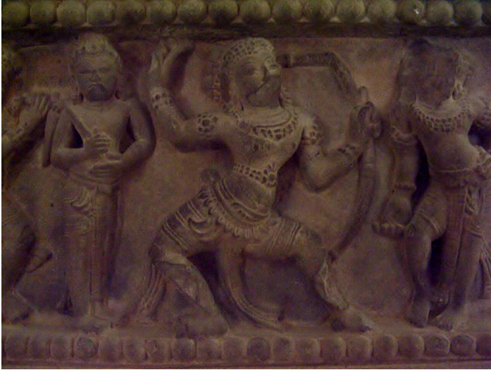
<그림 4> 링가제단 기단부의 루드라의 화살을 꺼내는 라마상(세부표현).

유적에 나타난 새로운 양식의 출현 이후, 참파조각은 새로운 세련미를 추가하게 되어 인물상도 종래의 동주옹 양식에서 벗어나 유연하고 경쾌하게 표현되기에 이른다.