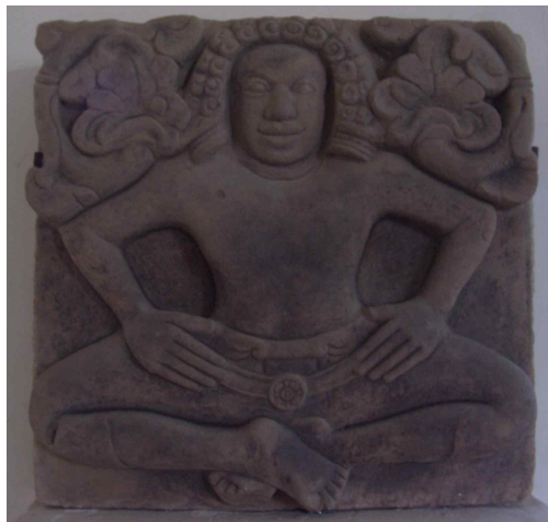
<그림 10> 약사상. 6-7세기. 베트남 꽝남성 즈이젠현 차큐출토. 사암. 높이 68cm. 다낭시 참파조각박물관.

꽝남성 탐 키(Tam Ky)의 안미(An My)에서 출토한 남신상은 남녀 2神 중의 하나이다. 머리카락을 위로 빗어 올려 정상부에서 높게 틀어 올렸고, 둥글게 곁이 진 머리카락을 이마 앞부분과 양옆으로 어깨까지 늘어뜨린 특이한 머리모양을 하고 있는데, 머리에는 삼면에 장식한 한 관이 씌워져 있다. 양쪽 귀에는 앞서 설명한 약사상과 마찬가지로 참파인 특유의 관습이라고 추정되는 커다란 원형의 귀걸이