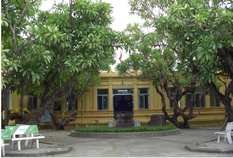
<그림 1> 다낭시 참파조각박물관 전경.

고, 불상도 몇 점 눈에 띈다. 이글에서는 몇몇 힌두교 존상을 중심으로 다낭시 참파조각박물관 소장유물에 대해 간략히 소개하고자 하며, 구체적인 논고는 향후의 과제로 삼고자 한다.