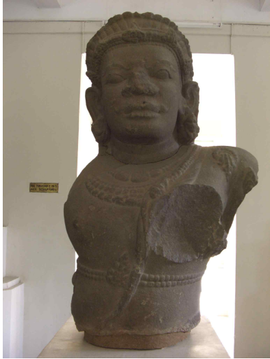
<그림 9> 시바상(마하칼라 흉상). 참파. 10세기 후반. 베트남 꽝남성 즈이젠현 차큐출토. 사암. 높이 126cm. 다낭시 참파박물관.