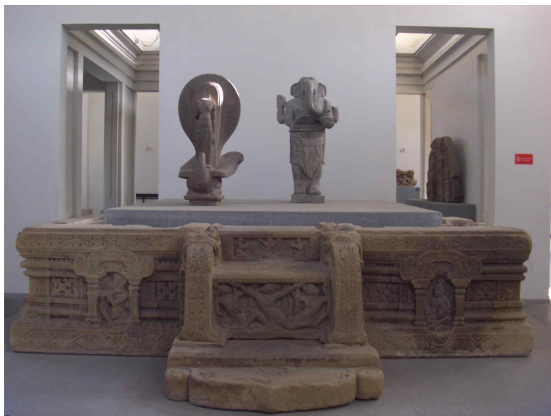
<그림 2> 제단. 참파. 미선티양식. 8세기후반. 베트남 광남성 즈이센현 미선 출토. 사암. 기단 높이65cm. 다낭시 참파조각박물관.

장식이 있는 기둥 사이에 앉아 하프를 연주하는 인물이 배치되어 있다. 이 외에도 바라문들의 일상을 나타내는 다양한 도상이 표현되어 있어 당시의 풍속을 파악할 수 있는 좋은 자료가 된다. 또 다양한 곳에서 자주 나타나는 꽃문양은 인도 굽타양식의 당초문에서 그 기원을 찾을 수 있어서 인도와의 연관성도 찾을 수 있다. 인도문화의 영향을 받긴 했지만, 문화의 수용과 변용이라는 전개 과정을 거치면서, 참파 독자의 문화요소가 이곳에서도 여실히 드러나고 있음을 알 수 있다.