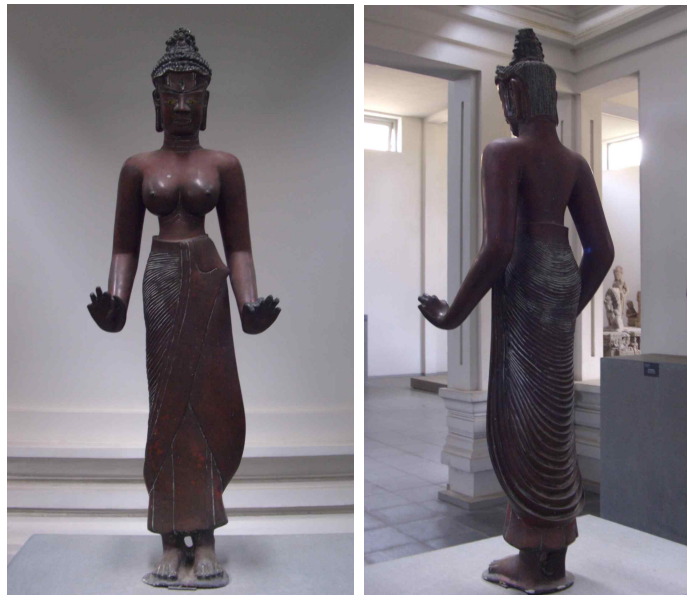
<그림 8, 8-1> 락슈민드라 로케슈바라입상. 9세기말-10세기초. 베트남 짱남성 당빈현 동주옹 출토. 청동. 높이114cm. 다낭시 참파박물관.

다음으로 락슈민드라 로케슈바라입상이라 불리는 작품<그림 8, 8-1>도 매우 독특한 형태를 취하고 있다. 이 작품은 짱남성 당빈현의 동주옹에서 출토하였는데, 9세기말이나 10세기초의 참파의 동주옹 양식을 보여주는 작품이다. 머리카락을 위로 틀어 올려 장식한 두발