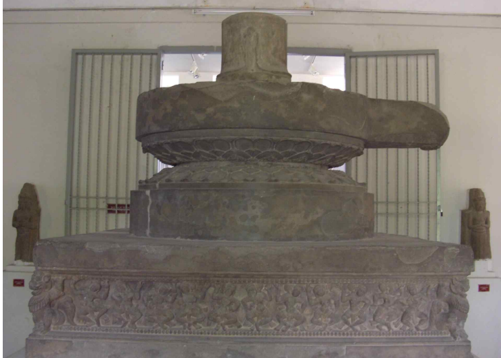
<그림 3> 링가제단. 10세기후반. 베트남 팡남성 즈이센현 차큐 출토. 사암. 높이190cm. 다낭시 참파조각박물관.

생각되는 사람 얼굴 모습의 기와도 나와 주목을 받기도 했다. 다만, 이 시기 이후의 상황에 대해서는 그다지 명확하지는 않지만, 6-7세기의 비교적 이른 시기의 작품도 출토되었고, 10세기후반까지의 전기차큐양식, 그리고 11세기전반부터의 후기차큐양식 등으로 추정되는 유물이 다수 발굴되었다. 출토유물의 대부분은 다낭시 참파조각박물관에 소장되어 있다.