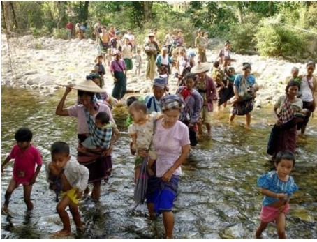
<그림 4> 국경을 넘고 있는 카렌족 난민.