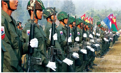
<그림 6> KNDO의 열병 장면.

그러나 이러한 요구는 무산되고 1948년 말에 발생한 카렌족과 버마족의 충돌사건에 이어 미얀마 정부군의 카렌족에 대한 탄압이 시작되면서 KNU는 본격적인 반정부 부장활동에 들어갔다. KNU는 1949년 3월 20일에는 따웅우에서 국명을 ‘꼬톨레(Kawtoolei)’로 하는 독립국가를 정식으로 선포하였고, 그 해 6월에는 카렌족 군사조직을 꼬톨레국군으로 통합하였다. 1952년에 미얀마 동쪽 산지를 중심으로 한 카렌주가 미얀마정부의 헌법 개정에 의해 설치되었지만, KNU는 여전히 에야워디 델타지역이 제외된 점을 들어 협상을 거부하였다. 1962년부터 본격화된 미얀마 정부군의 KNU에 대한 지속적인 총공세는 KNU의 존립 자체에 대한 위기까지 몰리게 되었다. 게다가 KNU를 제외한 여타 소수종족 반정부 무장조직의 대부분이 미얀마 정부와 평화협상을 체결한 상태여서 더욱 고립의 상태가 가중되었다.