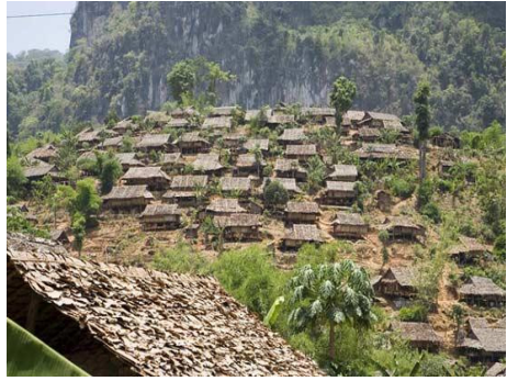
<그림 5> 미얀마-태국 국경지대의 카렌족 난민촌 모습.

또한, 1996년 이후 미얀마 군사정부는 소수민족 반정부 무장집단의 배후지로 여겨졌던 미얀마 동부 산지의 정부통제권 강화를 위하여 대규모의 정부군 병력을 파견하였고, 군사작전에 방해가 된다고 여겨지는 민간인 거주지를 강제로 이주시키는 정책을 자행하였는데 이때에도 수많은 카렌족이 강제 이주 당하였다. 2006년 한 해에만 약 76,000명이 강제 이주를 당하였고, 그 중에서 주로 카렌주와 버고(Bago) 지역에 거주하고 있는 약 43,000명의 카렌족들이 집단 이주를 당하였다(TBBC 2007). 이렇게 강제 이주된 카렌족 난민들은 태국음식을 먹고 태국어를 능숙하게 구사하기도 하는 등 미얀마 내 거주하는 카렌족 집단과 언어적 측면, 생계경제 유형, 의식주의 양상 등 문화적 측면에 있어서 많은 차이를 나타내고 있다. 이러한 양상은 현대에 있어서 카렌족의 종족개념을 이해하는 데에 혼란스러운 요소들이 되고 있다.