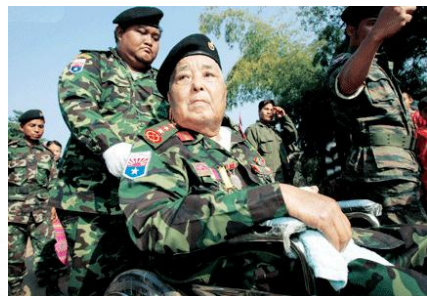
<그림 7> KNU의 수장 보미야.

<그림 7>에서 보이듯이 1968년 반정부 활동을 전개했던 보미야(Bo Mya)장군이 카렌족을 재정비하고 강력한 지도력을 발휘하며 70년대와 80년대를 거치면서 약 1만 명에 가까운 병력을 보유하는 등 KNU는 반정부 군사조직의 최대 규모로 성장하였으나(Smith 1994:44-45), KNU 내부에서 빚어져 왔던 지도부와 하급 장교들 간의 종교적 갈등과 지속적인 미얀마정부군의 대공세 등으로 인해 KNU의 존립은 항시 위