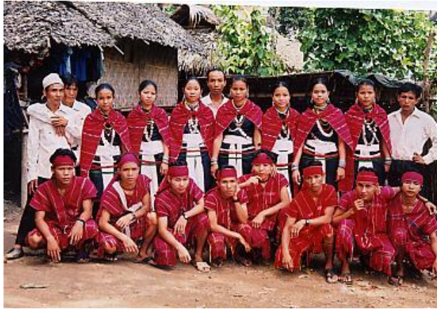
<그림 2> 붉은색의 전통 의상을 착용한 카렌니족.