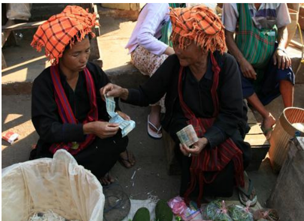
<그림 1> 북부 산(Shan)주의 수도 따웅지(Taunggy)에 거주하는 빠오족 여인들의 모습.

이와 같이 당시 언어의 차이에 따른 카렌족의 하위종족 분류는 매우 다양하고 복잡하며 이러한 카렌족 종족성의 느슨함으로 인해 미얀마의