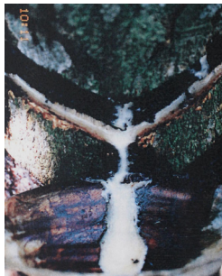
<그림 2> 검양옷나무 변종의 수액.