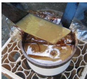
<그림 11> Rhus Verniciflua의 수액. (옷산 Urushiol)

일반적으로 옷의 품질은 식재된 토양과 기후의 영향 많이 받는다. 기후와의 관계성은 강수량이 적을수록 수분함량이 낮아 품질이 좋고 보존성도 좋기 때문에 비오는 날에는 채집하지 않는다. 반대로 건조한 기후는 수액 속의 점도가 높아지기 때문에 질이 좋지 않다. 따라서 동북아시아에서는 6-11월에 옷을 채집하며, 동남아시아의 옷 채집 시기는 지역에 따라 상이한데, 베트남의 경우 우기가 끝나고 기온이 떨어지기 전까지가 적기이며, 특히 8-10월이 가장 질이 좋은 옷이 채취된다. 미얀마는 여름이 가장 좋고, 우기는 그 다음이고, 건기는 가장 나쁘다.