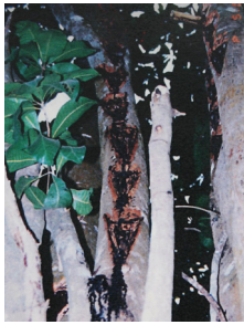
<그림 8> Burmese lacquer tree의 줄기.

Burmese varnish tree, black varnish tree, lignum-vitae of Pegu이며, 미얀마에서는 thitsi, kiahong, 타이에서는 rak, hak, 인도에서는 khen, sootham으로 불린다. 수액은 도료 이외에 종이나 천의 방수가공재로도 이용된다.