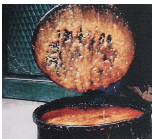
<그림 12>검양옷나무 변종의 수액. (옷산 Laccol)