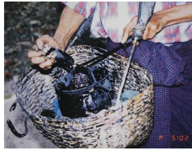
<그림 10> Burmese lacquer tree의 수액 채취 모습. 출처:『漆植栽地-漆樹と採取方法』VI-5 인용.

캄보디아웃나무(학명 Gluta laccifera PIERRE ; 異名 Melanorrhoea laccifera PIERRE)는 인도차이나가 원산으로, 베트남에서는 son, son dao, suongtien, 캄보디아에서는 kroeul, 라오스에서는 nam kien으로 불린다. 수액의 양은 많지 않으며, 다른 수종에 비해 광택이 적고 품질이 낮은 것으로 알려져 있으나, 금속과의 결합이 좋아 오래 동안 변색되지 않는 것이 특징이다.