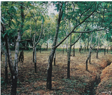
<그림 6> 검양옷나무 변종. Vietnam Dao-Xa.

먼저, 검양옷나무의 변종인 Rhus succedanea Linnaeu. var. damoutieri Kudo et Matsumura는, 安南漆, 혹은 印度漆, black tree, annam wax tree로 불리우며, 동남아시아가 원산지이다. 원래, 검양옷나무는 가을에 붉게 단풍이 들고 낙엽이지만, 안남옷나무는 단풍이 들지 않는다. 주로 베트남을 중심으로 분포하고 있으며, 자국 내에서는 Cay son으로, 부탄에서는 se로 불린다. 같은 종의 옷나무가 일본인에 의해 타이완에 이식되어져 생육되고 있다.