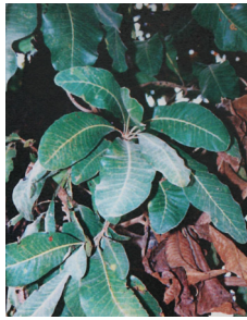
<그림 9> Burmese lacquer tree의 잎.