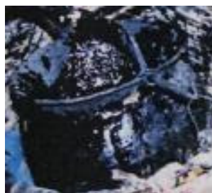
<그림 13>Burmese lacquer tree의 수액. (옷산 thitsiol)

또, 품질의 식별은 옷산의 종류의 상이성보다는 수액 속의 옷산의 함유량과 색, 냄새, 건조시간 등으로 판별한다. 옷나무 수액 속의 옷산 함유량은, 나무의 나이와 채취 방법에 의해 크게 영향을 받는데, 옷산은 오래된 나무보다는 어린나무에 많이 함유되어 있다. 특히 한국, 일본, 베트남의 채집방법은 옷의 채취가 끝난 나무는 베어버리는 殺搔法이기 때문에 옷산의 함유량의 차이는 적고, 중국, 미얀마의 경우는 채취가 끝