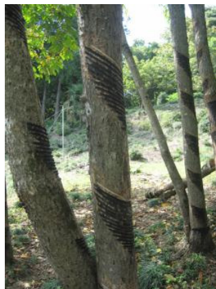
<그림 5> Rhus Verniciflua 의 줄기.

동양에 있어 대표적인 식물학 기록인 李時珍(1518-1593, 本草學者)의 『本草綱目』木部, 漆部分에는 「集解曰, 保昇曰, 漆樹, 高二三丈餘, 皮白, 葉似, 椿, 花似, 槐, 其子似牛李子, 木心黃, 六月七月取滋汁」, 즉, 웃나무는 높이 약6~10m로, 수피는 희고, 잎은 참죽나무(椿), 꽃은 회화나무(槐), 열매는 서리자(鼠李子)와 닮았다. 木心은 황색이며, 6월부터 7월에 수피에 상처를 내어 수액이 흘러나오는 것을 채취한다고 쓰여 있다. 같은 책 乾漆部分에는 「…乾漆療血痞結腰痛女子疝瘕利小腸去蛇蟲…」, 즉, 수액을 말려 사용하는 건칠은 혈행장애로 인한 요통 및 여성의 아랫배통증 완화, 소장의 회충을 제거하는 등의 약재로 쓰여 졌고, 살충의 효과가 있는 잎은 말려 가루로 쓰고, 열매는 지혈제로, 꽃은 소아병에 사용된다고 기록하고 있다. 또한, 예로부터 중국과 한국, 일본의 민간에서는 어린잎은 데쳐서 나물로 먹었고, 특히 한국에서는 어린가지를 이용해 요리한 웃담을 애용하여 왔다.