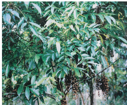
<그림 7> 검양옷나무 변종의 잎. 臺灣.

미얀마옷나무(학명 Gluta usitata DING HOU ; 異名 Melanorrhoea usitata WALLICH)는 미얀마가 원산으로 미얀마의 북부산악지대와 타이의 북부지역, 인도 등에서 생육된다. 英名은 Burmese lacquer tree,