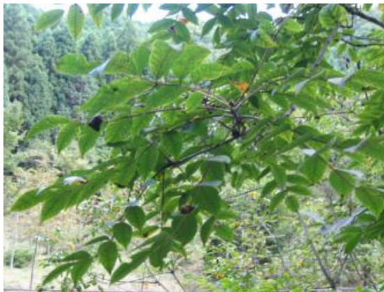
<그림 4> Rhus Verniciflua 의 잎.

나무(학명 Rhus trichocarpa Miqyel), 산검양웃나무(학명 Rhus sylvestris Sieb), 검양웃나무(학명 Rhus succedanea Linnaeus), 덩굴웃나무(학명 Rhus ambigua Lavallee), 붉나무(학명 Rhus chinensis Miller)의 6種이 분포하고 있으며, 중국에는 이들 6종을 포함한 20여종이 분포하고 있다. 이 중에서 주로 수액을 채취하는 나무는 Rhus Verniciflua 이다.