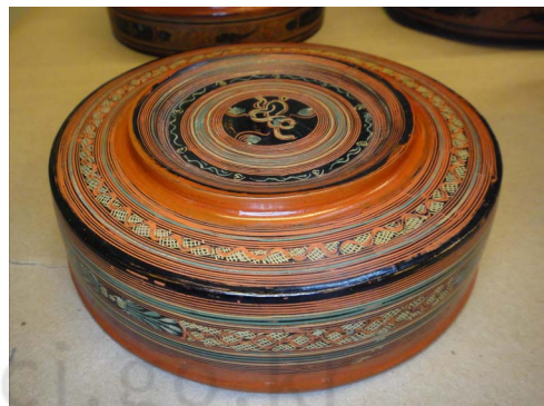
<그림 4> 미얀마 칠기, 뉴욕 자연사박물관소장

만달레(Mandalay) 지구의 버강은 미얀마 최대 칠기생산지이다. 버강은 불탑과 사원이 즐비한 불교의 성지로 국내외의 순례자들이 방문