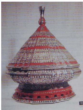
<그림 3> 태국 나전칠기 19세기

태국 칠기 및 칠공예품에서는 장식기법으로 금박(Lai Rot Nam), 색칠(Lai Kammalaor), 조칠(Lai Kud), 유리, 조개, 계란껍질을 이용한 나전 등이 사용되었다. 특히 나전을 이용한 칠기는 야유타야 시대에 절정을 이루고 왕궁이나 사원의 주문에 의해 제작되었다.