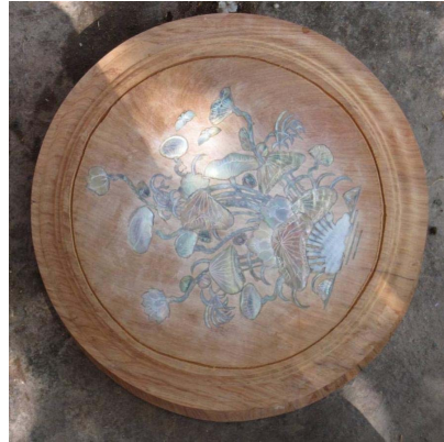
<그림 1> 베트남 나전칠기 5번째 과정을 마친 상태

기록이 남아있어 늦어도 베트남의 나전칠기는 13세기전반에는 개시된 것으로 여겨진다.