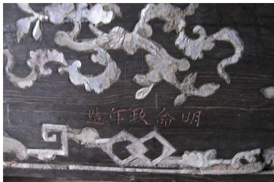
<그림 2> 베트남 민망(明命) 9년(1837) 나전칠기 탁자

이러한 베트남 나전칠기는 19세기 후반 만국박람회(萬國博覽會)등에 소개되는 등 오랫동안 유럽에서 높은 평가를 받았고 일부는 프랑스 학자들에 의해 책으로 소개되었다.(그림 2) 최근 베트남의 칠은 칠기나 나전칠기를 제작하는데 사용하는 데 그치지 않고 칠이나 나전을 이용한 칠회화 및 나전회화 등 새로운 영역에 사용되기도 한다.