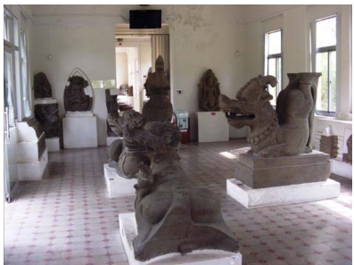
[23] 다낭시 참파조각박물관 내부