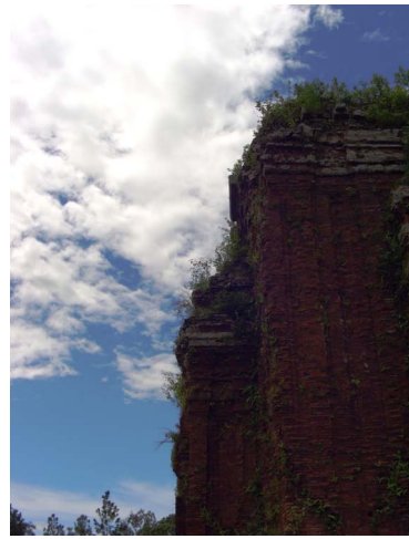
[16] 쉥단 유적(3기 중에서 가장 오른쪽)

3기의 사당 앞면에는 몇몇 건물지의 흔적이 남아 있었고, 박물관 내부의 소장품 등으로 보아 상당한 규모의 사원이 이곳에 있었음을 짐작할 수 있다. 붉은 벽돌로 정성스럽게 쌓아올린 벽면과 입구장식, 그리고 기단부에 조각된 춤을 추는 듯한