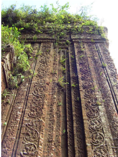
[19] 정면 입구 장식, 쿠옹미 유적