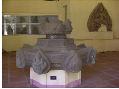
[15] 쉥단 유적 내 박물관 내부

곳에 도착했는데 문이 닫혀있어서 구체적인 조사는 못했지만, 외부에서 사진 및 간단한 조사는 가능했다 [15].