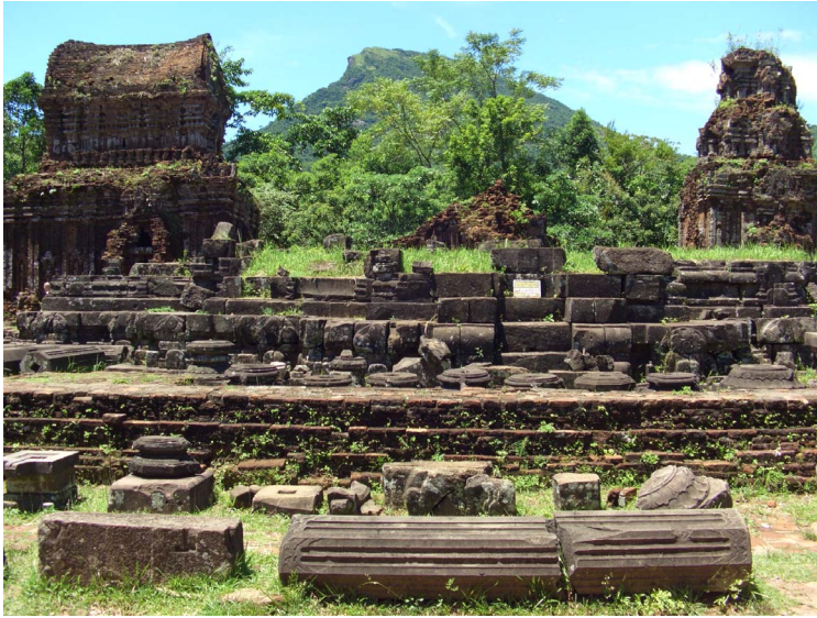
[3] 미선 B1 주사당

터에 위치하고, 왕도 짜끼에우에서 남서 14킬로미터에 있다. 미선 유적군은 주위가 산으로 둘러싸여 있고, 북쪽에는 짜끼에우를 경유해서 교역도시 호이안까지 이어지는 투봉 강의 지류가 흐르고 있다. 7세기말부터 13세기말까지 60여기의 건물이 계속해서 조영되어 힌두교 최대의 성지라고 불렸다. 신왕숭배(神王崇拜)의 장으로뿐만 아니라, 화장 후의 왕들의 유골, 유품을 봉납한 분묘(墳墓)도 검했다고 한다. 미선 B, C, D 그룹은 9세기말에서 10세기후반까지 조영된 중심 가람의 이루고 있는데, 이 미선유적을 기술한 최초의 비각문은 4세기말에 나타나며, 바두라바르만 왕이 스스로를 신왕(神王) ‘바두레슈바라’ 라고 칭했기 때문에 링가사원을 건립했다고 한다. 또 6세기말 루두라바르만 왕이 통치하던 때에 큰 화재가 나서 목조 사원군이 대부분 손실된 탓에, 7세기초기, 산부바르만 왕이 내구성이 높은 재료인 벽돌을 이용하여 사원을 재건했다는 기록도 있다. 그 후, 13세기까지 이 지역에는 시주와 건물의 조영이 계속되었다고 한다. 지금까지 남아있는 유물 중에 가장 오래된 것은 8세기로 거슬러 올라가는 미선 E1 주사당(主祠堂)의 제단이다. 982년에 북쪽의 대월(大越)과의 전쟁으로 많은 건물과 석비가 파괴되었고, 그후 왕국의 중심은 남쪽으로 옮겨가 11세기에는 파리바르만 왕(재위 1074-86)이 미선을 재건했다. 이때 B1 주사당, E4 부사당 등 많은 탑당