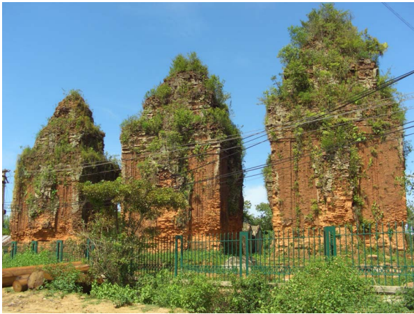
[17] 쿠옹미 유적