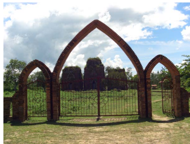
[13] 쳡단 유적

챙단 유적[13]은 평지에 3기의 사당이 나란히 건립되어 있고, 주위에는 제법 규모가 갖춰진 박물관[14]이 있다. 점심 무렵에 이