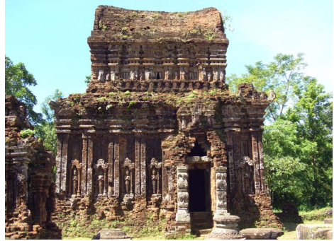
[4] 미션 B5 보물수창고

미션 유적군에서 처음으로 마주치게 되는 C그룹과 B그룹은 모두 동쪽을 향한 가람양식으로, 주벽으로 나뉘져 있지만, 두 개의 그룹은 서로 관련되는 건물군이다. 또 D그룹의 비문창고로 사용되기도 하며, D2