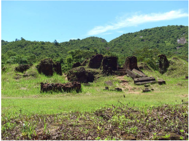
[10] 미션 A 그룹

를 분리하는 벽의 두께가 크게 달라, 원래 주방부와 전방부를 분리하여 조영하였다는 점을 시사하고 있다.