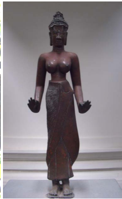
[12] 여성상, 동즈영 유적 출토

을 갖지만, 그곳에는 어딘지 모르게 따뜻한 표정도 간취할 수 있어서 이와 같은 표현이 참파왕국의 구성원인 참족 사람들이 조형한 작품에서 나타나는 본질적 성격이라고도 생각된다. 한편, 위에서 언급한 상들은 일반적으로 대승불교의 조상이라고 할 수 있지만, 사원명은 ‘락슈민드라 로케슈바라’(비슈누의 神妃 락슈미=길상천과 인드라=제석천, 및 로케슈바라=세자제보살 혹은 관자제보살의 일체화한 모습으로 추정됨)로 대표되듯이, 원래 석가 혹은 로사나불을 가리킨다고 생각되는 중존의 불의상을 비롯하여, 모두 힌두신과 불교신이 합체한 특수한 존명이 추정되며, 예를 들어 청동제 여성형 보살상은 그 사원 이름을 구체화한 도상이라고도 볼 수 있다는 학설도 있다. 이 지역에서는 불교와 힌두교와의 습합적 신앙의 실태가 엿보이기도 하고, 특히, 이시기에 불교가 왕권의 종교로서 채용된 것에 관해서는 당시의 중국과의 교류라는 측면에서도 생각해봐야 할 것이다.