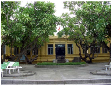
[22] 다낭시 참파조각박물관 전경

끝으로 다낭시 참파조각박물관 소장품의 유물은 7세기에서 15세기까지 6기의 시대순으로 분류되어 있다. 대체로 7~8세기 인도화한 미술, 9세기~10세기초의 동즈엉(Dong Duong) 불교미술, 10세기의 고전미술, 1000년~1177년의 비자야 미술, 12세기경의 타프 만 미술, 1177년~15세기의 쇠퇴기 미술로 구분할 수 있다. 참파 유적에서 출토한 많은 유물들이 이곳에 소장되어 있어서 참파 유적과 함께 반드시 들려봐야 할 곳이라 생각한다.