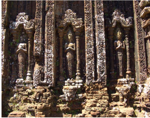
[6] 시바상, 다낭시 참파조각 박물관(미선 C1 주사당 출토) [7] 미선 C1 주사당 벽면 여신상