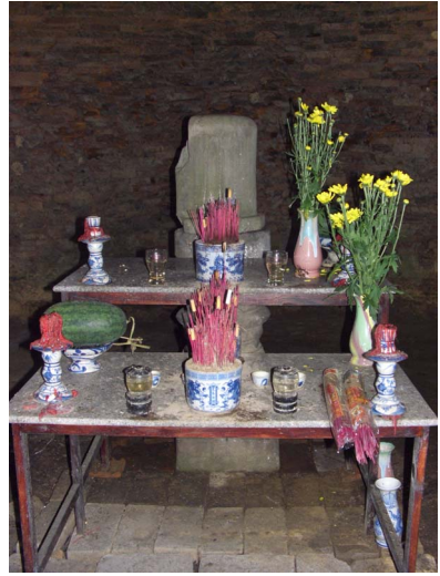
[21] 방안 유적의 사당 내부