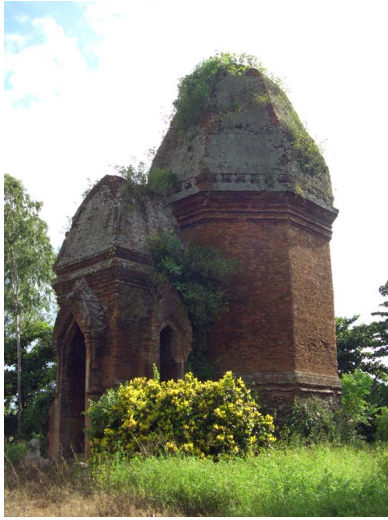
[20] 방안 유적 전경