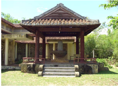
[14] 쉥단 유적 내 박물관