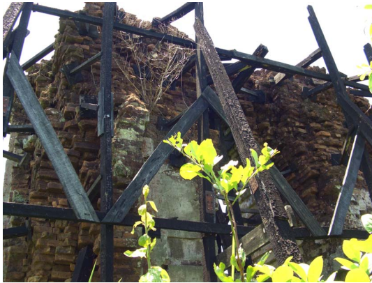
[11] 동즈영 유적