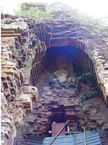
[18] 내부 구조, 쿠옹미 유적