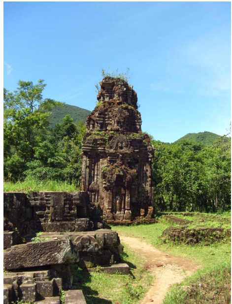
[5] 미션 C1 주사당

와 D3 비문창고는 C그룹에, 그 외는 B그룹에 속하는 등 복잡한 양상을 보이기도 한다. B1 주사당[4]과 C1 주사당[5]의 커다란 종교적 차이점은 B1 주사당이 시바 링가형식의 주신(主神)을 모시고 있는 반면에, C1 주사당은 시바상이 주신으로 되어 있는 점이다. 이 시바상은 현재 다낭시의 참파조각박물관에 소장되어 있다. 이 시바상[6]은 2m에 가까운 거대한 상